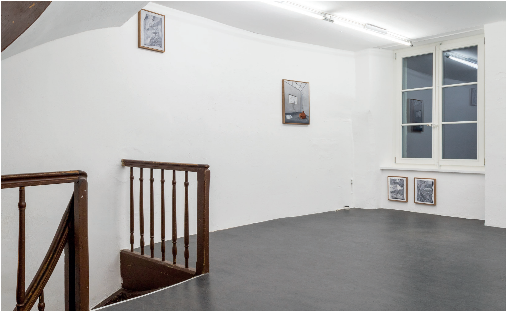
Ausstellungsansicht, „Kantonale Förderpreisträger*innen 2022“ S11, Solothurn, 2022