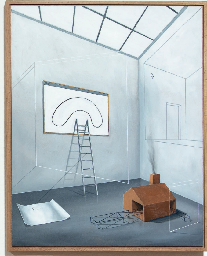
Aussichten_I 2021 40cm x 50cm, Öl auf Hartfaserplatte