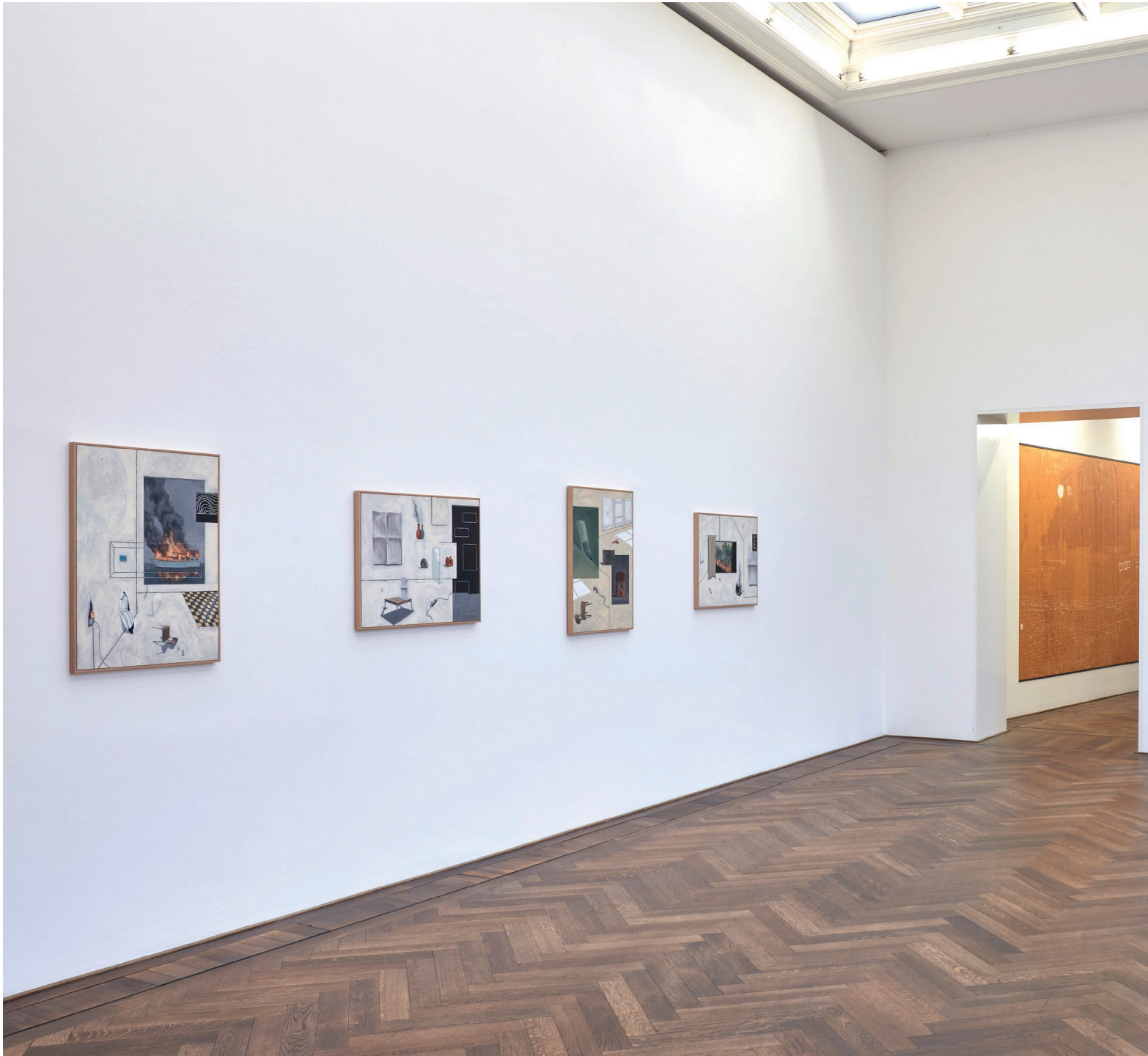
Ausstellungsansicht, Regionale 22, ... von möglichen Welten , 2021. Kunsthalle Basel, 2021.