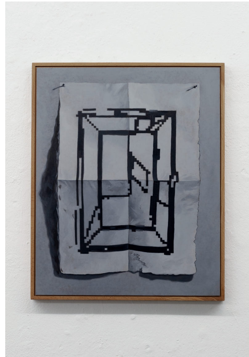
Objekt_VII 2022 40cm x 50cm Öl auf Hartfaserplatte