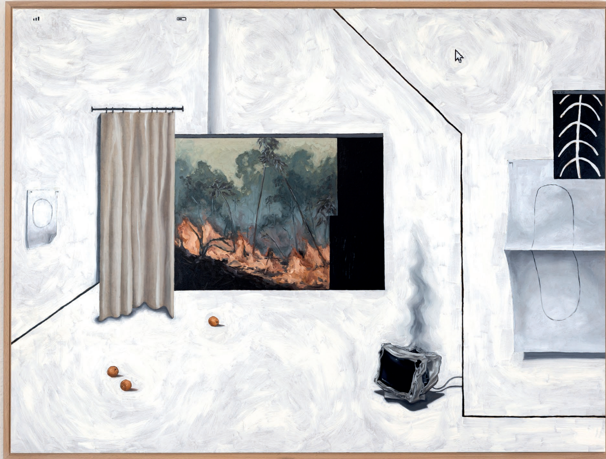
Room VII 2020 80cm x 60cm Öl auf Hartfaserplatte