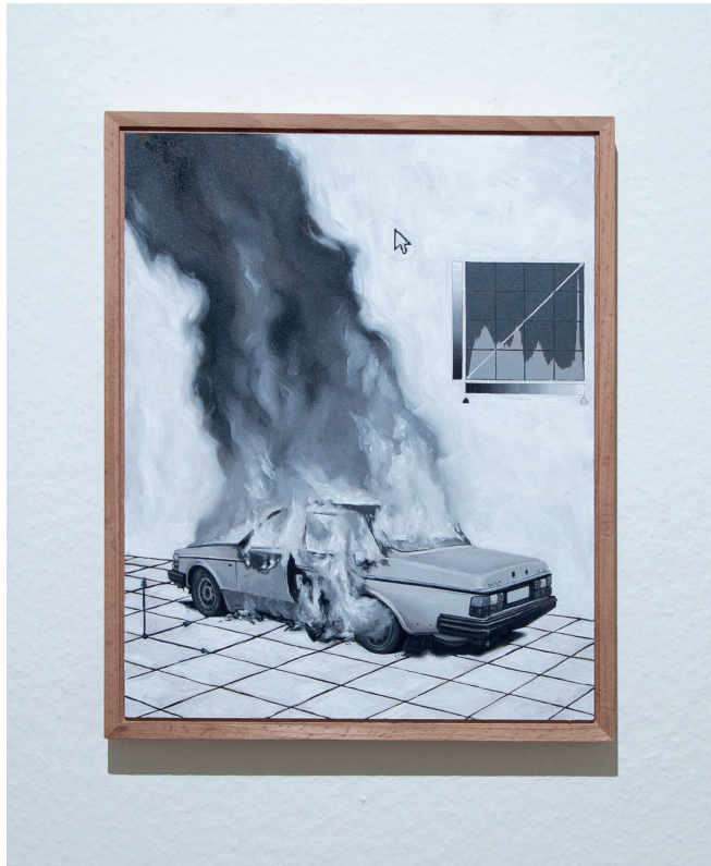
oben: ausgerastert 2022 24cm x 30cm Öl auf Hartfaserplatte