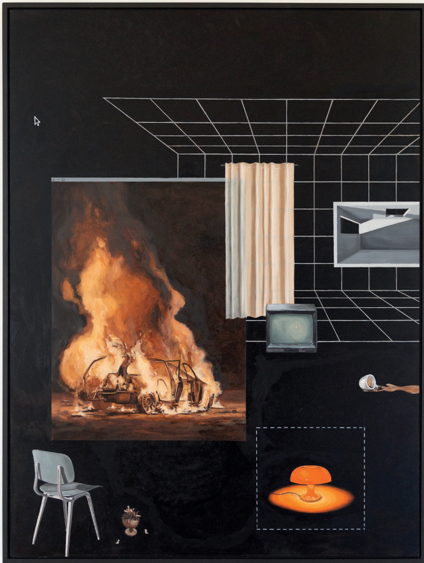
Room_raster_I 2022 60cm x 80cm Öl auf Hartfaserplatte