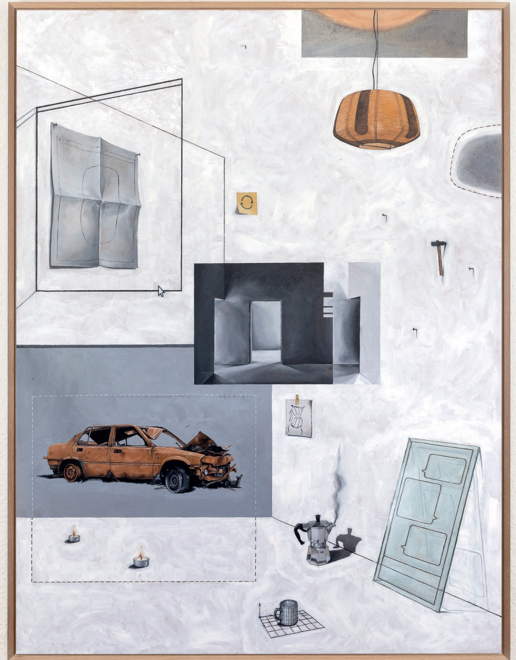
rechts: Room untitled_IV 2021 60cm x 80cm, Öl auf Hartfaserplatte