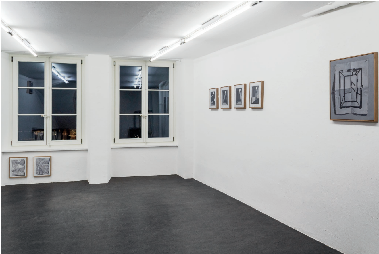
Ausstellungsansicht, „Kantonale Förderpreisträger*innen 2022“ S11, Solothurn, 2022