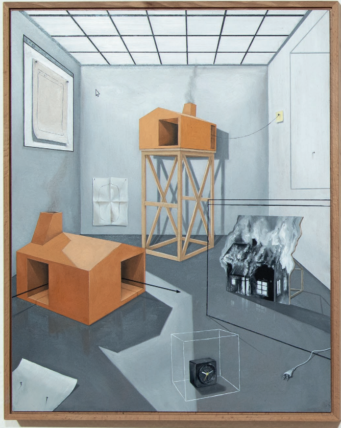
Aussichten_II 2022 40cm x 50cm, Öl auf Hartfaserplatte