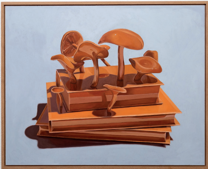
Objekt_IV 2022 50cm x 40cm Öl auf Hartfaserplatte