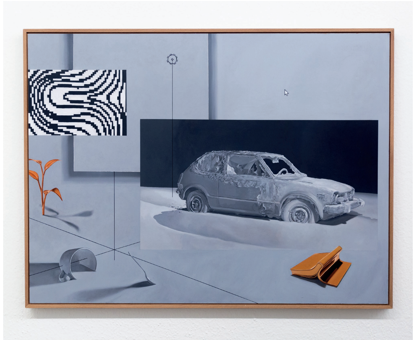
nature_morte_III 2022 80cm x 60cm Öl auf Hartfaserplatte