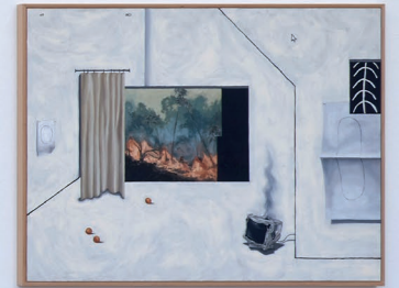
Ausstellungsansicht, Regionale 22, ... von möglichen Welten, 2021. Kunsthalle Basel, 2021.