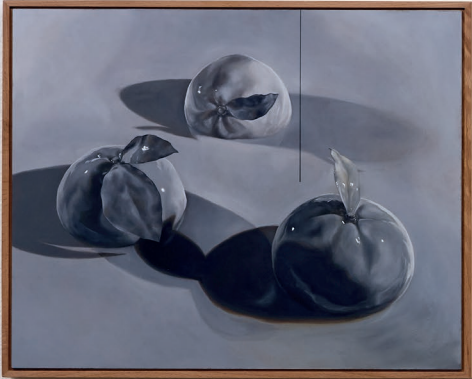
Objekt_II 2022 50cm x 40cm Öl auf Hartfaserplatte