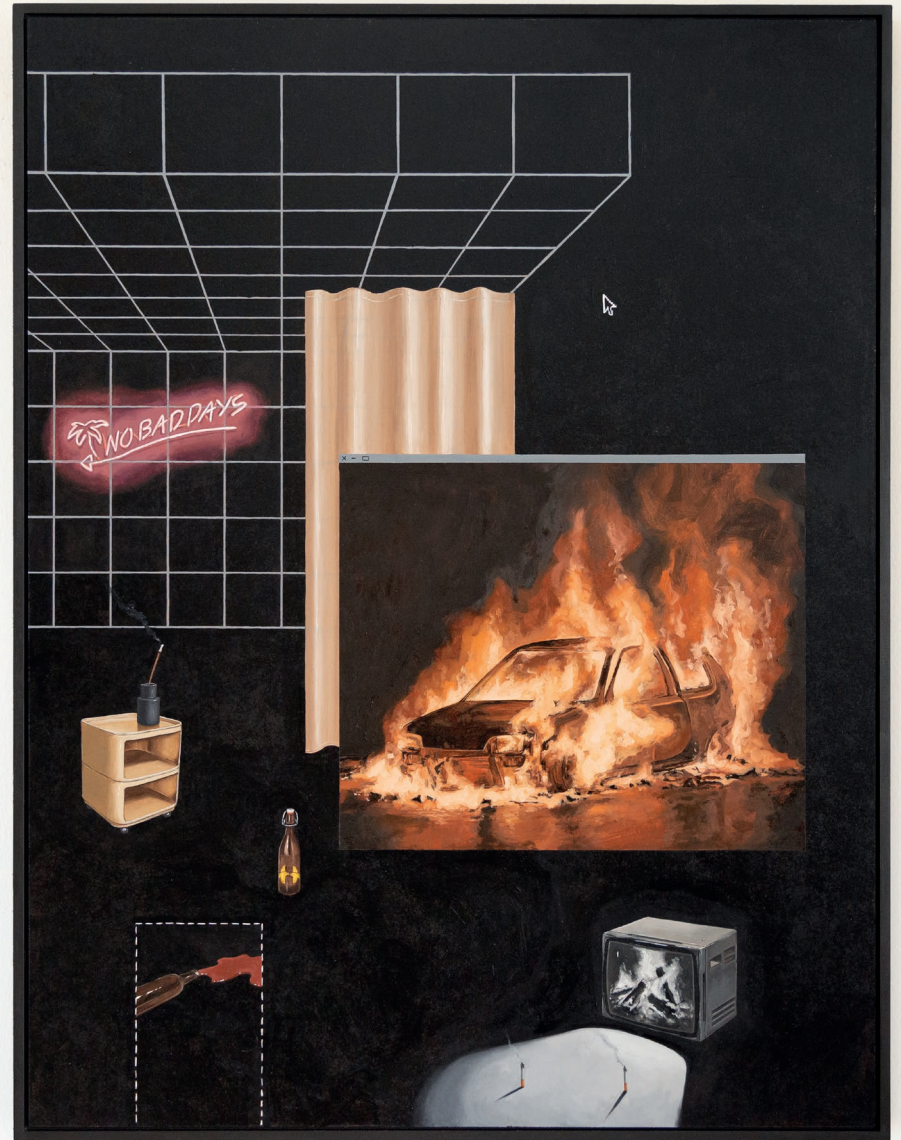
Room_raster_II 2022 60cm x 80cm Öl auf Hartfaserplatte