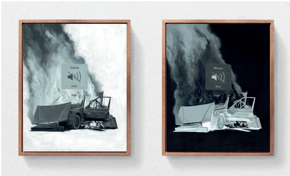
Mute (positiv) / Mute (negativ) 2021 je 24cm x 30cm, Öl auf Hartfaserplatte

Ausstellungsansicht, Regionale 22, ... von möglichen Welten, 2021. Kunsthalle Basel, 2021.