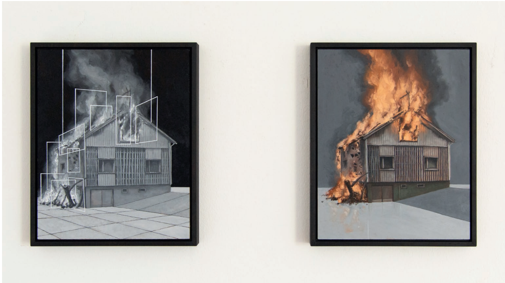
Haus_II / Haus_I 2022 je 24cm x 30cm Öl auf Hartfaserplatte

Ausstellungsansicht, „zwischen drei...“ Schlösschen Vorderbleichenberg, Biberist, 2022