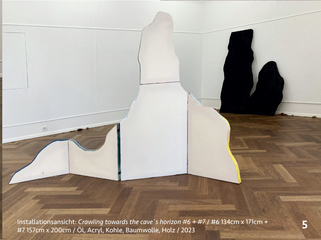
Installationsansicht: Crawling towards the cave's horizon #6 + #7 / #6 134cm x 171cm + #7 157cm x 200cm / Öl, Acryl, Kohle, Baumwolle, Holz / 2023