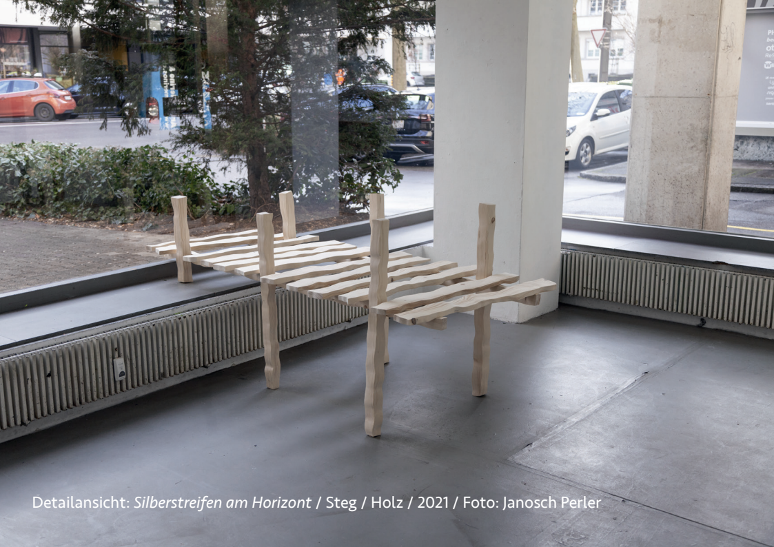
Detailansicht: Silberstreifen am Horizont / Steg / Holz / 2021