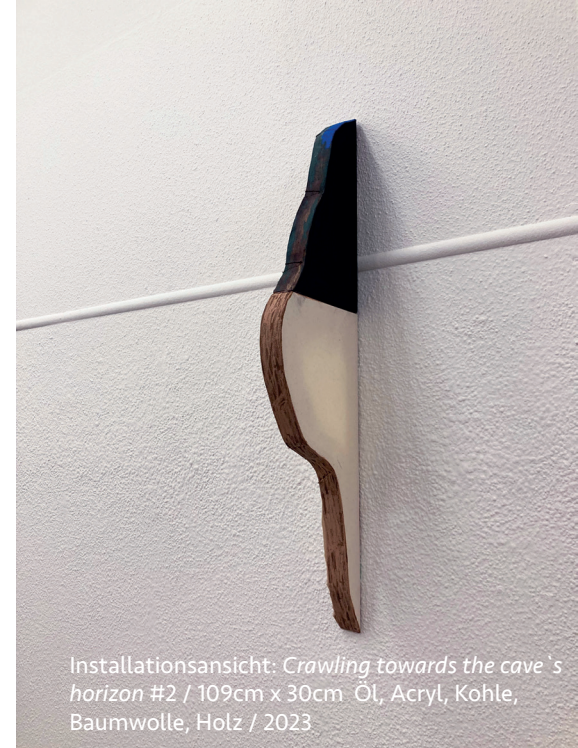
Installationsansicht: Crawling towards the cave's horizon #2 / 109cm x 30cm / Öl, Acryl, Kohle, Baumwolle, Holz / 2023