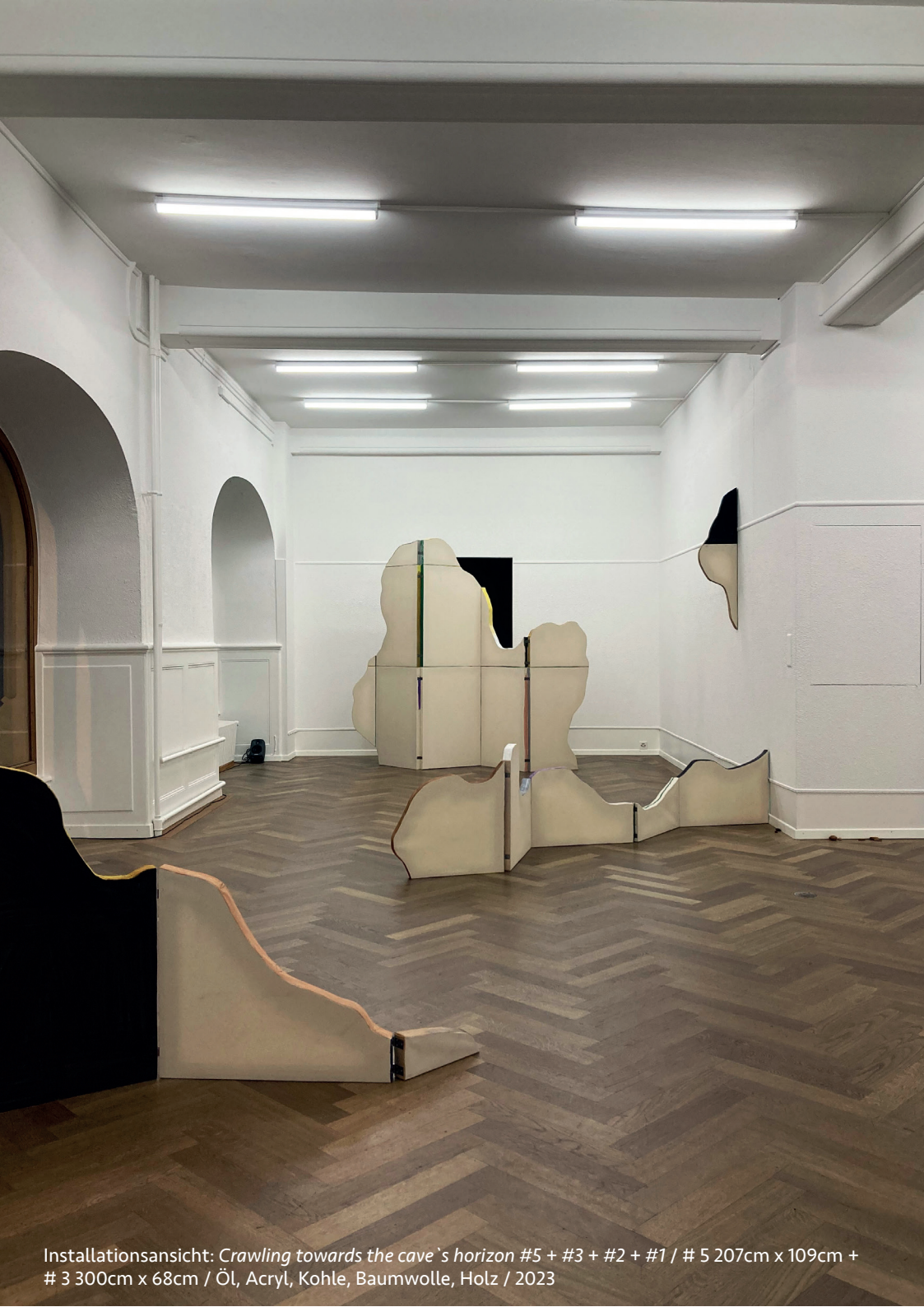
Installationsansicht: Crawling towards the cave's horizon #5 + #3 + #2 + #1 / # 5 207cm x 109cm + # 3 300cm x 68cm / Öl, Acryl, Kohle, Baumwolle, Holz / 2023