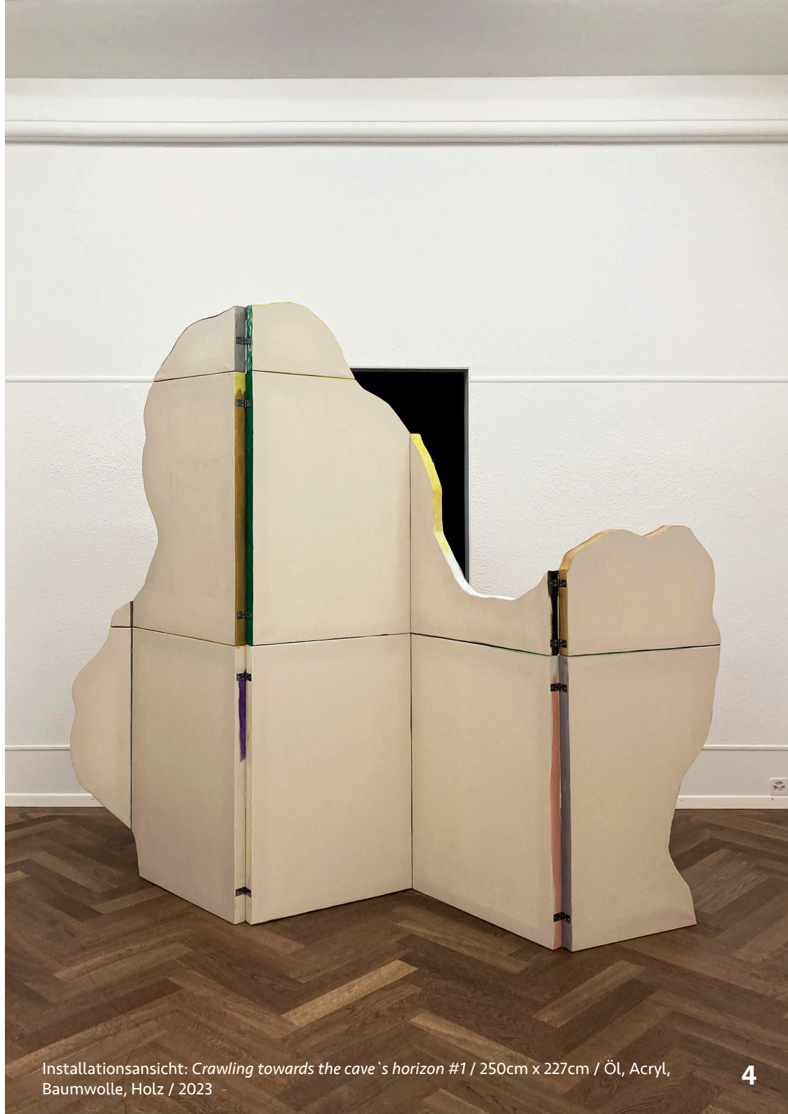
Installationsansicht: Crawling towards the cave's horizon #1 / 250cm x 227cm / Öl, Acryl, Baumwolle, Holz / 2023