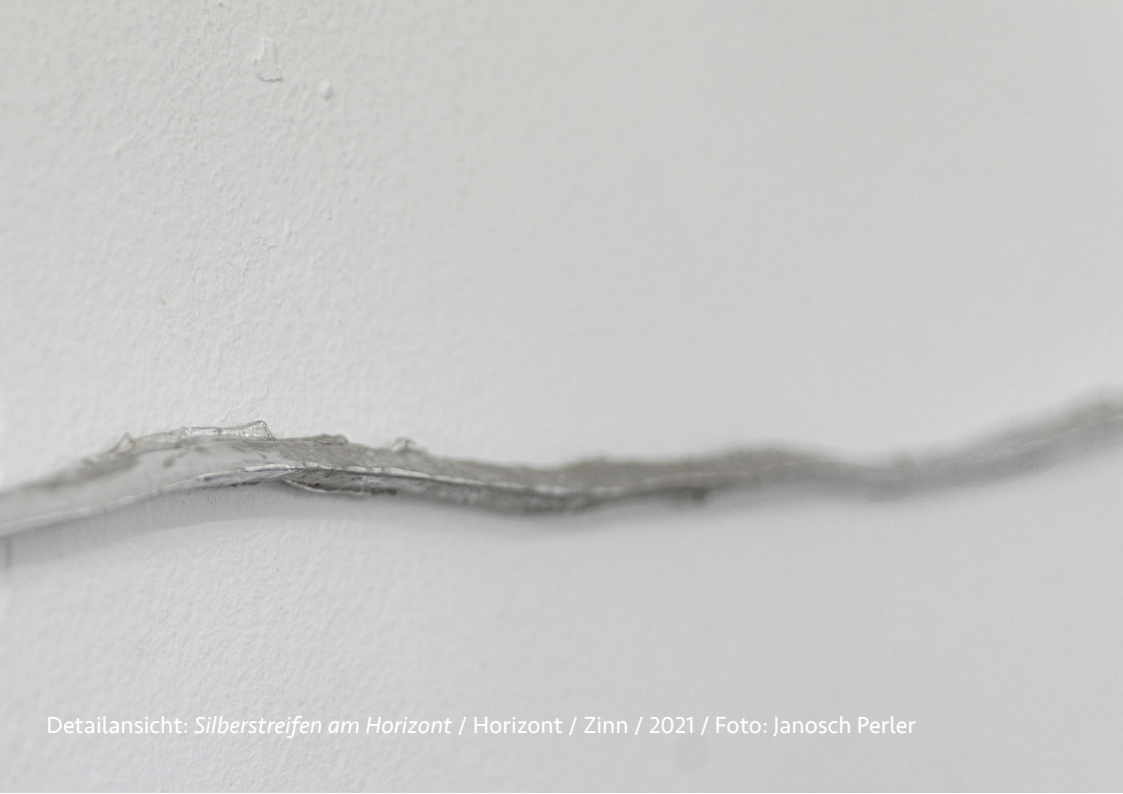
Detailansicht: Silberstreifen am Horizont / Horizont / Zinn / 2021