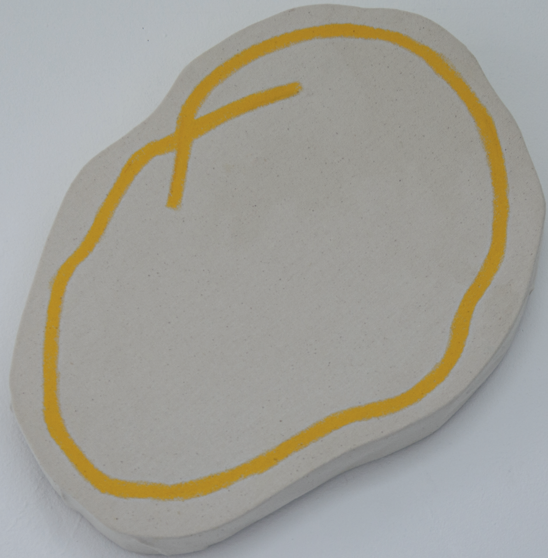
Detailansicht: Silberstreifen am Horizont / Sonne / Ölkreide auf Leinwand / 2021