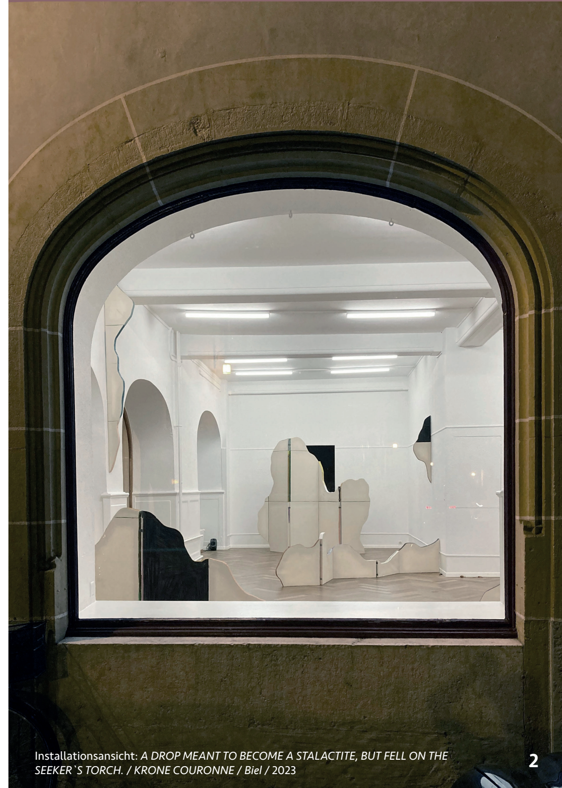
Installationsansicht: A DROP MEANT TO BECOME A STALACTITE, BUT FELL ON THE SEEKER`S TORCH. / KRONE COURONNE / Biel / 2023

Die Ausstellung A DROP MEANT TO BECOME A STALACTITE, BUT FELL ON THE SEEKER`S TORCH. geht vom Ausstellungsraum als einer Höhle aus: die Höhle als ein Ort des Ursprungs, der Stille, der Geborgenheit aber auch der Neugierde, des scheinbar Ewigen oder des Feinen. Die drei Werkgruppen „Crawling towards the cave`s horizon“, „Stones“ und „Spring of boredom“ bilden zusammen durch ihren Bühnenbildartigen Charakter eine Szenerie, welche die Besucher*in zur suchenden Protagonist*in werden lässt. Die formale Reduziertheit der Installation lässt den Blick zwischen dem zeichnerischen Ganzen und dem kleinteiligen Feinen oszillieren.