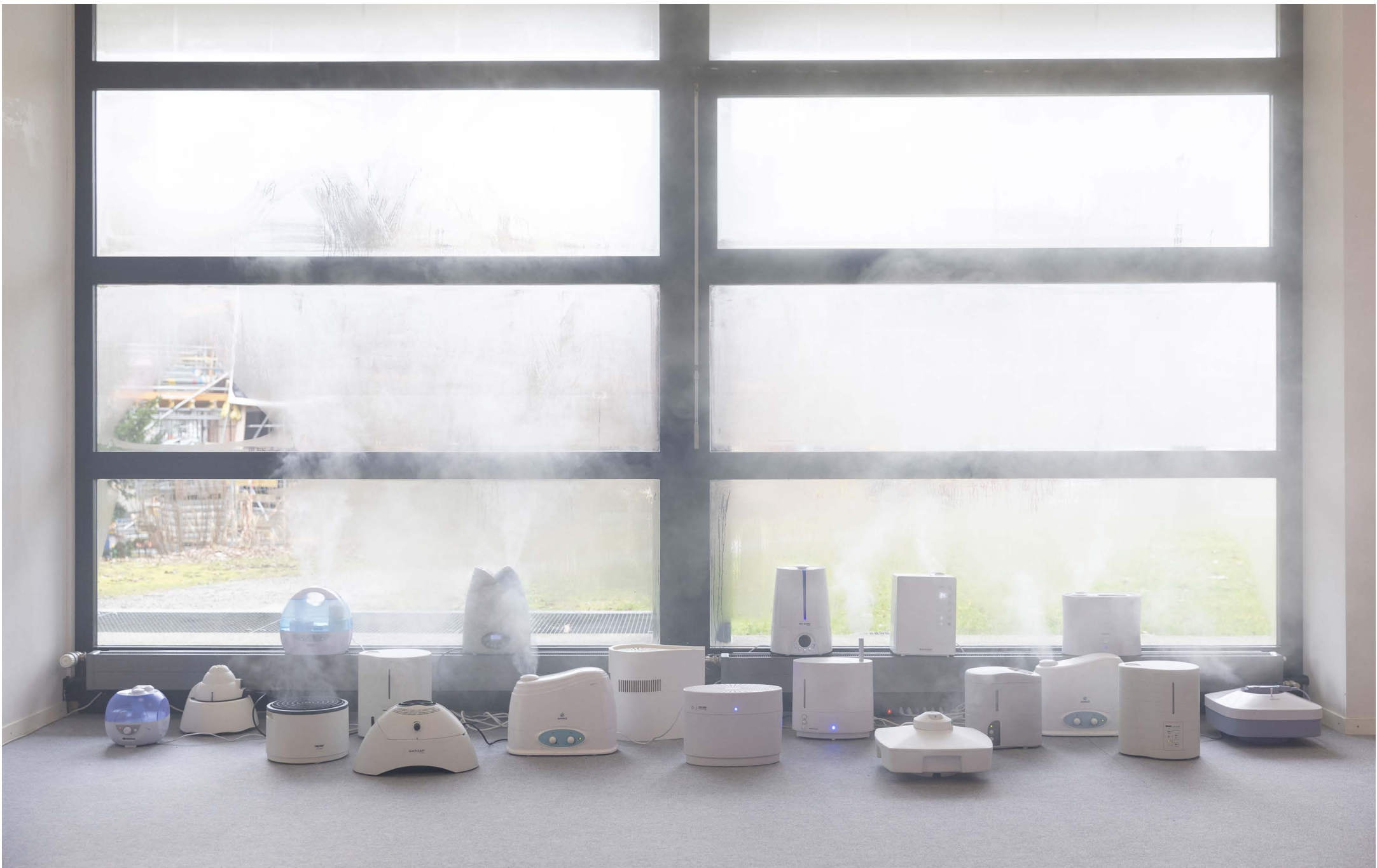
Pure Life, 2020 Diverse Luftbefeuchter, Wasser je ca. 30 × 30 × 40 cm