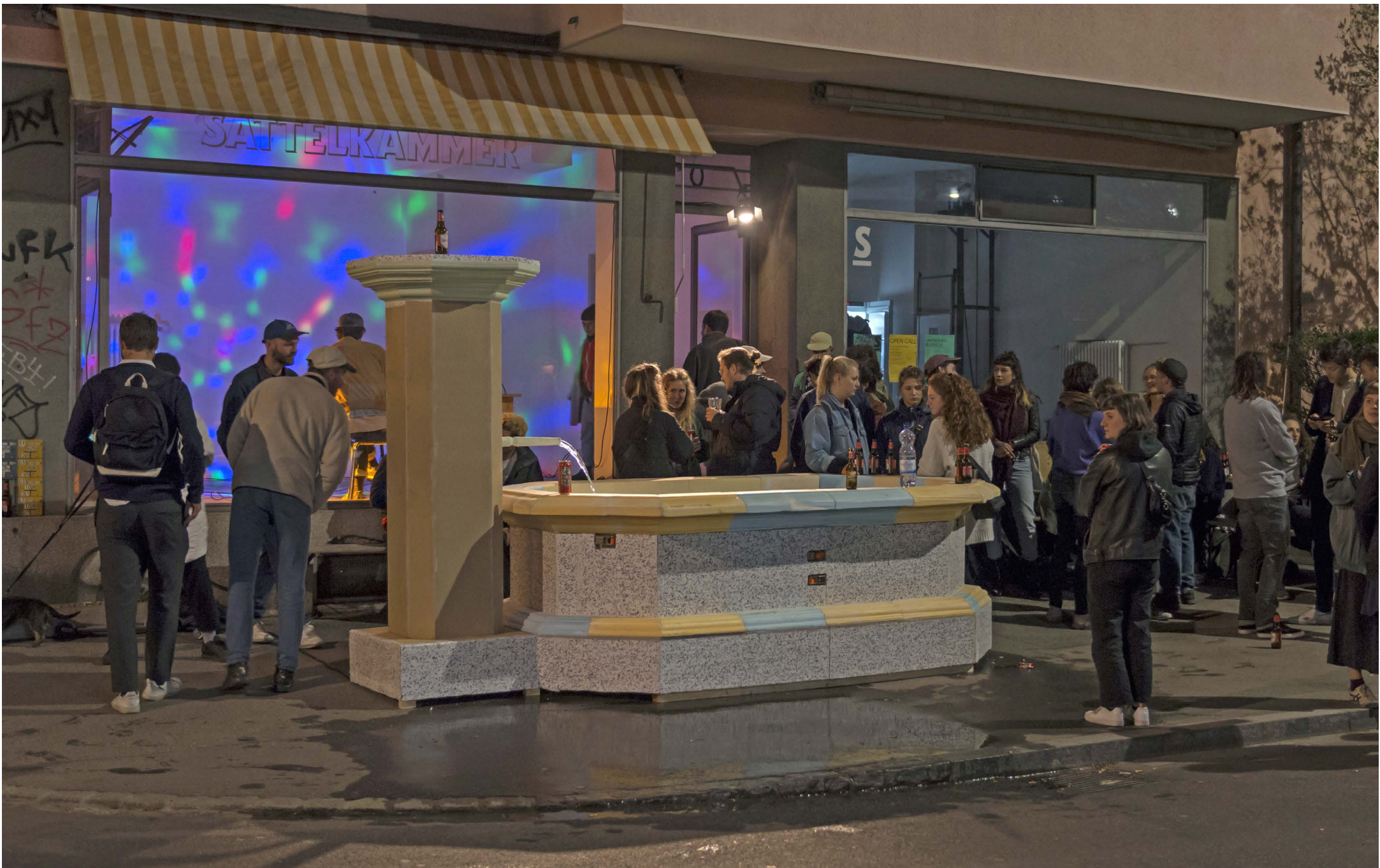
Open Call - How to build a fountain, 2019, Sattelkammer, Bern