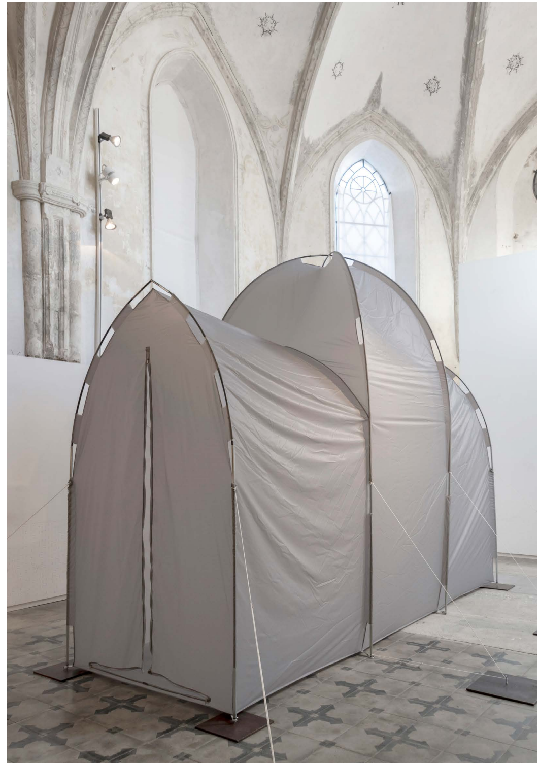
Zelt, 2020 Ripstop-Gewebe, Aluminium, Fiberglas, Polyester ca. 320 x 150 x 450 cm