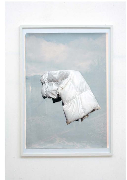
Ganz Leicht I-III , 2018 Tintenstrahldruck, Siebdruck je 100 × 70 cm