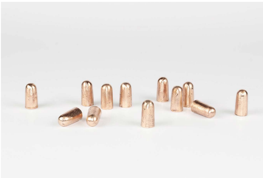
Ohrstöpsel, 2020 Bronzeguss je ca. 2 x 1.2 x 1.2 cm