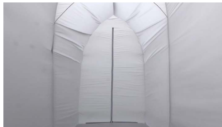
Innerhalb, 2020 Mp4, 16:9, 04', Farbe, Ton