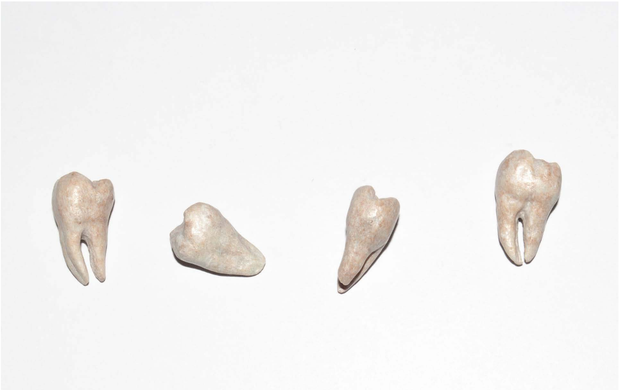
Zähne, 2019 Speckstein je ca. 0.8 × 2 × 1 cm