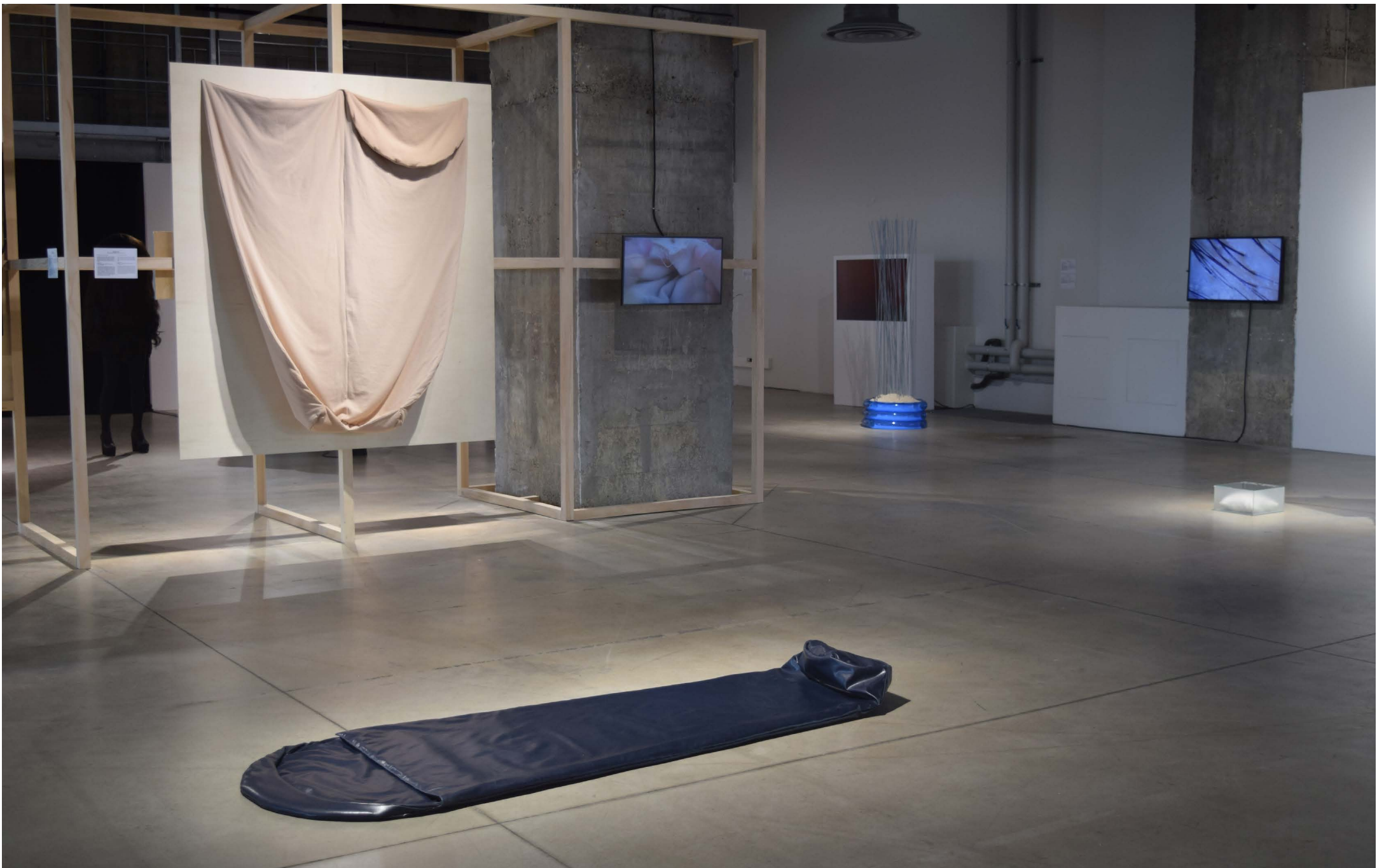
Schlafsack I-II , 2018 Jersey und Kunstleder je ca. 180 × 160 × 20 cm