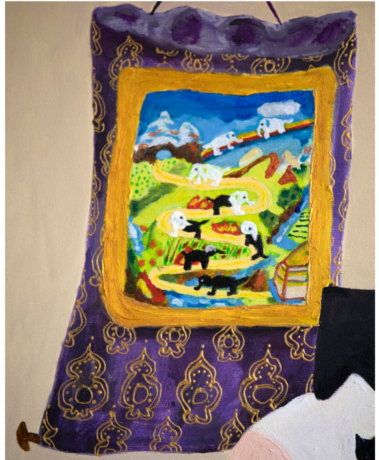
The Golden Path, detail 2022 Mischtechnik auf Leinwand, 80X100cm