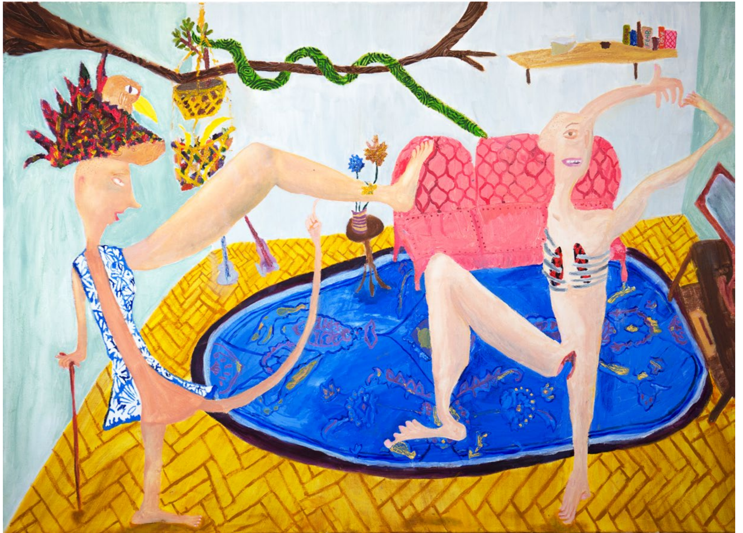
Mating Dance (To hell with responsibilities) 2019 Mischtechnik auf Leinwand, 110x80cm