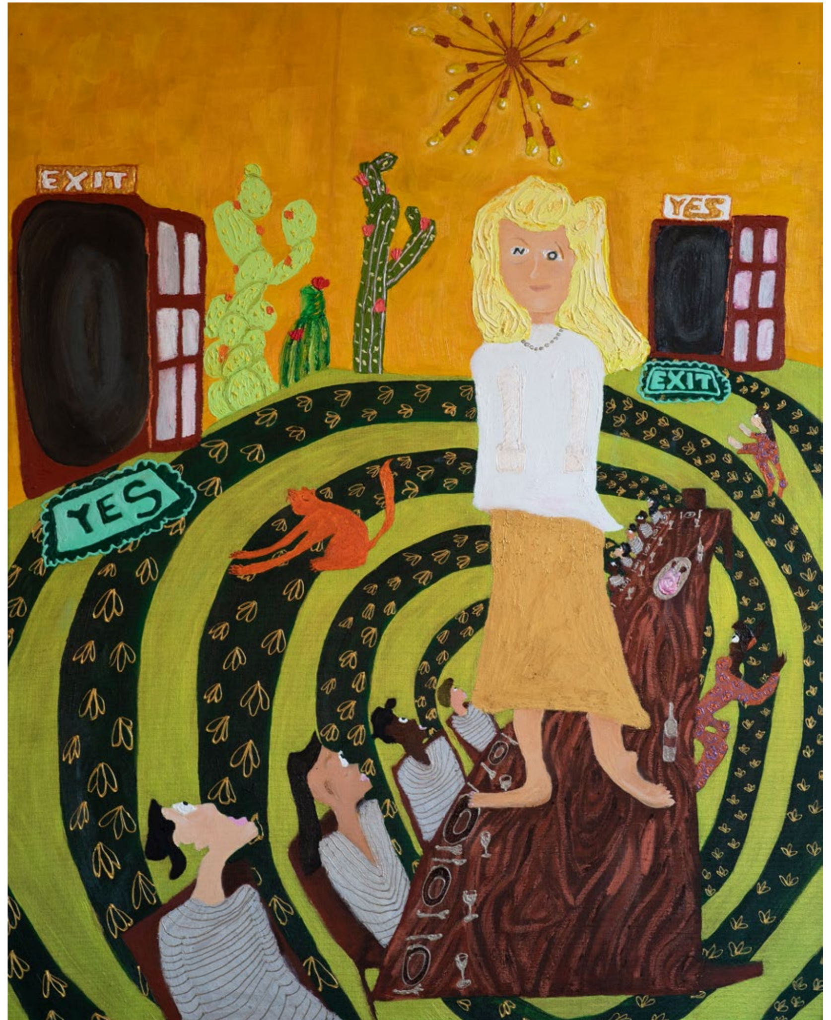
Wrong choice 2021 Mischtechnik auf Leinwand, 80x100cm