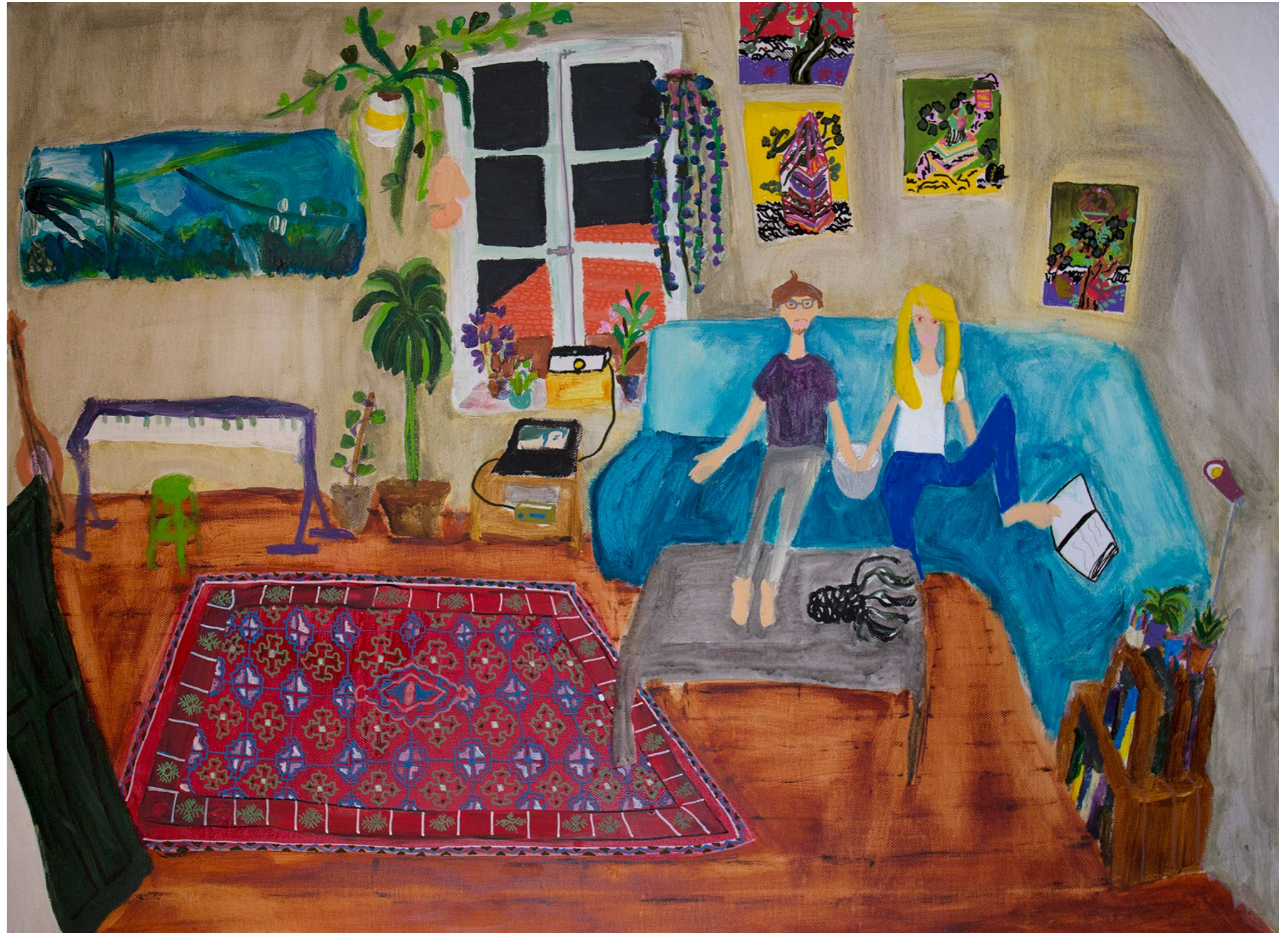
Comfort Zone 2019 Mischtechnik auf Leinwand, 80x60cm