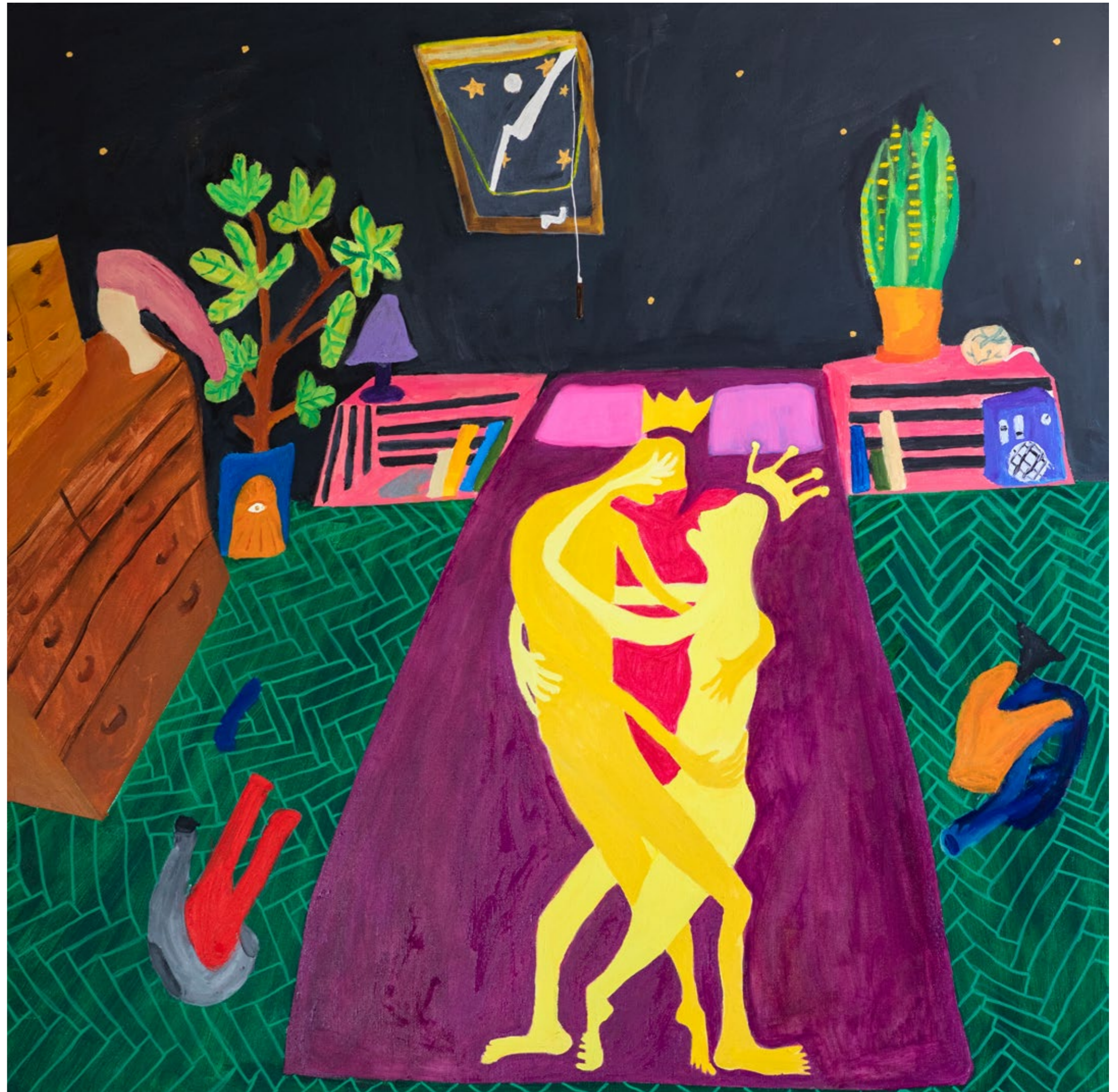
Fucking Royalty 2021 Mischtechnik auf Leinwand, 90x90cm