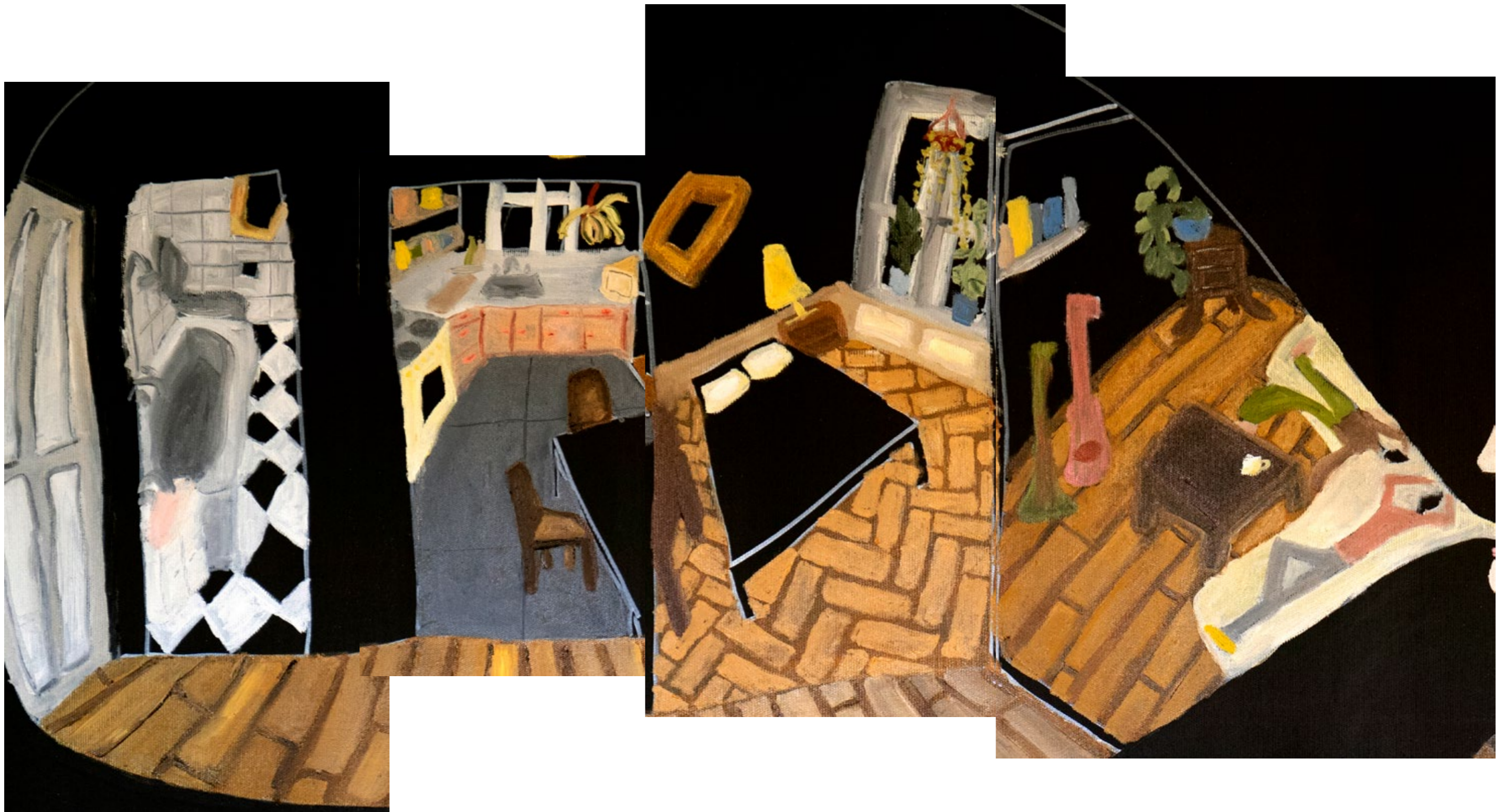
A Modern Cave detail 2022 Acrylic und öl auf Leinwand, 120X90cm