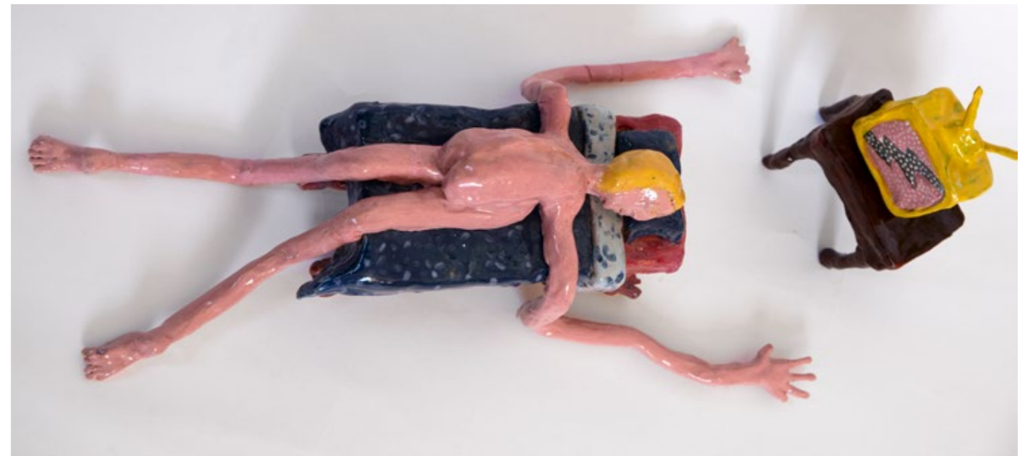
Waiting for the End of Time 2021

Ton und Keramoplast, 50x20x14cm Länge x Breite x Höhe