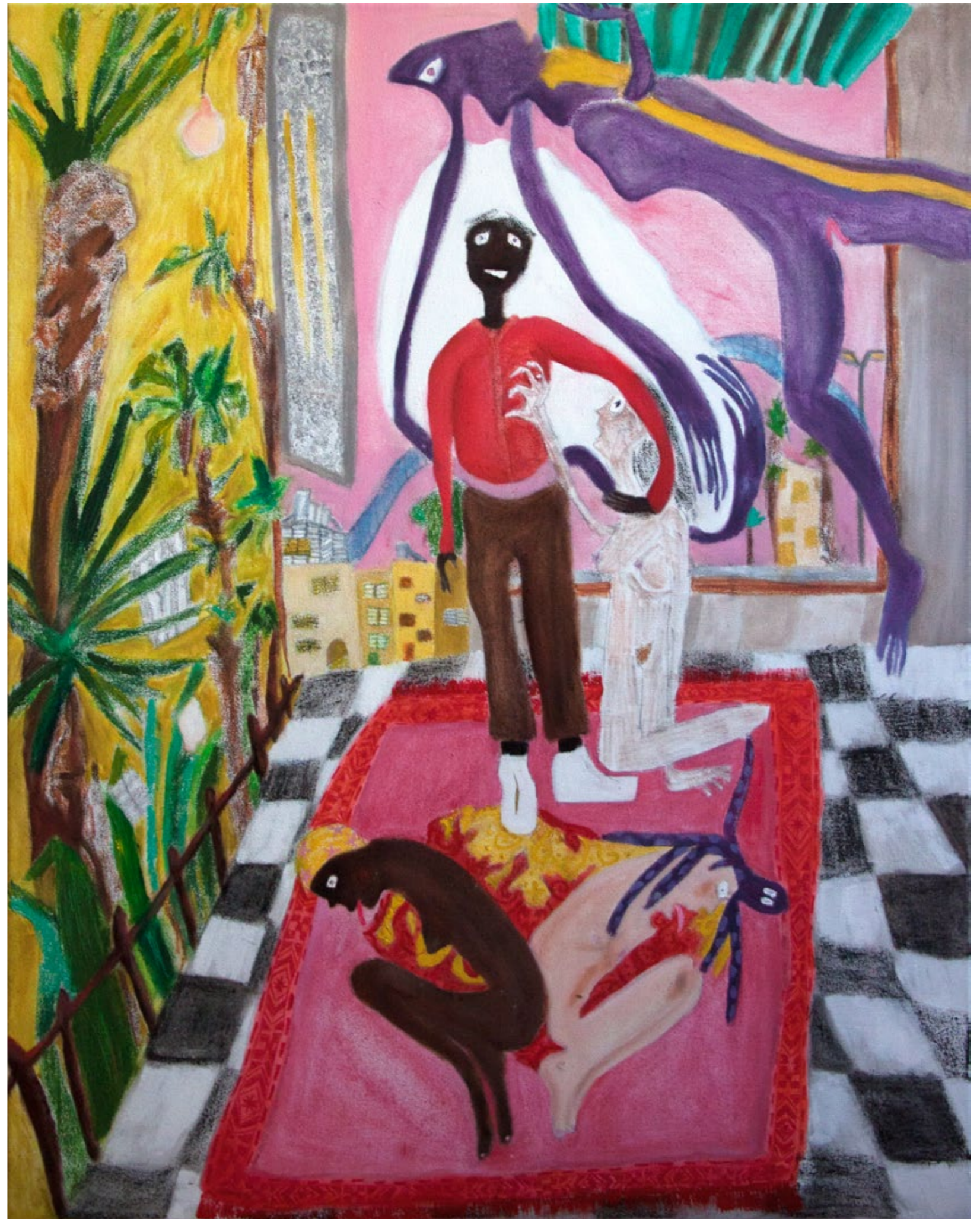
Home Sick 2017 Mischtechnik auf Leinwand, 80x99cm