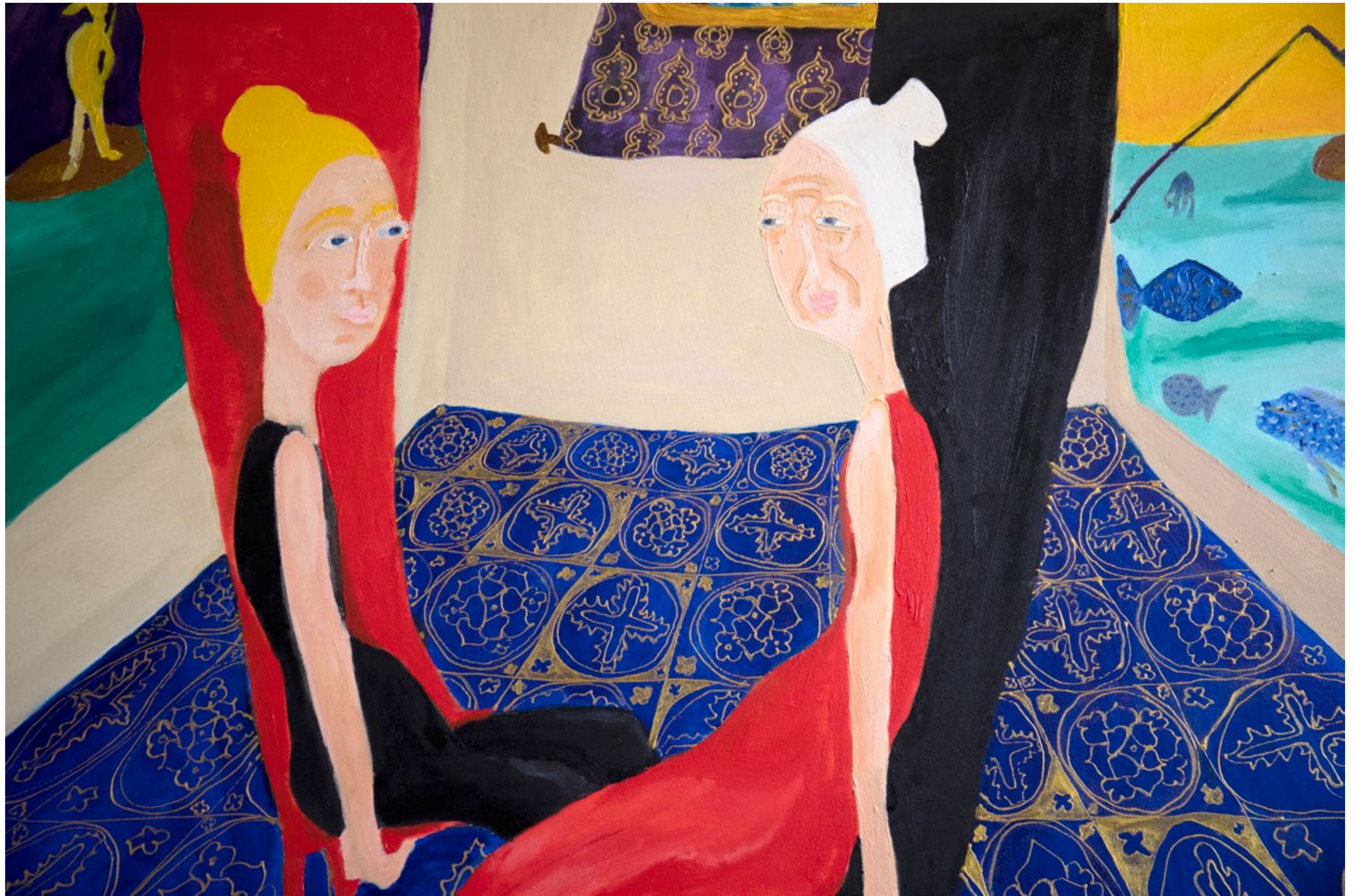
The Golden Path, detail 2022 Mischtechnik auf Leinwand, 80X100cm