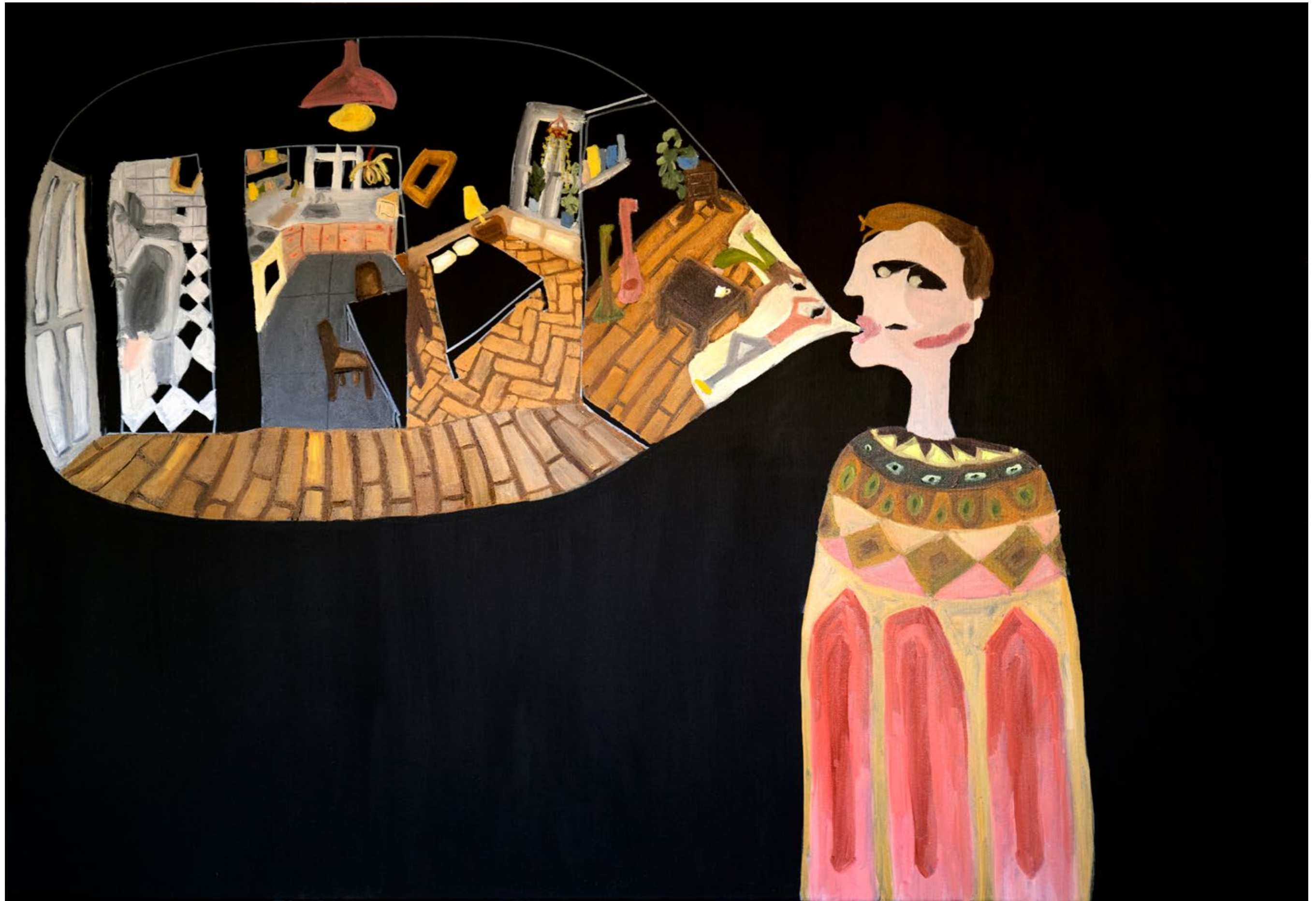
A Modern Cave 2022 Acrylic und öl auf Leinwand, 120X90cm