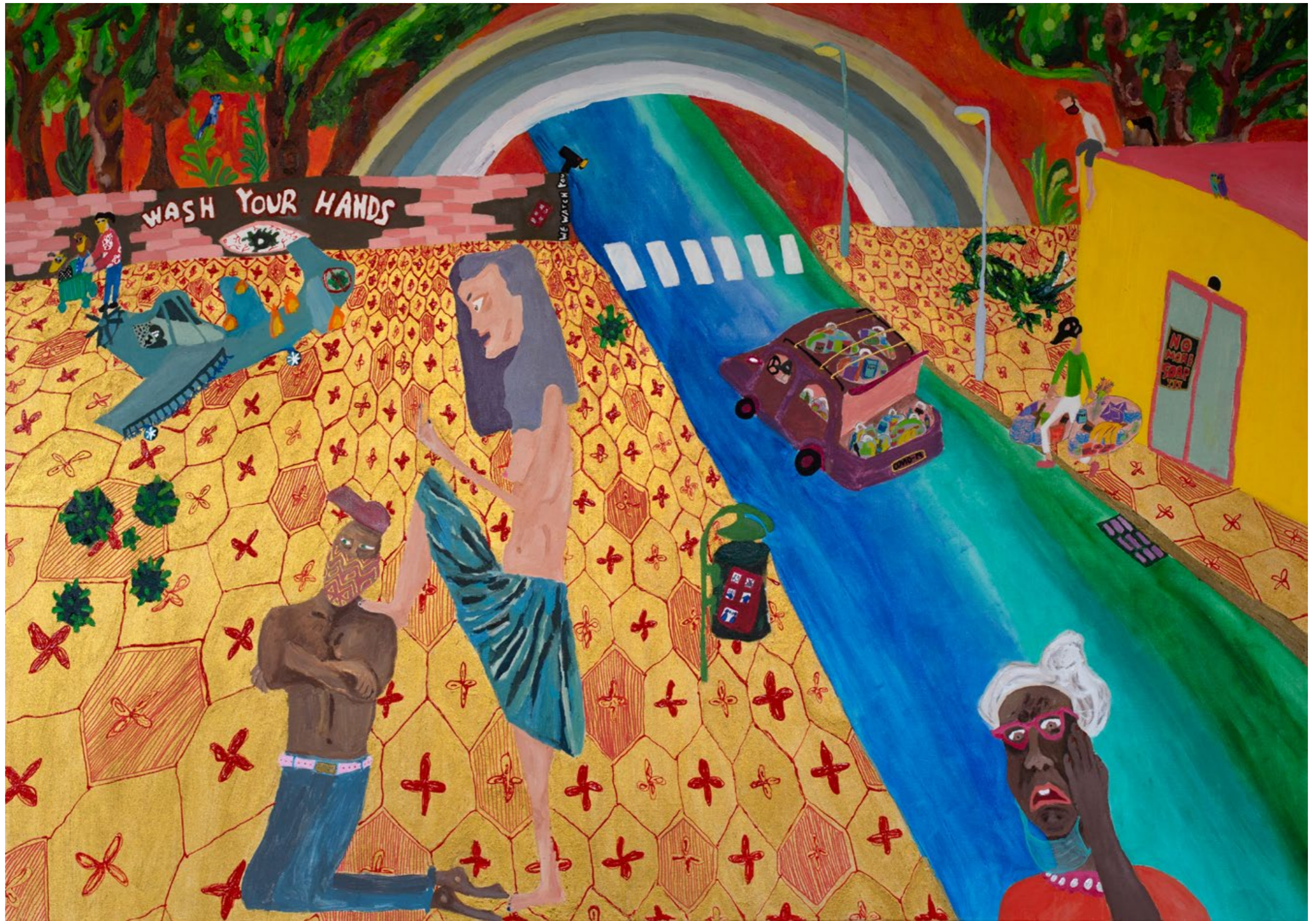
Pan(dem)ic 2020 Mischtechnik auf Leinwand, 150X105cm