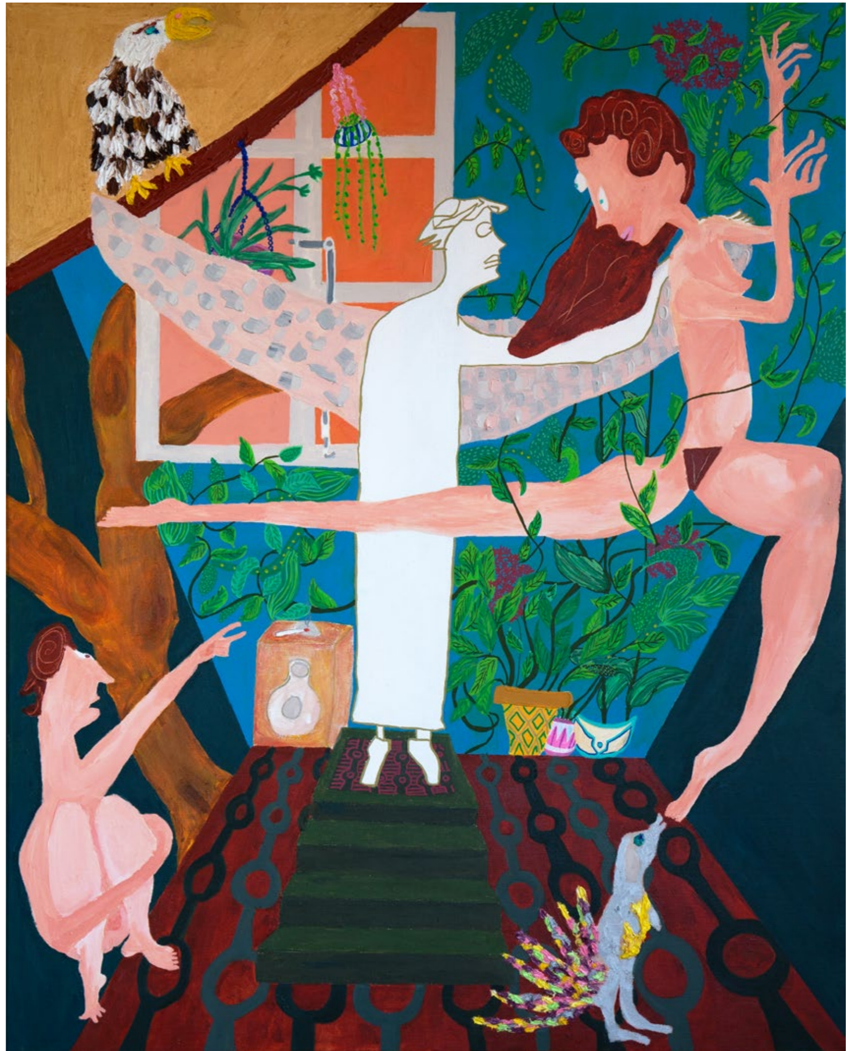
Splitted Selves, (Dancing in Paradise without knowing who I am and who are the others) 2020 Mischtechnik auf Leinwand, 80x100cm