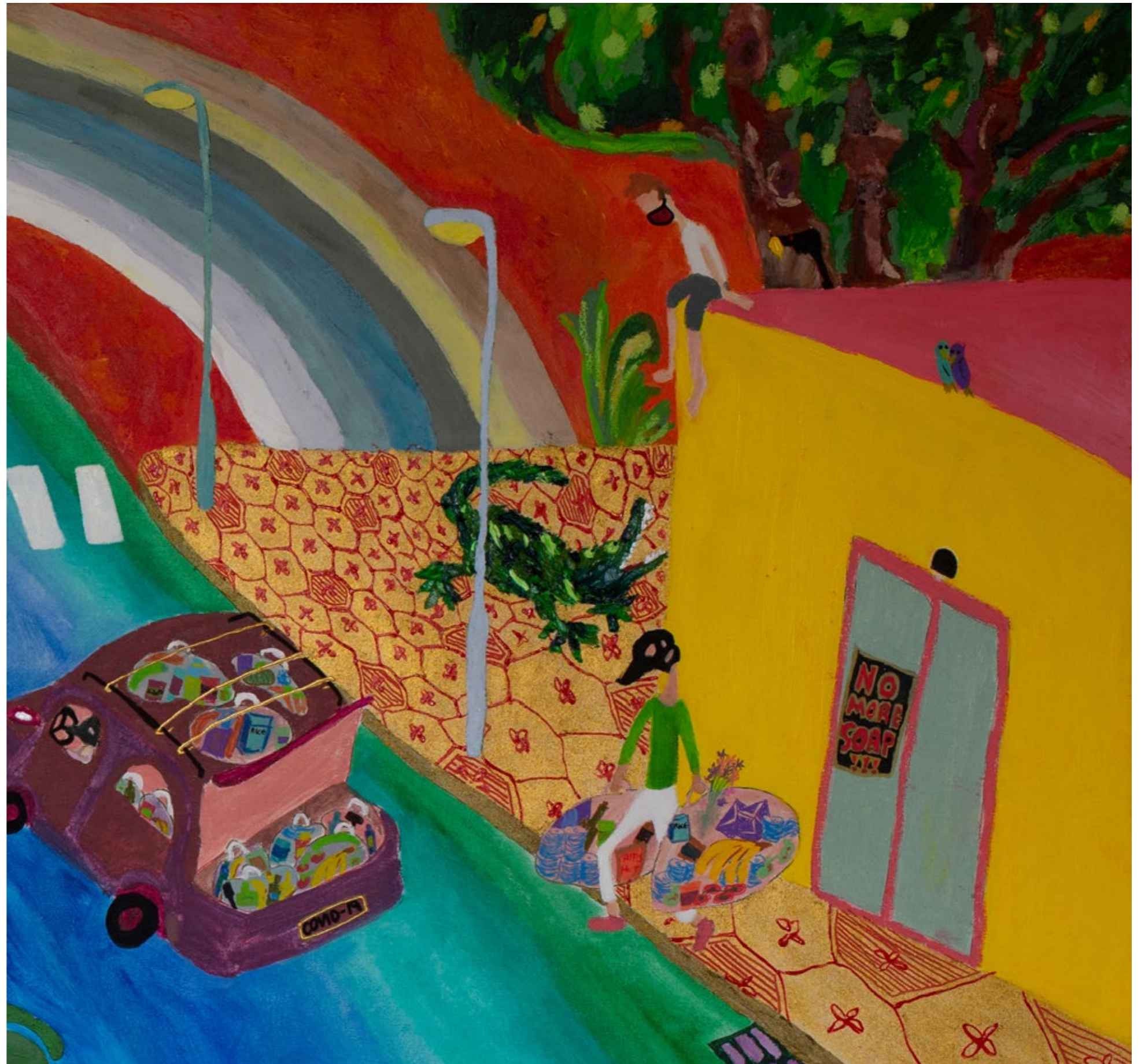
Pan(dem)ic, detail 2020 Mischtechnik auf Leinwand, 150X105cm