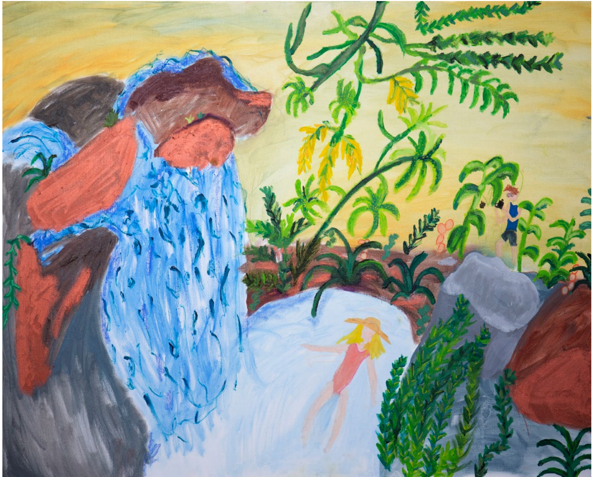
Swimming in Rishikesh's Natural Pools while Ändu is Photographing Insects 2020