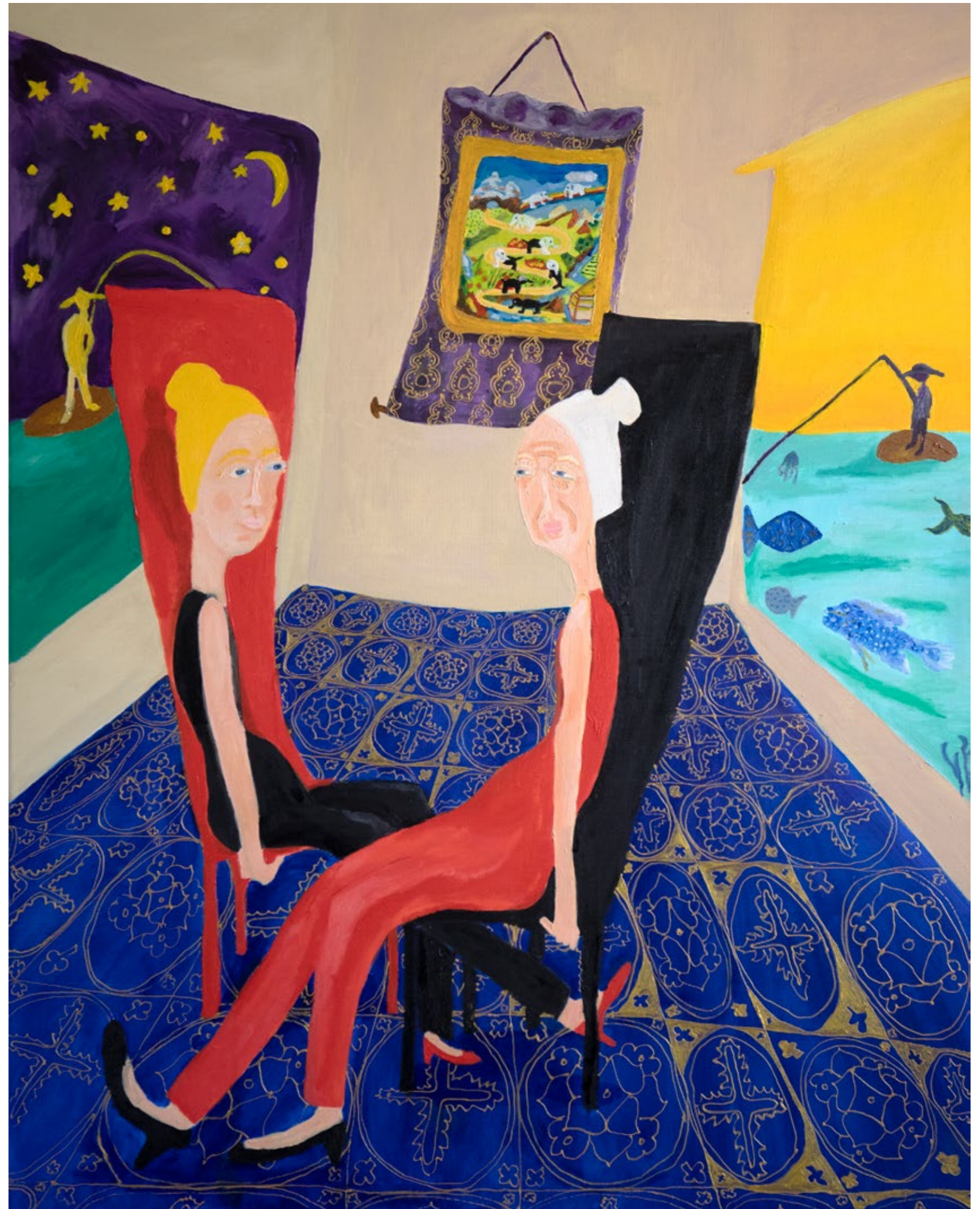
The Golden Path, 2022 Mischtechnik auf Leinwand, 80X100cm