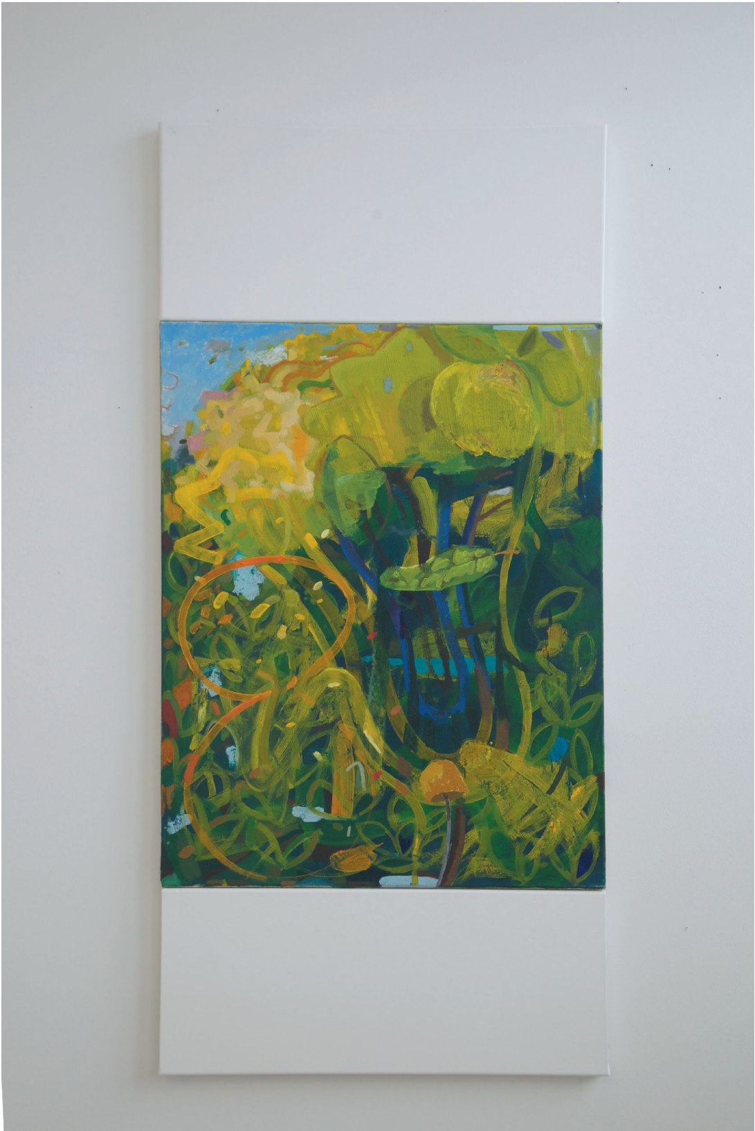
„Wald“ Öl und Dispersion auf Baumwollgewebe 118 x 55 cm, 2020