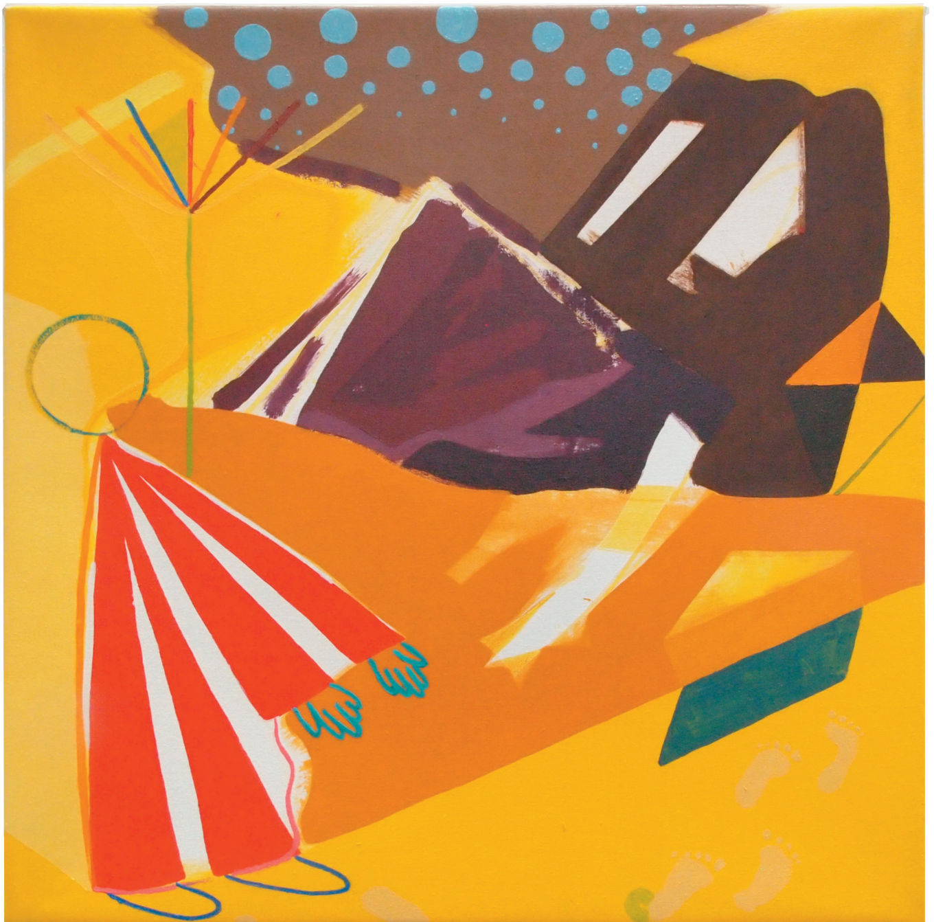
„ohne Titel“ , Öl auf Gewebe 62 x 62 cm , 2016