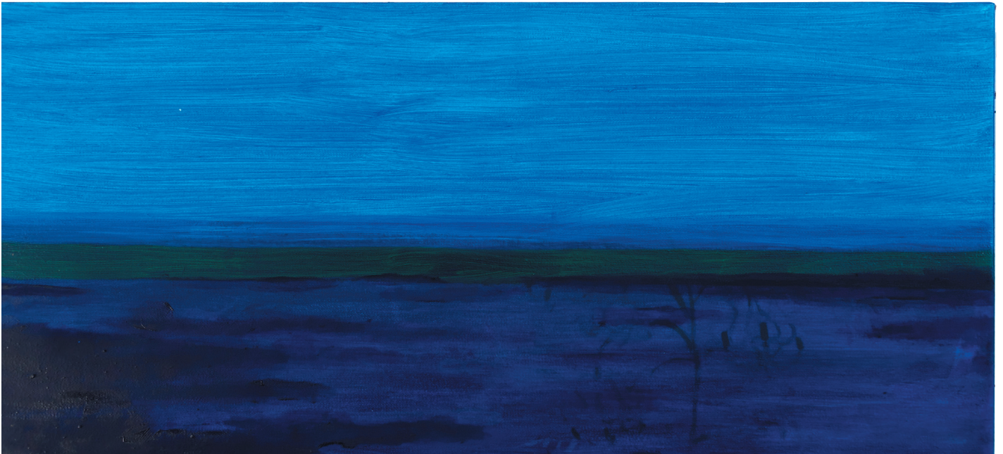
„Jurasüdfuss“, Öl auf Baumwollgewebe, 27 x 55 cm, 2022