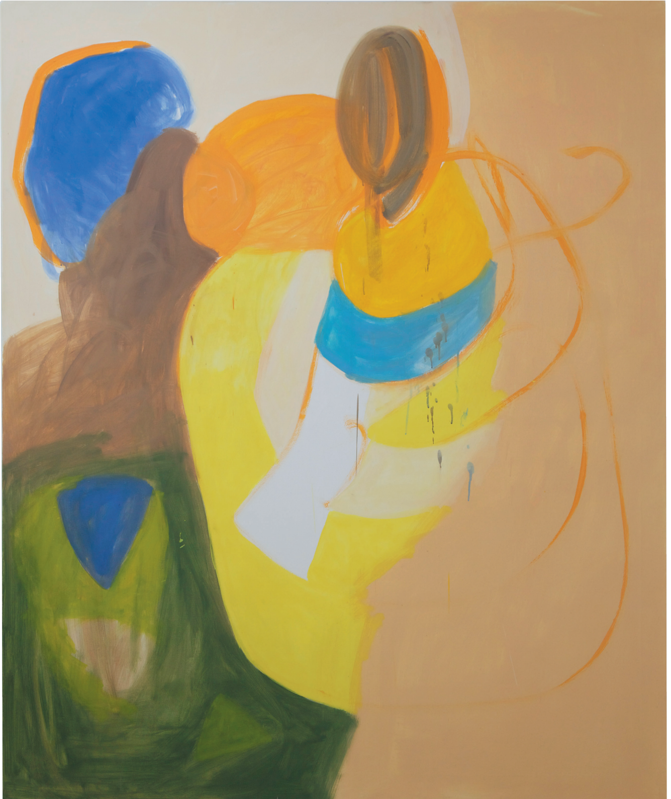
„ohne Titel“ Öl auf Gewebe 180 x 150 cm, 2020