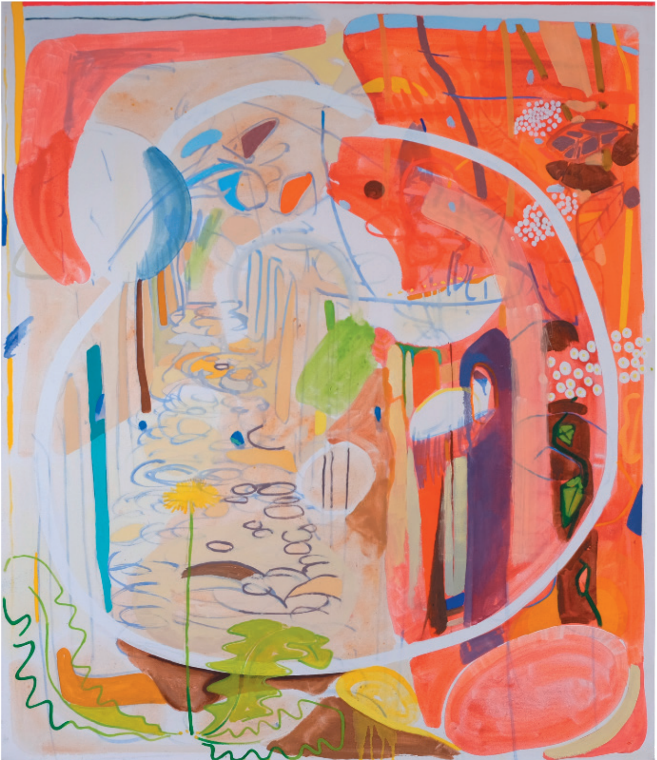
„ohne Titel“ Öl auf Baumwollgewebe 130 x 110 cm, 2018