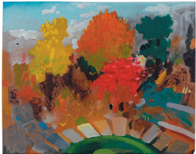
„Herbst und Bäume“ Acryl auf Pavatex 29,5 x 37,5 cm, 2019