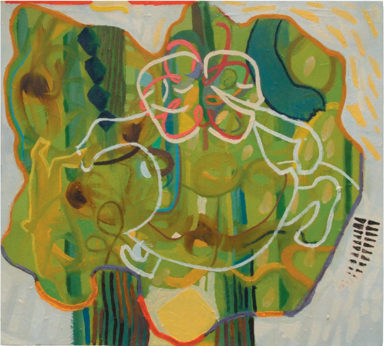
„ Janus “ Öl auf Gewebe 46 x 50 cm , 2016