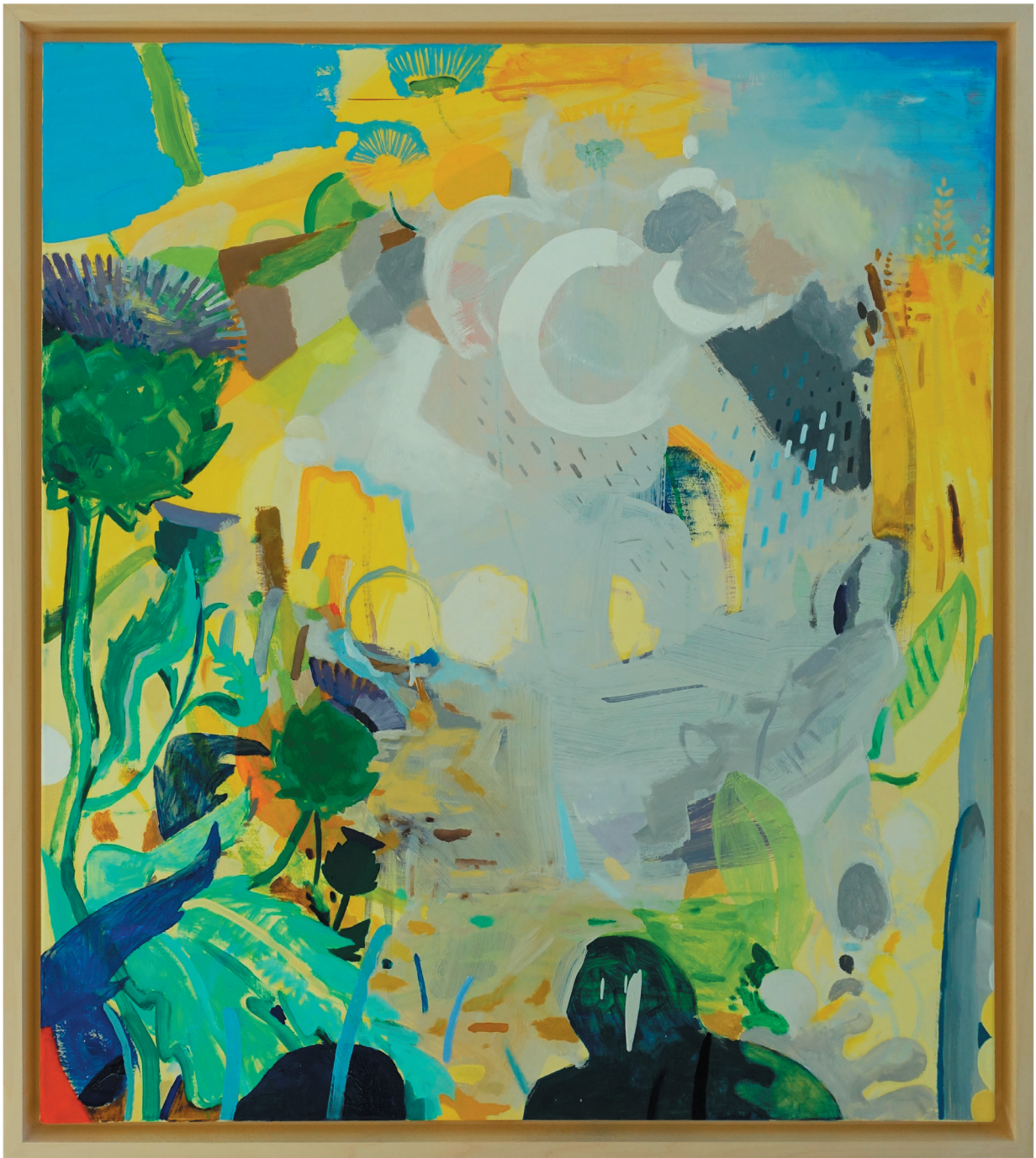
„ohne Titel“ Öl auf Baumwollgewebe mit Lindenholzrahmen 91 x 81 cm, 2022