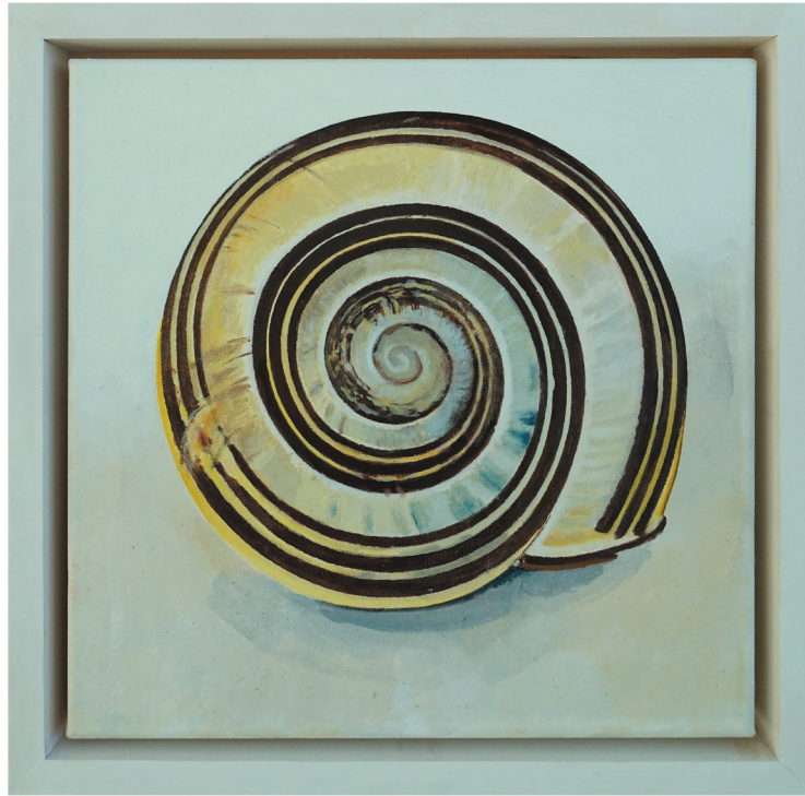
„in the shell“ Öl auf Baumwollgewebe mit Lindenholzrahmen 31,5 x 31,5 cm, 2021