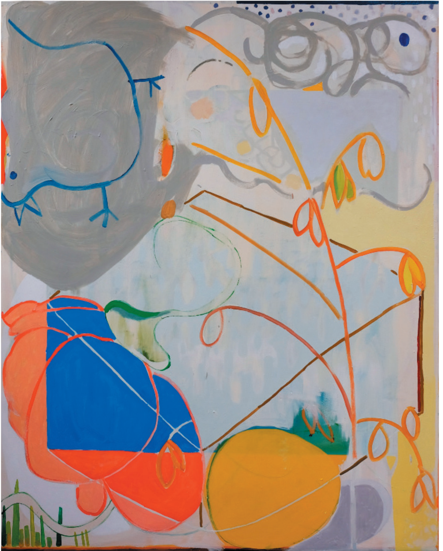
„ohne Titel“ Öl auf Baumwollgewebe 180 x 140 cm, 2018