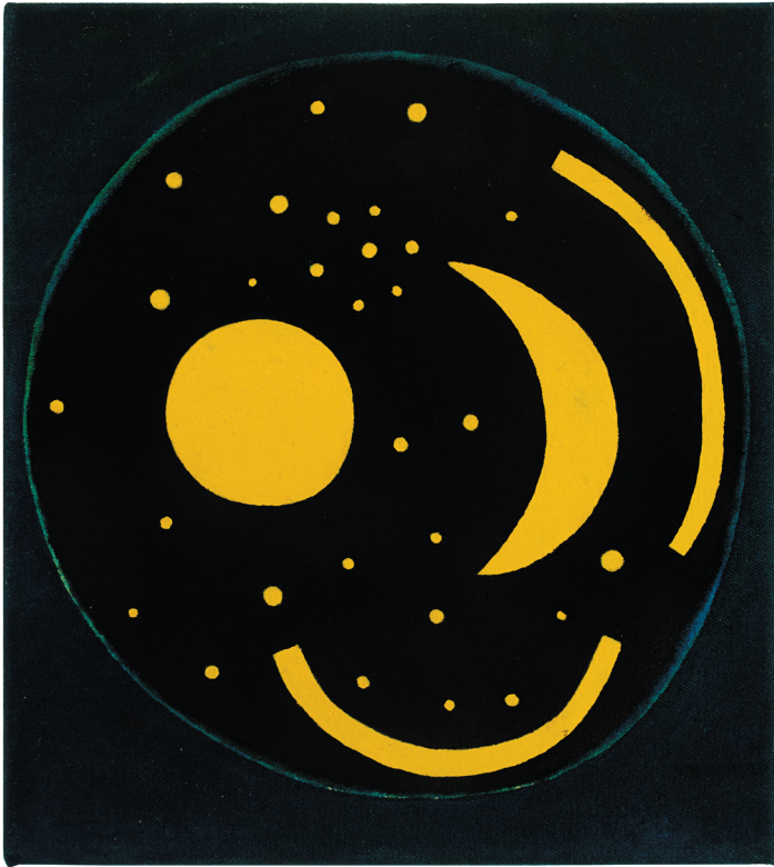
„Sternenscheibe“ Öl auf Baumwollgewebe 20 x 22,5 cm, 2022