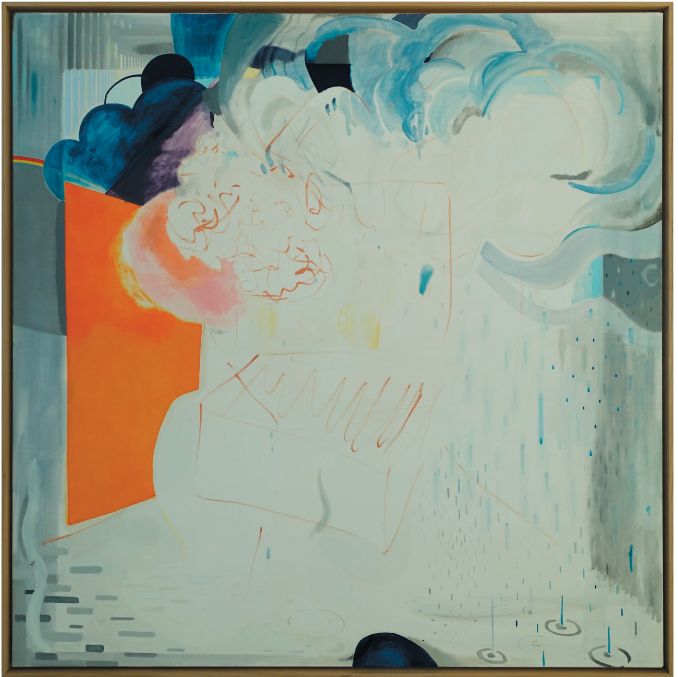
„Wetterraum“ Öl auf Baumwollgewebe mit Eichenholzrahmen 154 x 154 cm, 2021