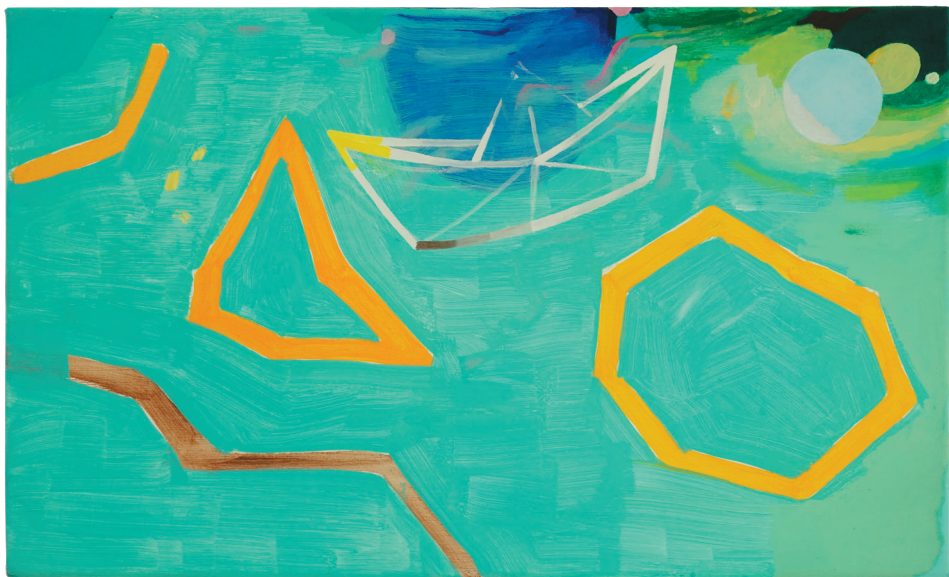
„ohne Titel“ , Öl auf Baumwollgewebe 24 x 40,5 cm, 2022