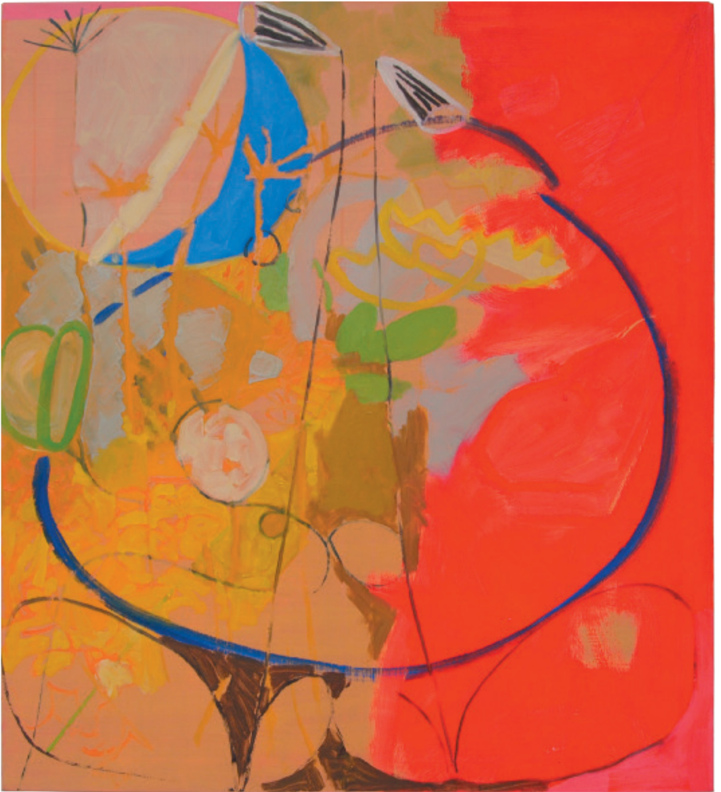
„ohne Titel“ Öl auf Baumwollgewebe 110 x 100 cm, 2019