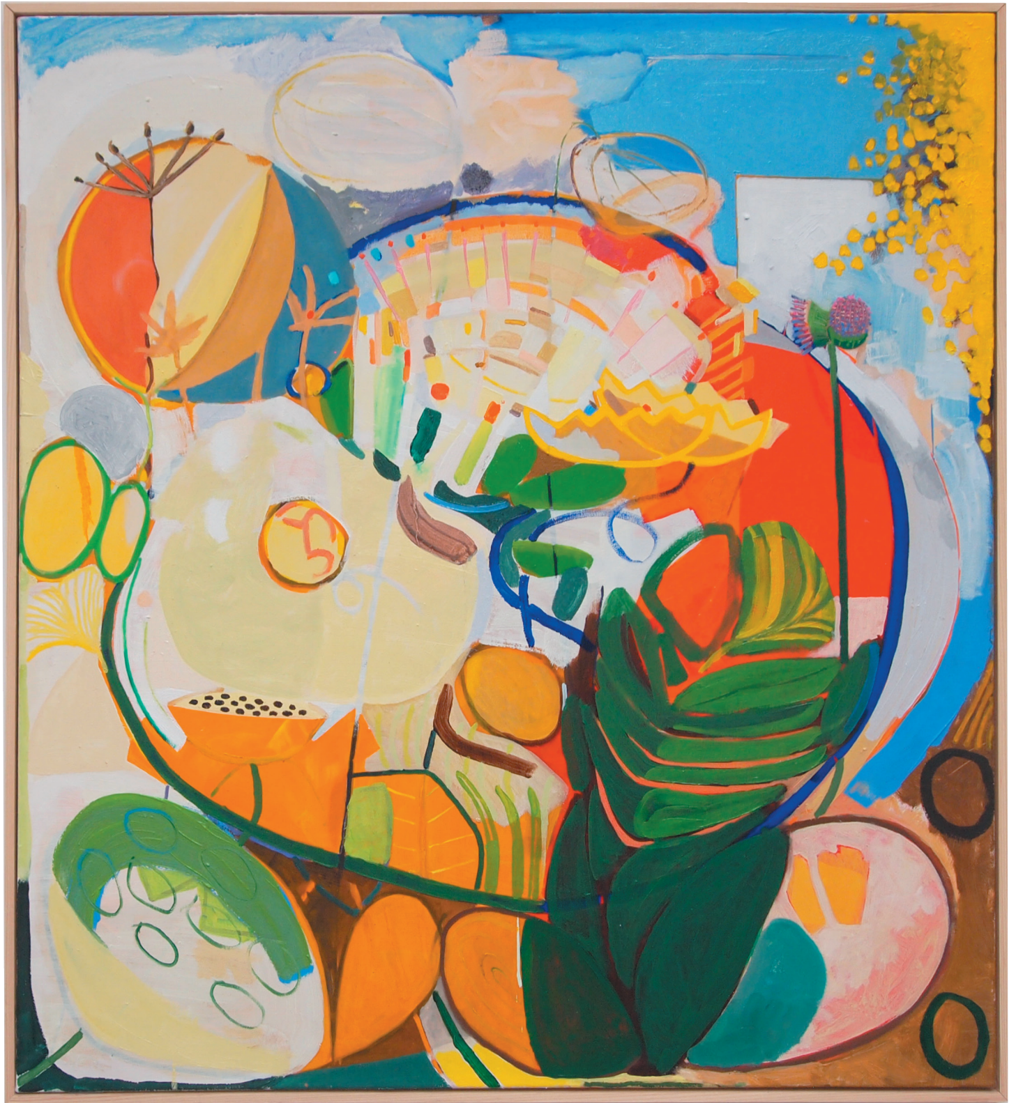
„ohne Titel“ Öl auf Baumwollgewebe“ Rahmen aus Holz 112,5 x 102,5 cm, 2019