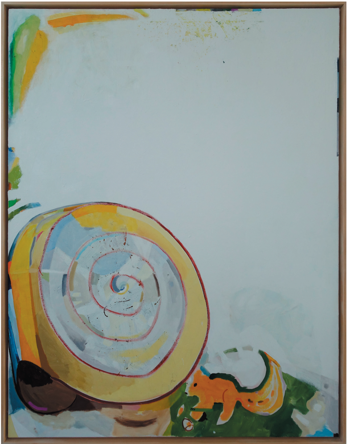
„Königsschneckengehäuse und Eichhörnchen mit Nüssen“ Öl auf Baumwollgewebe mit Holzrahmen 133,5 x 103,5 cm, 2022