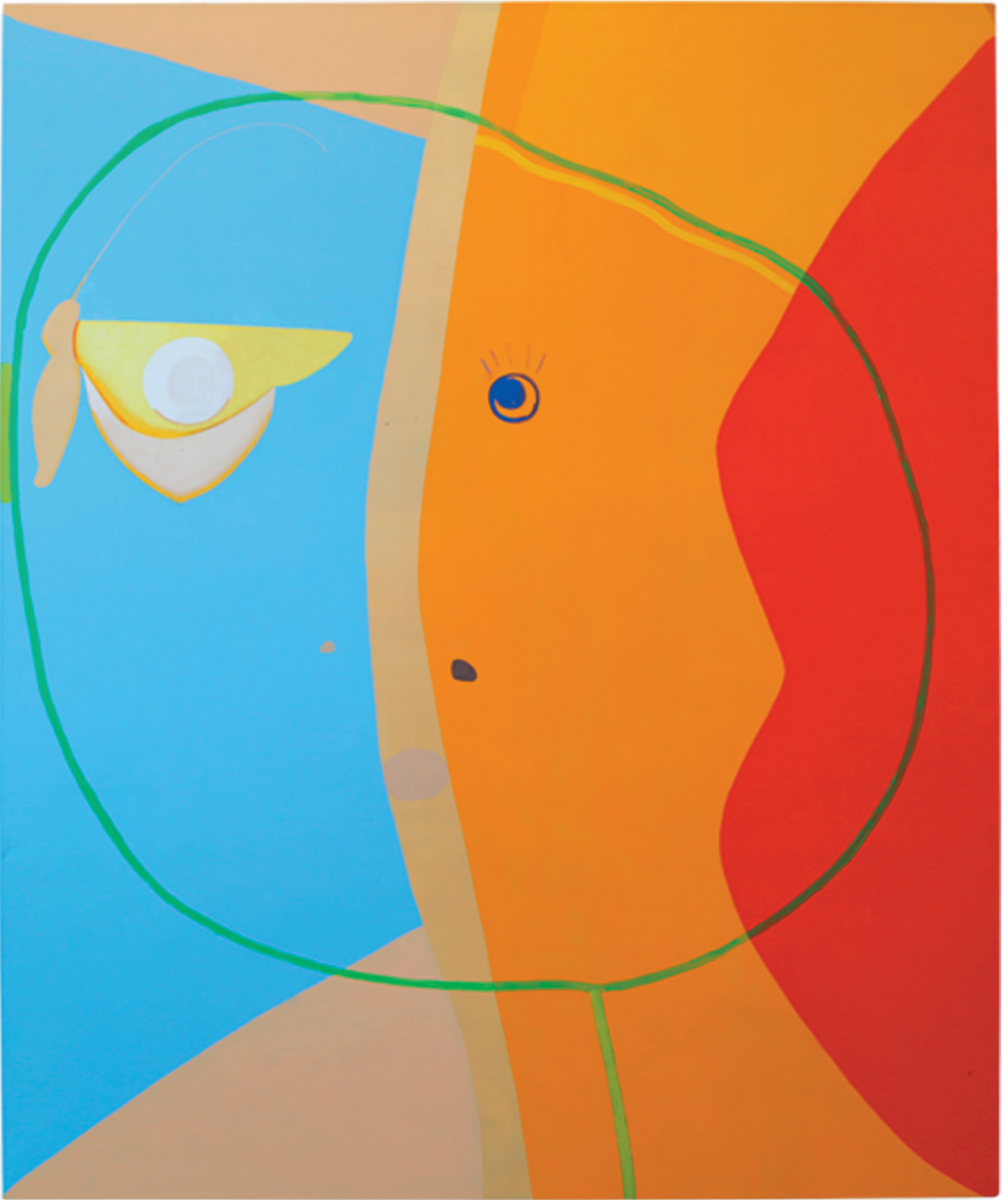
„ Blume und Schmetterling“ Öl auf Baumwollgewebe 180 x 150cm, 2020