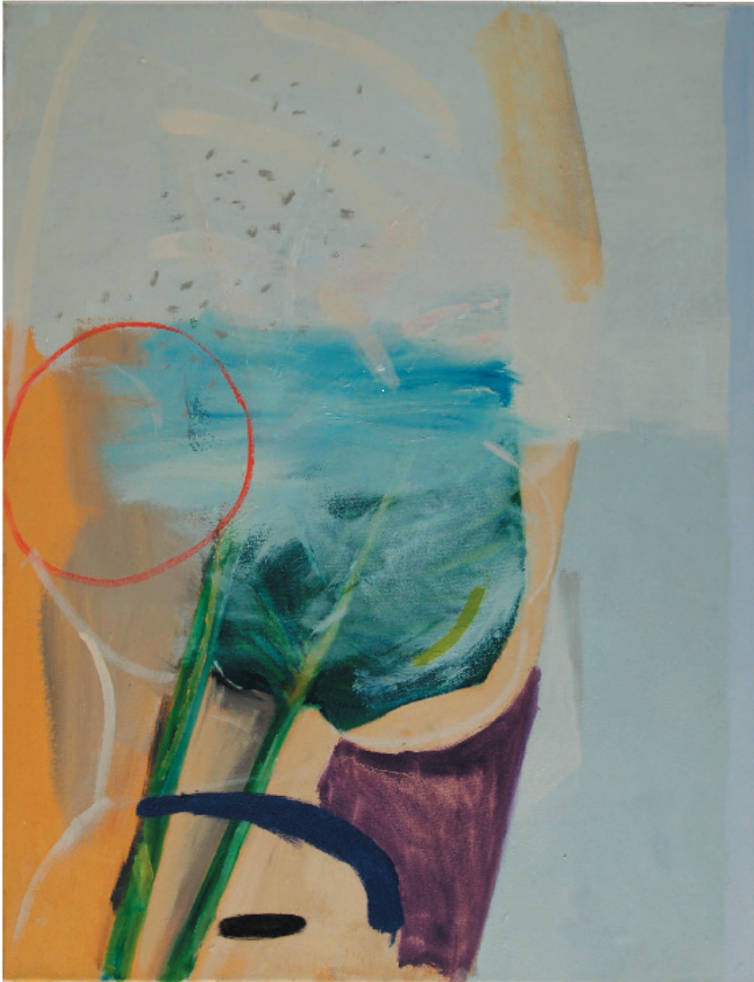
„ohne Titel“ Öl auf Baumwollgewebe 70 x 50 cm , 2015