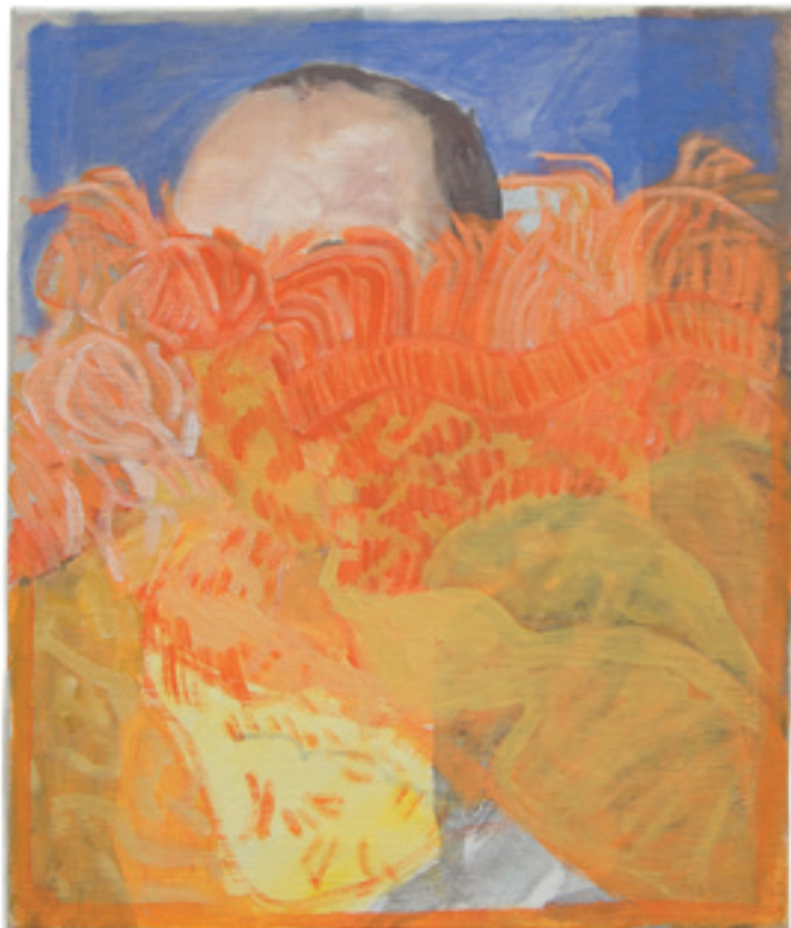
„ Birne oben Birne unten“ Acryl auf Baumwollgewebe 40 x 34 cm , 2014