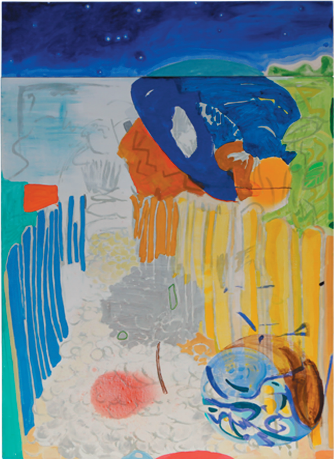
„ohne Titel“ Öl auf Baumwollgewebe 145 x 100 cm, 2019