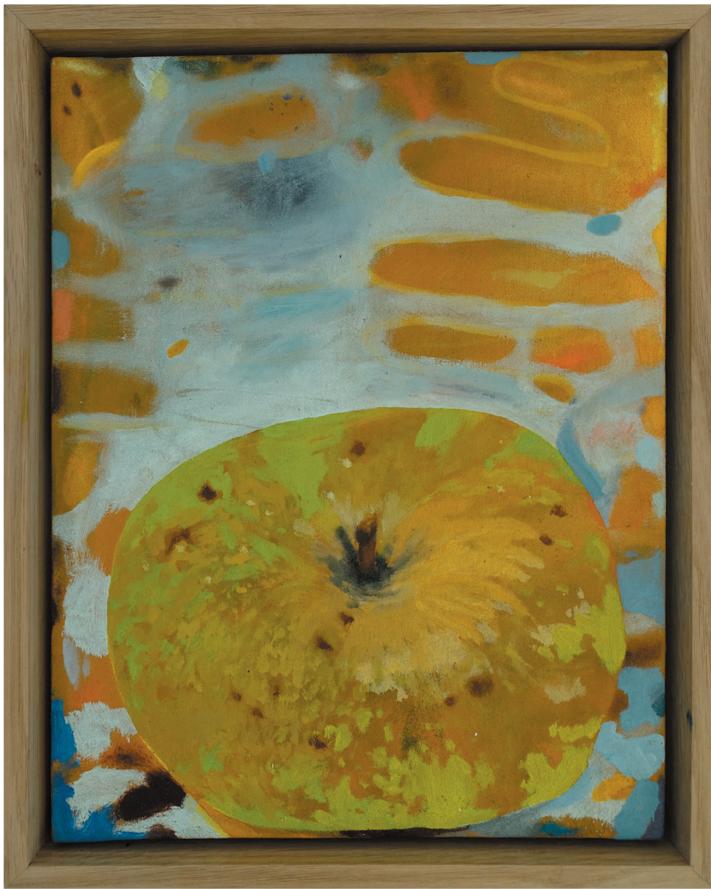
„Schöner von Boskoop“ Öl auf Baumwollgewebe mit Eichenholzrahmen 35,5 x 28 cm, 2021