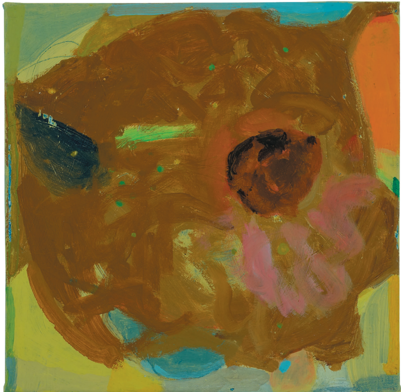
„ohne Titel“ Öl auf Baumwollgewebe 28 x 28 cm, 2021