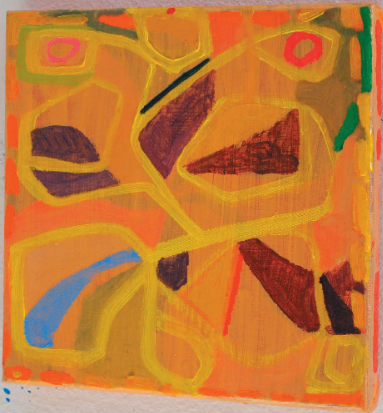
„ohne Titel“ Öl auf Gewebe 24 x 24 cm, 2015