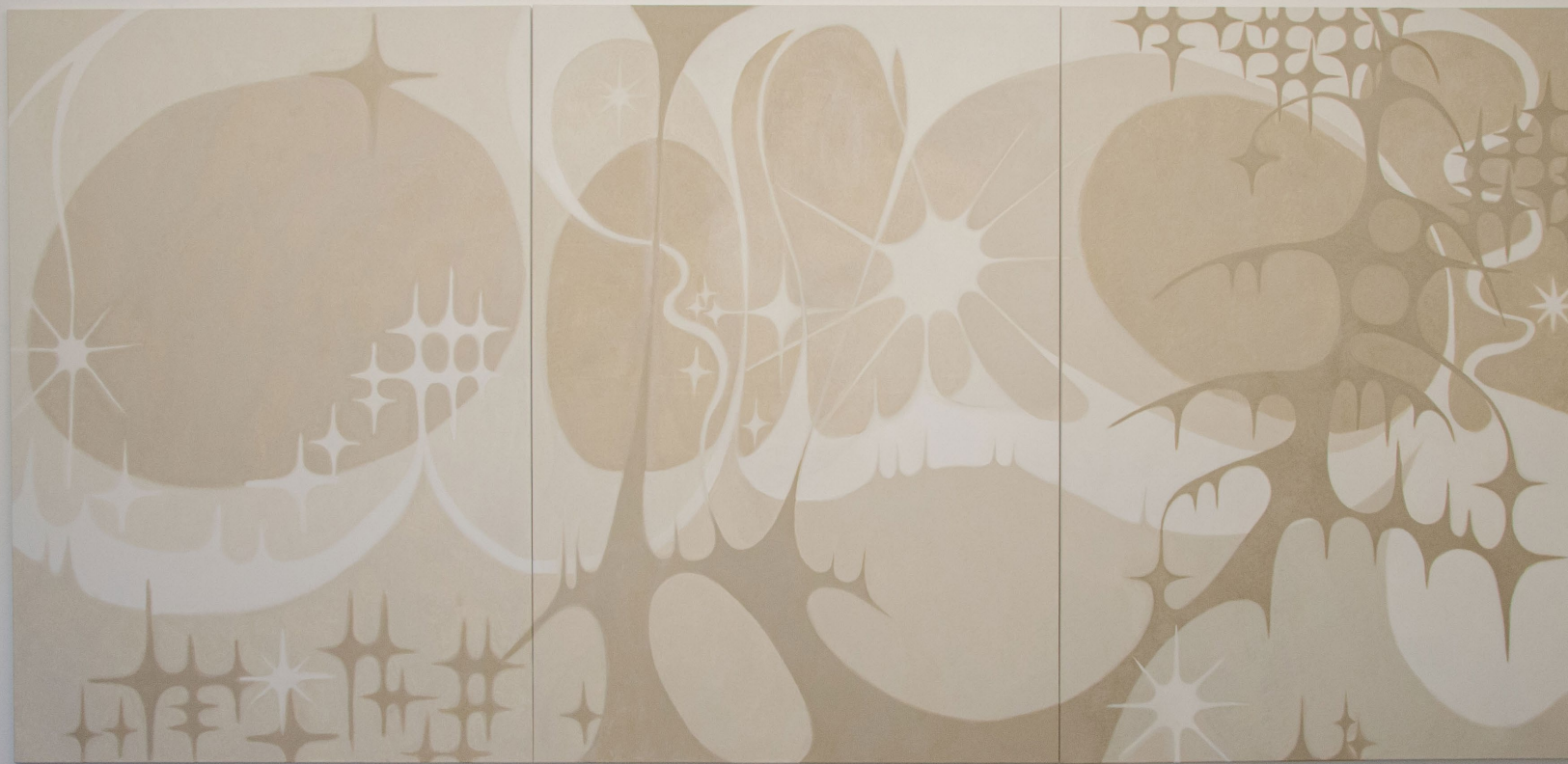
Aline Witschi Sternförmiges Denken (2) , 2023

Öl auf Leinwand, 3 x 180 x 125 cm, Installation: Solo Show (Aline Witschi) , lokal-int, Biel 2023