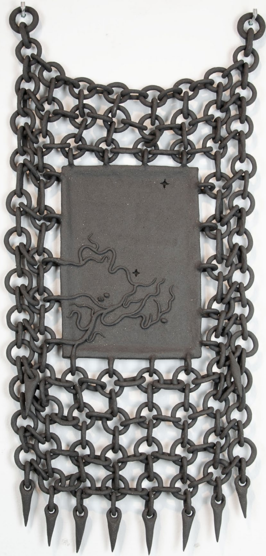
Aline Witschi Sorceress Blood , 2023

grob schamottierter Ton gebrannt, 78 x 35 x 4 cm, Installation: TWILIGHT IN MY GARDEN , Galerie Mayhaus, Erlach 2023, Foto: Aline Witschi