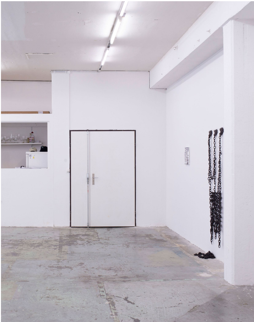
Aline Witschi Another Piece of Gaia , 2023

grob schamottierter Ton gebrannt, Grösse variabel, Installation: The Third Landscape , Toxi, Zürich 2023