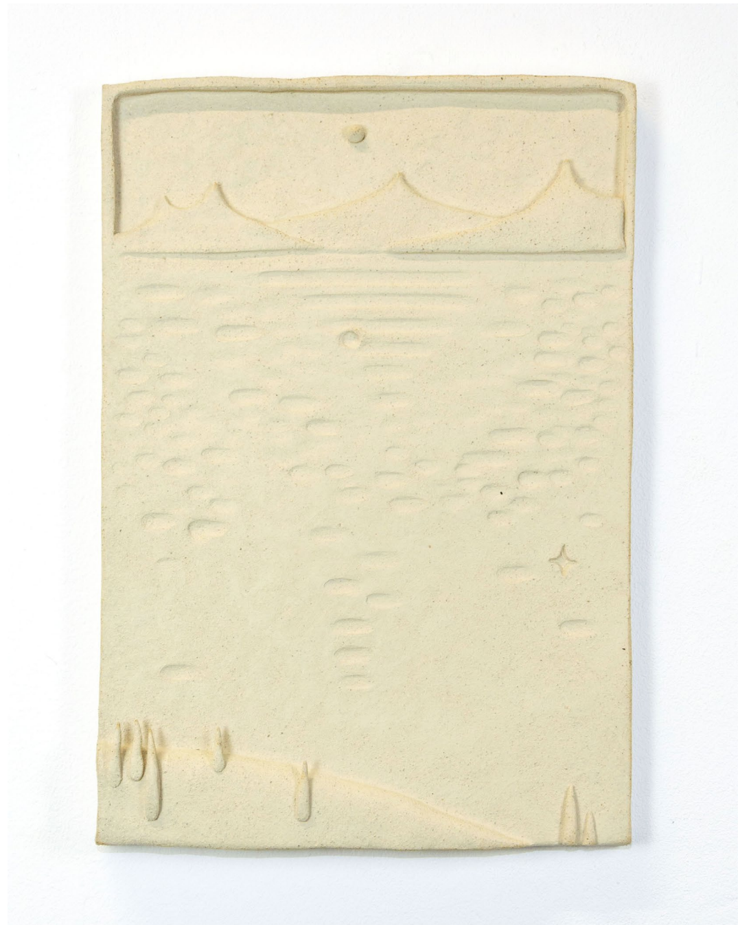
Aline Witschi Where Are The Sceletons , 2023

grob schamottierter Ton gebrannt, 52 x 31 x 6 cm, Installation: Installation: TWILIGHT IN MY GARDEN , Galerie Mayhaus, Erlach 2023, Fotos: Aline Witschi