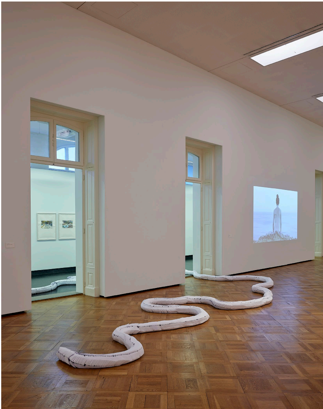
Aline Witschi Himmel und Hölle , 2019

Kopierpapier gefaltet, Grösse variabel, Installation: Cantonale Berne Jura , Kunsthalle Thun, Thun 2022