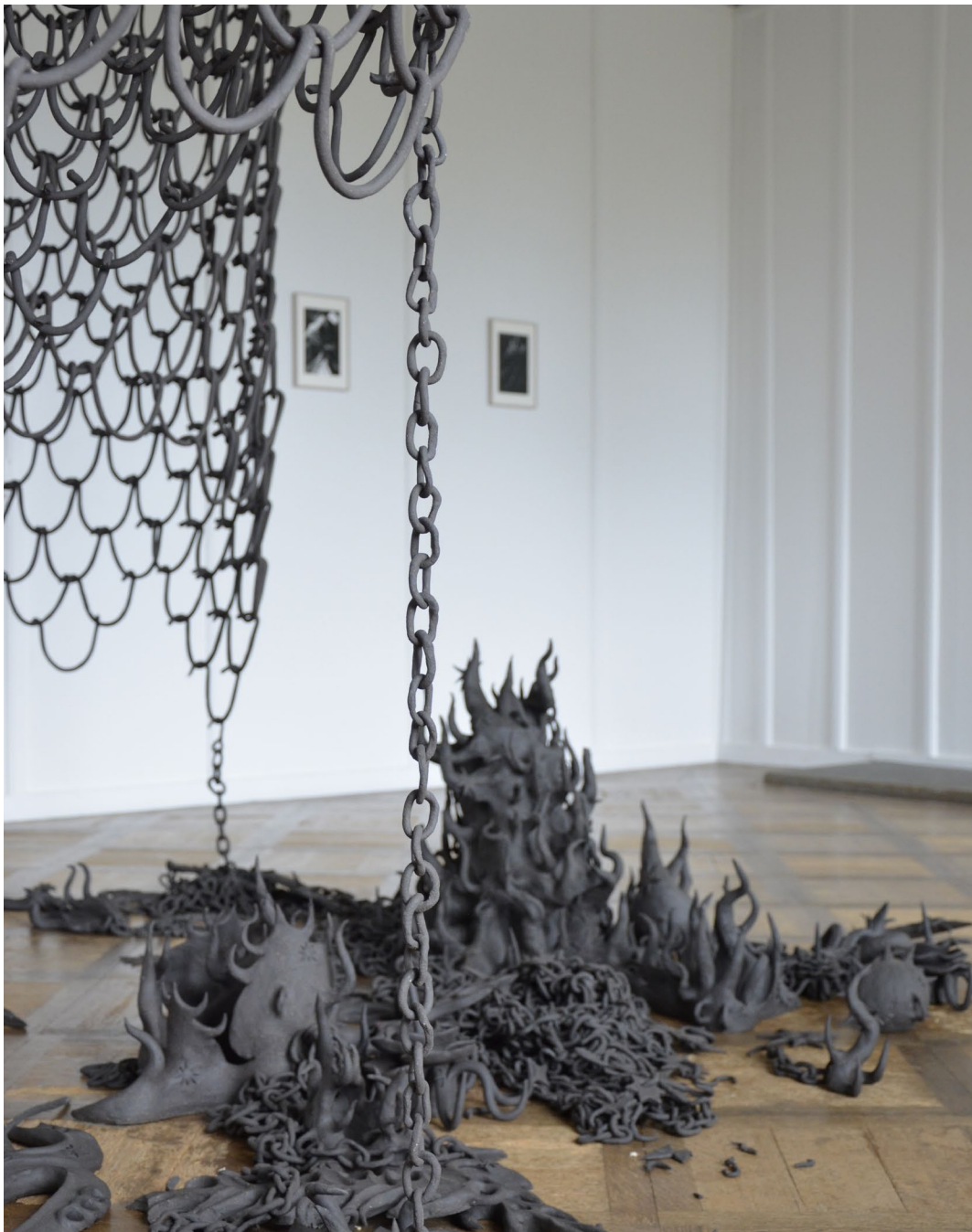
Aline Witschi Star Shooting , 2022 Sound from World End (Castle 4) , 2021 Sound from World End (Castle 5) , 2021