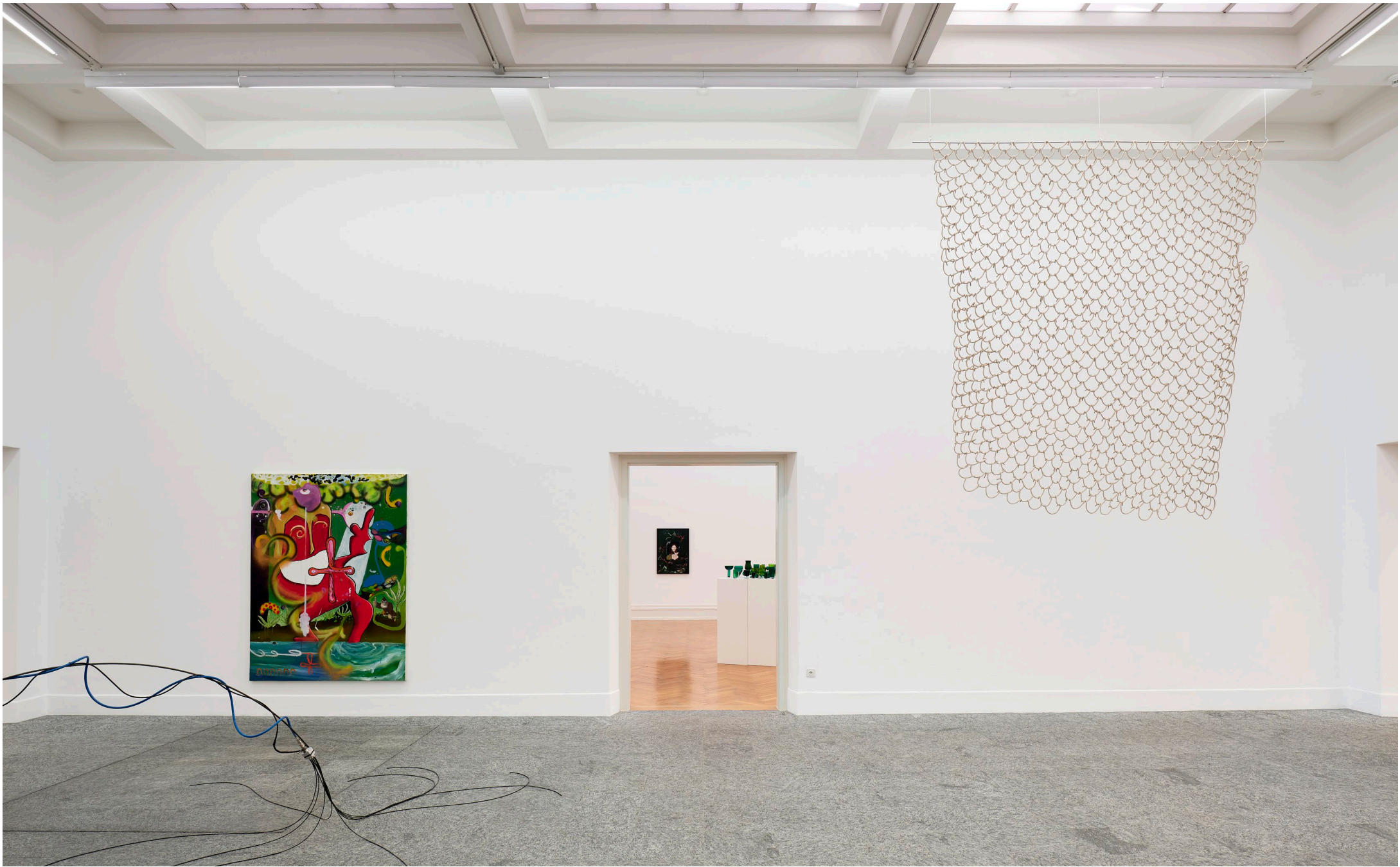
Aline Witschi untitled , 2018