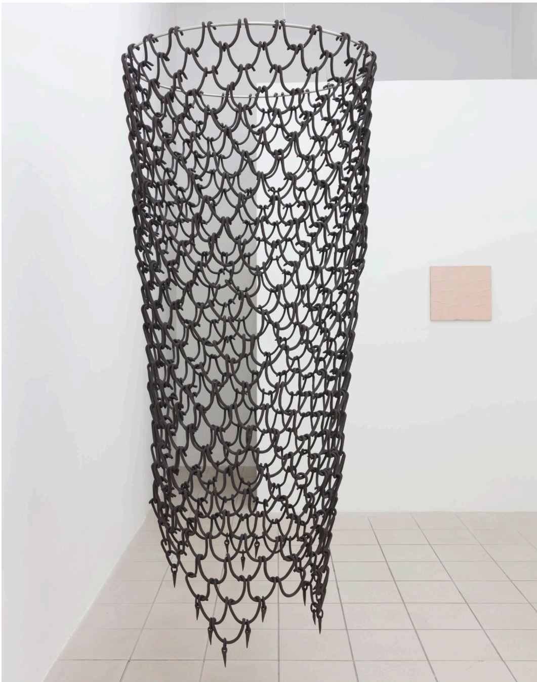
Aline Witschi Sound from World End (Castle 3) , 2021

grob schamottierter Ton gebrannt d 91 x 200 cm (weitere d: 46, 69, 114, 160cm) Installation: Träumt der Kokon vom Fliegen? (mit Olga Jakob), Leipzig 2023