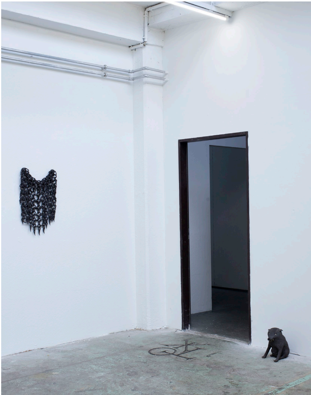
Aline Witschi Bone with Hair , 2023

grob schamottierter Ton gebrannt, 40 x 40 cm Installation: The Third Landscape , Toxi, Zürich 2023