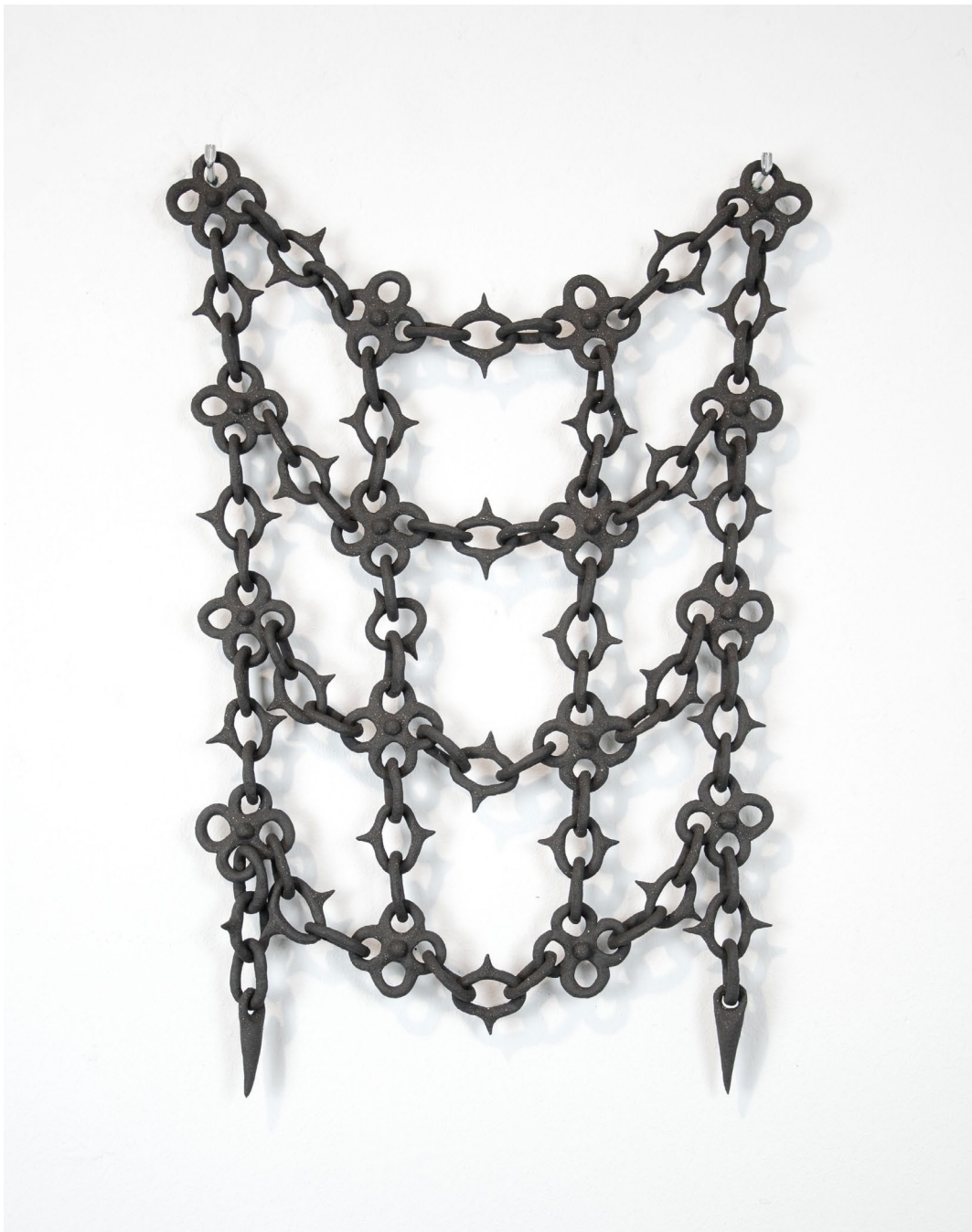
Aline Witschi Majestic Rain , 2023

grob schamottierter Ton gebrannt, 54 x 37 x 4 cm, Installation: TWILIGHT IN MY GARDEN , Galerie Mayhaus, Erlach 2023