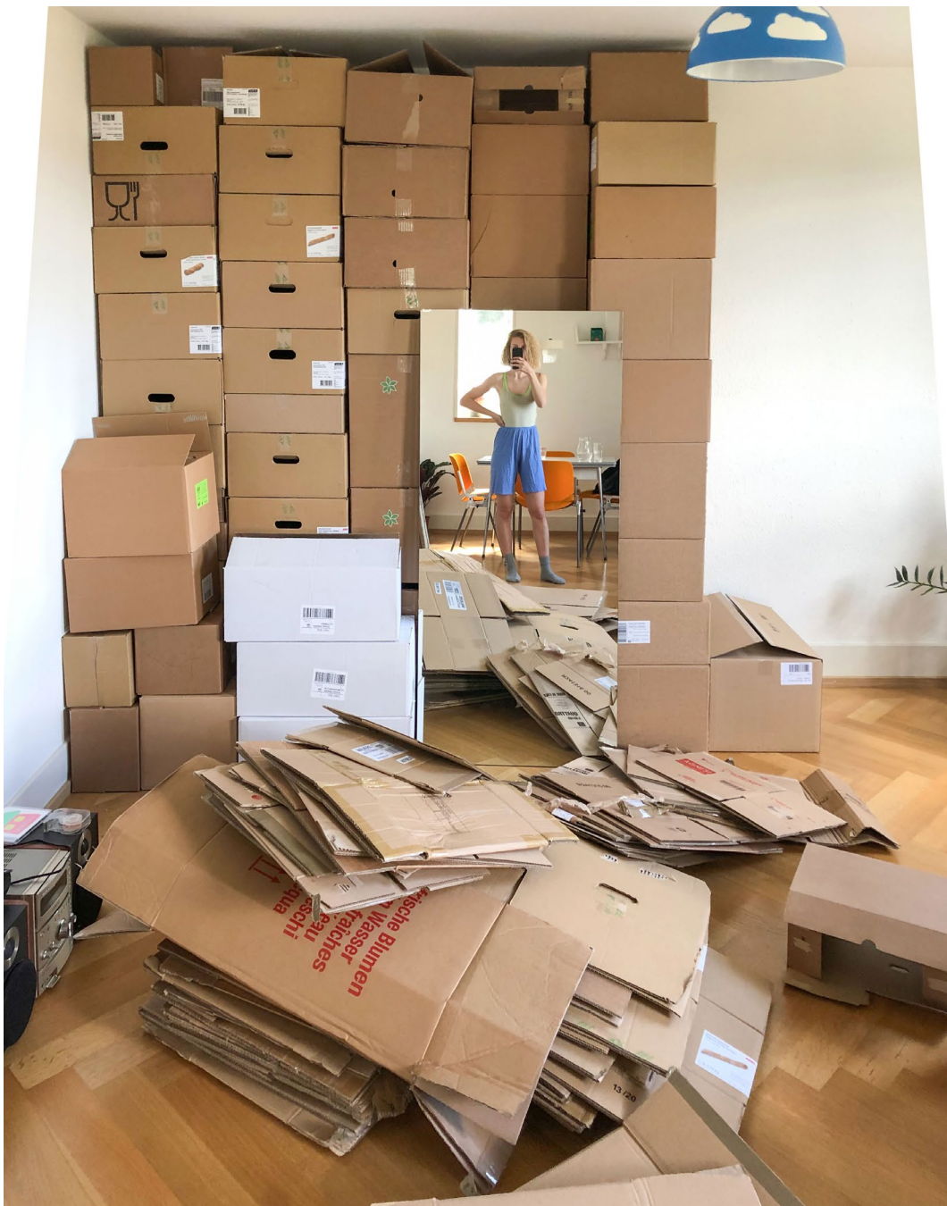
Aline Witschi Mein Raum , 2020