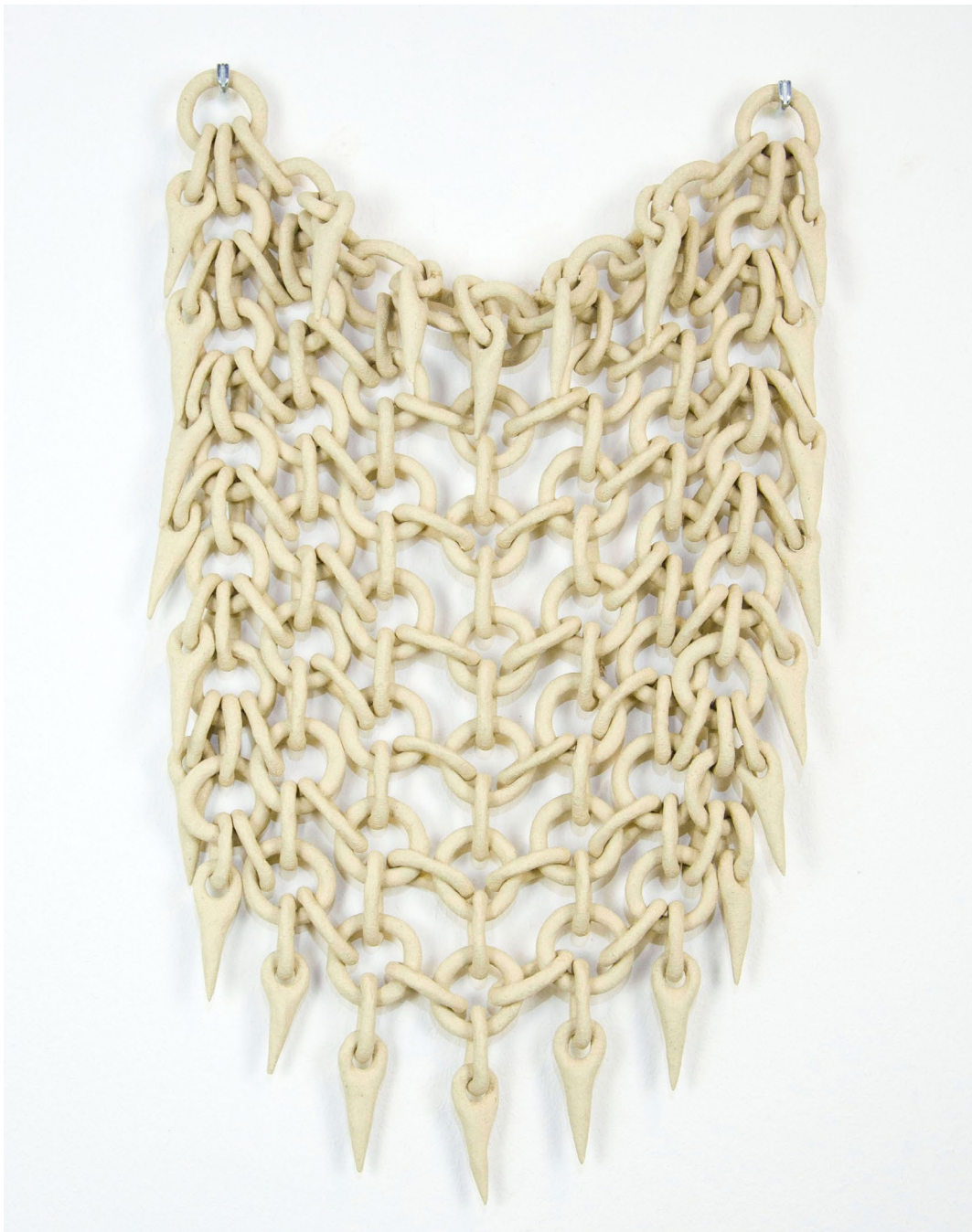
Aline Witschi A Defending Community , 2023

grob schamottierter Ton gebrannt, 52 x 31 x 6 cm, Installation: Installation: TWILIGHT IN MY GARDEN , Galerie Mayhaus, Erlach 2023