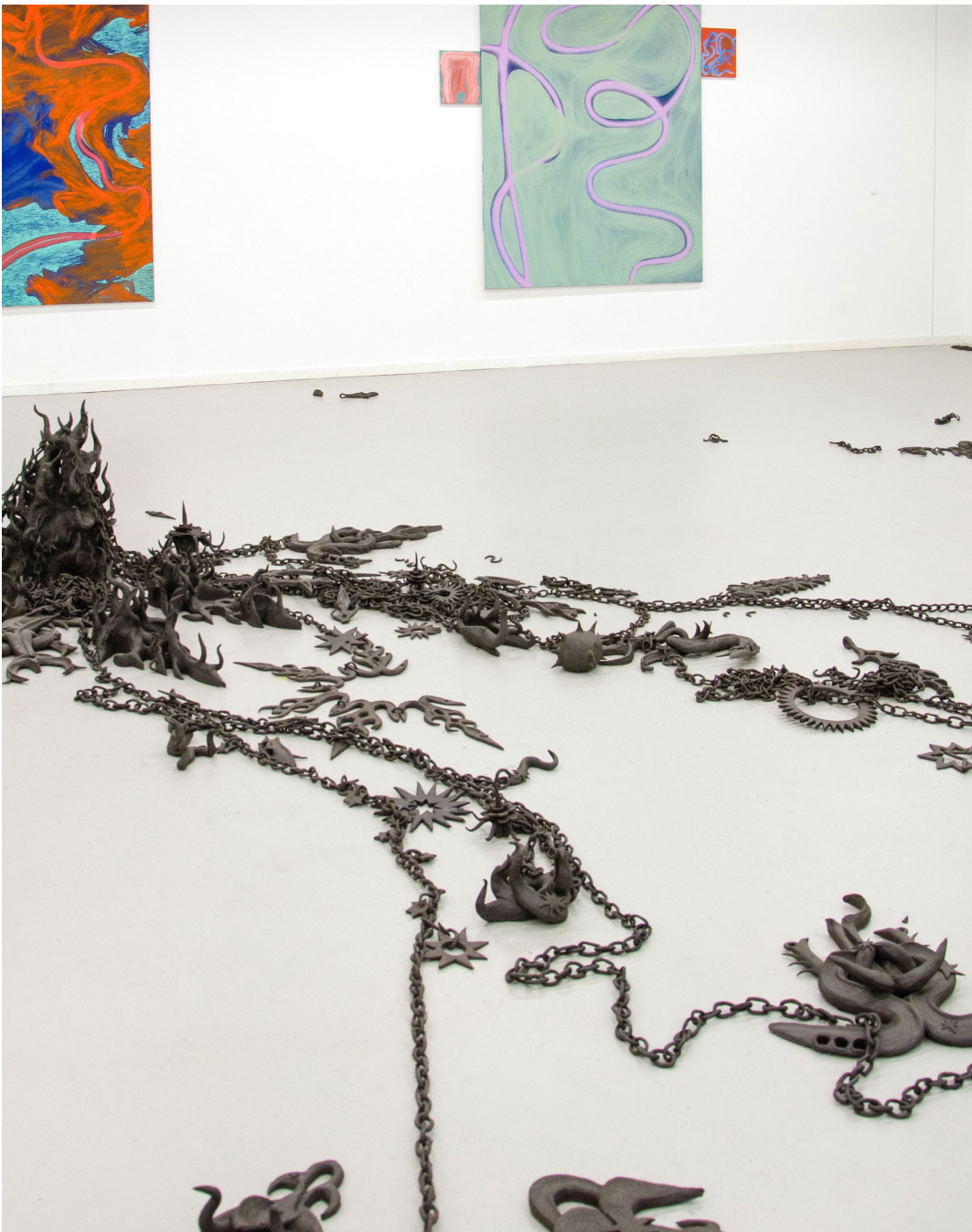
Aline Witschi Star Shooting , 2022

grob schamottierter Ton gebrannt, Grösse variabel, Installation: Toni Areal, Zü- rich 2022 (mit Shannon Zwicker)