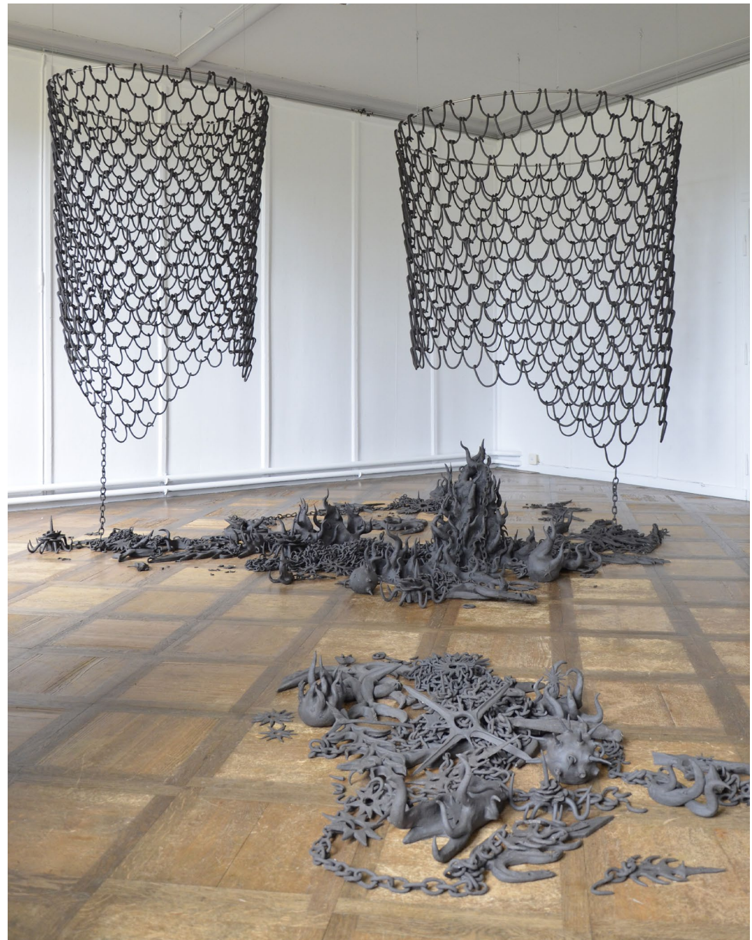
grob schamottierter Ton gebrannt, Metallringe d 114 und 116cm, Installation: TWILIGHT IN MY GARDEN , Galerie Mayhaus, Erlach 2023