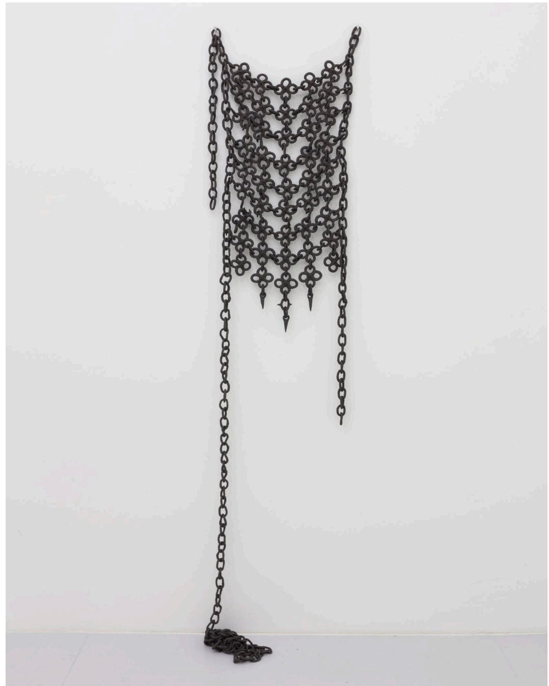
Aline Witschi I Feel Left Is Right_3 , 2023

grob schamottierter Ton gebrannt, 54 x 37 x 4 cm, Installation: TWILIGHT IN MY GARDEN , Galerie Mayhaus, Erlach 2023