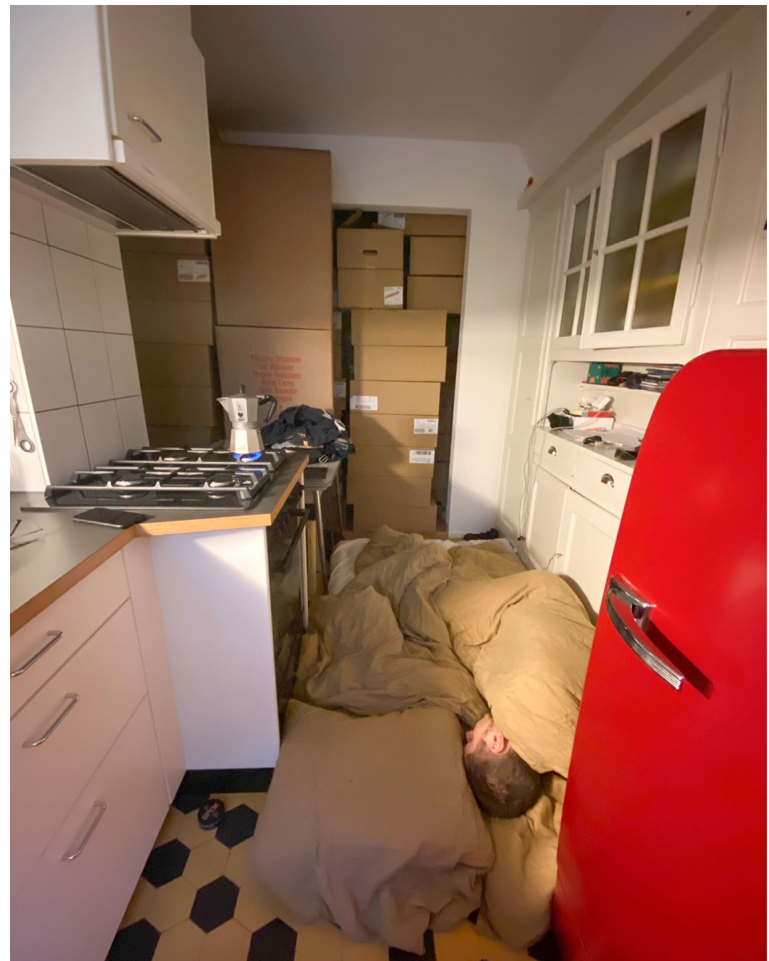
Situation in meiner Wohnung, der Migros und im Centre Pasquart, 8 Wochen