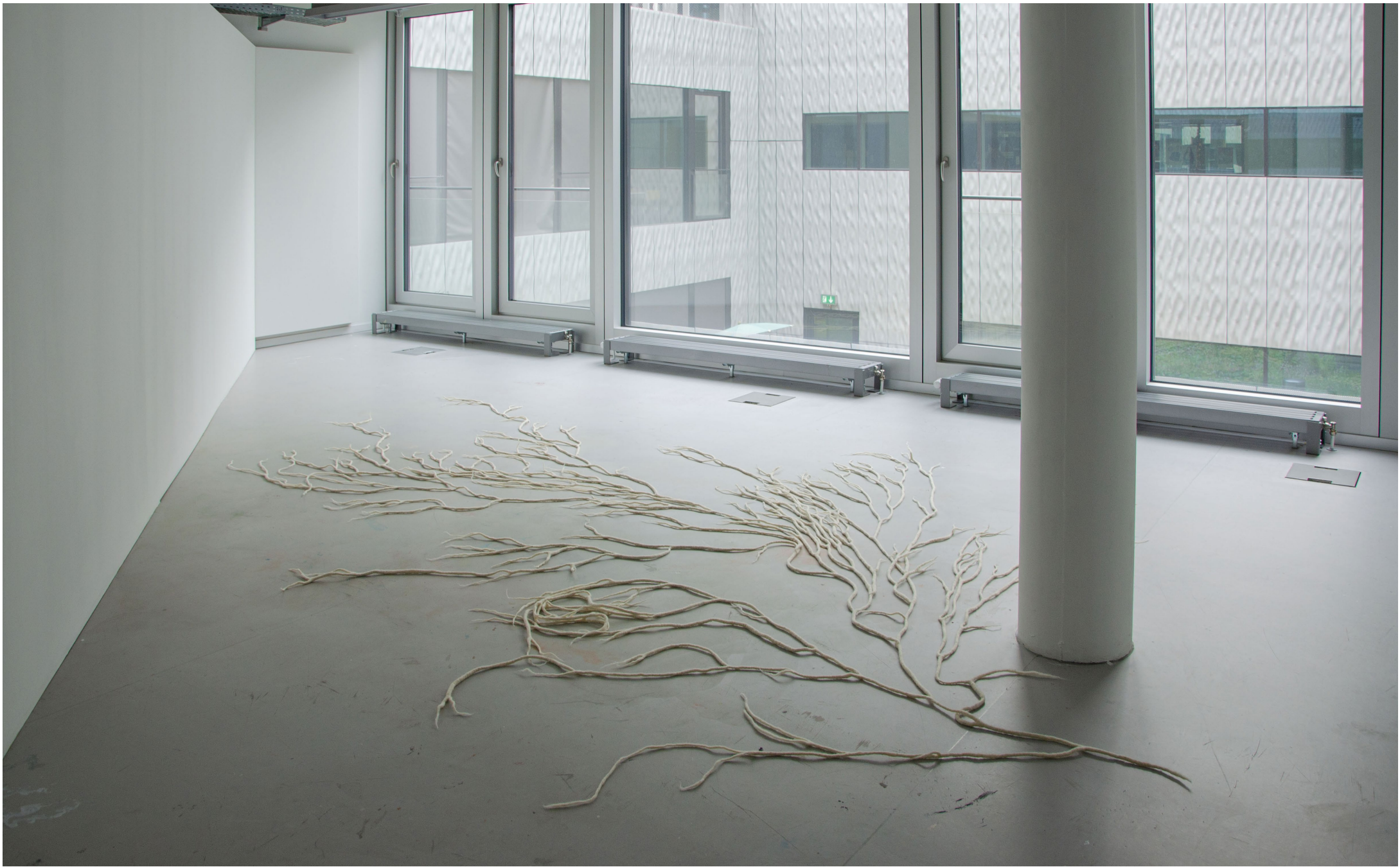
Aline Witschi Tears of a Hot Shower , 2023