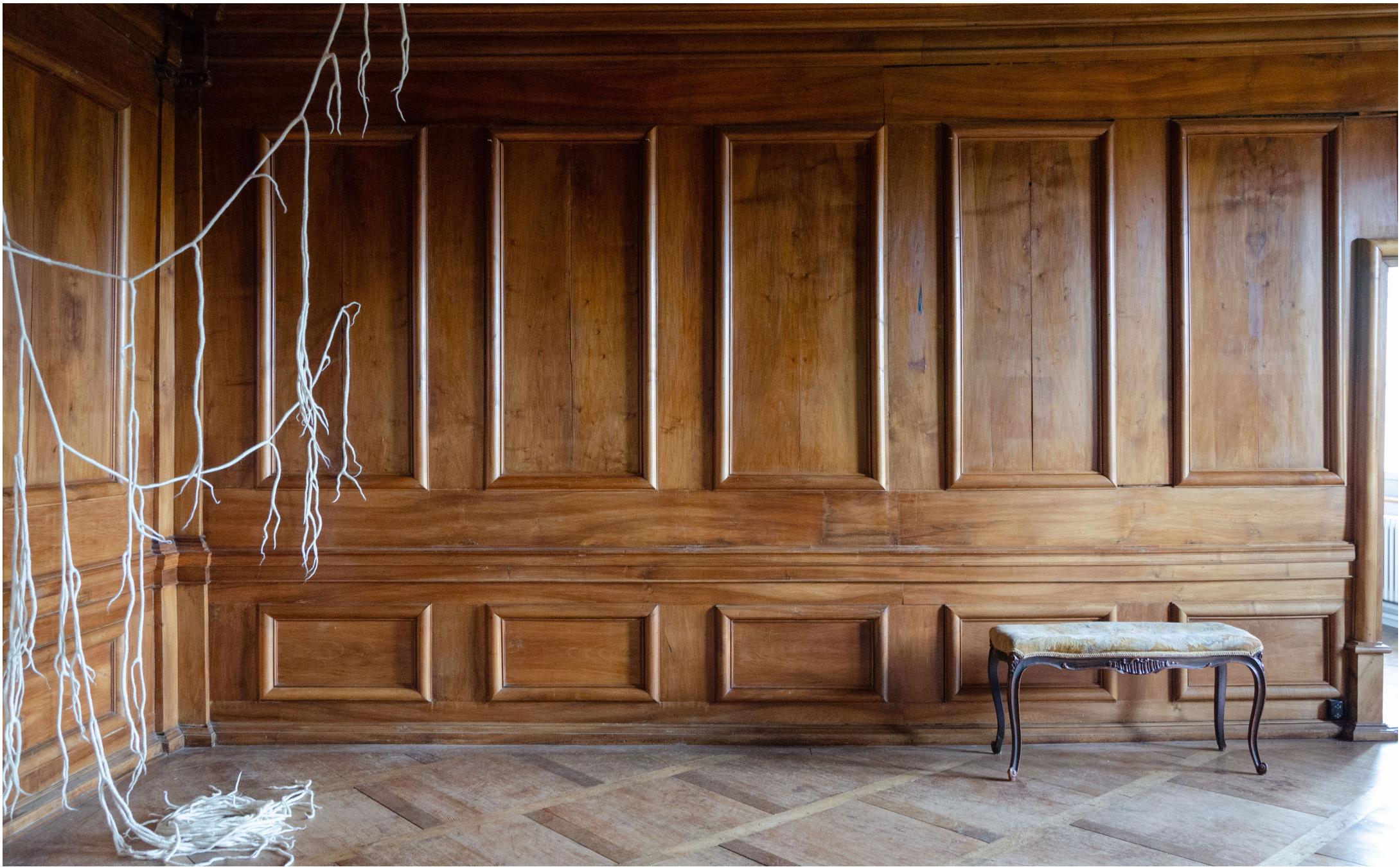
Aline Witschi Tears of a Hot Shower , 2023