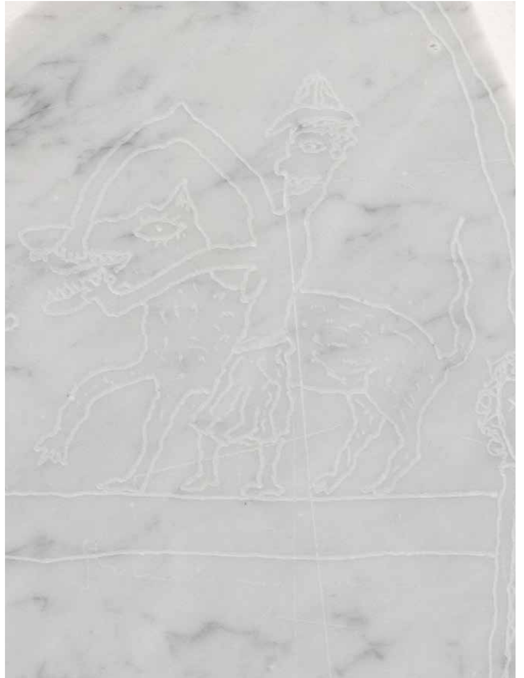
Kerberos, flowers & friends, 2023, Marmor graviert, Grosse Regionale, Alte Fabrik, Rapperswil