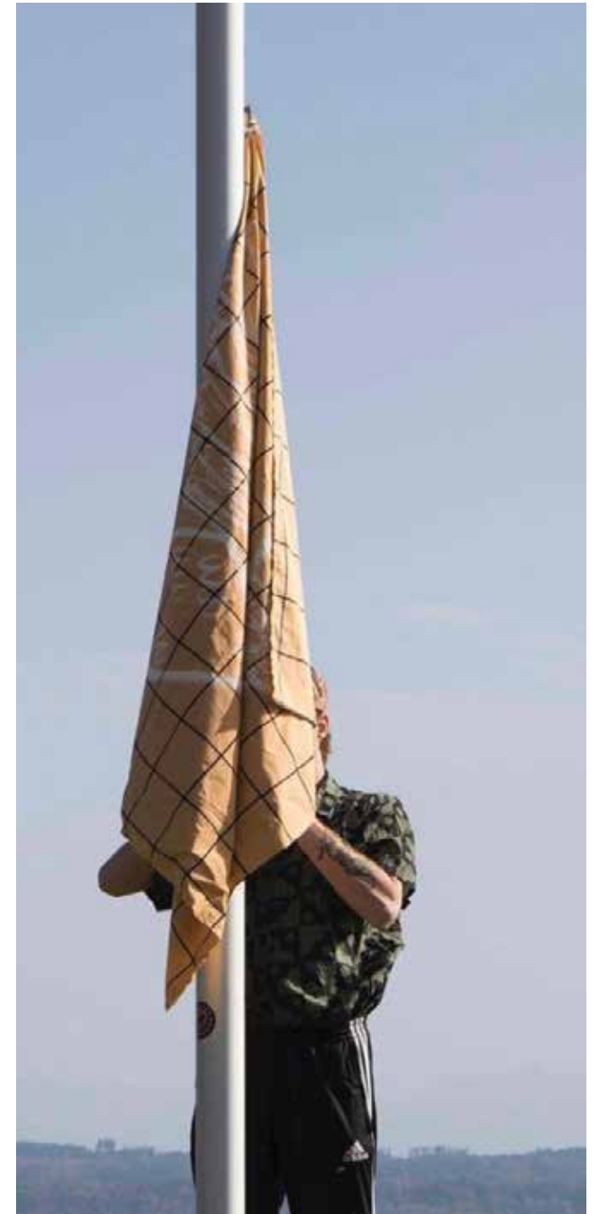
Foie de Canard , 2023, Malerei auf St.Galler Textil, 120 x 120 cm, MAT Artspace, Neuchatel