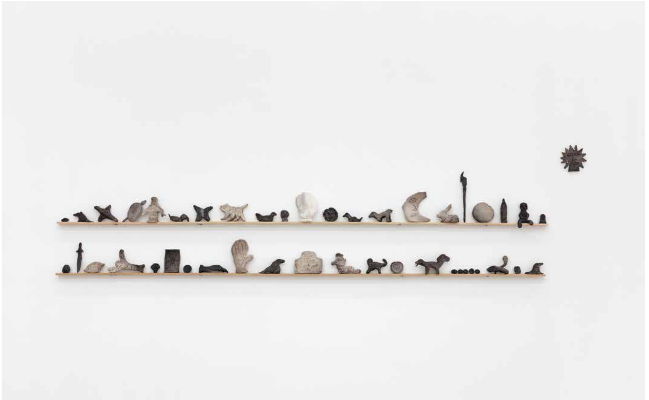
Rituelle Artefaktetefakte , 2022/23, gekölnerte Keramik auf Eichenholz, 180cm x 3cm, AURA, Düsseldorf