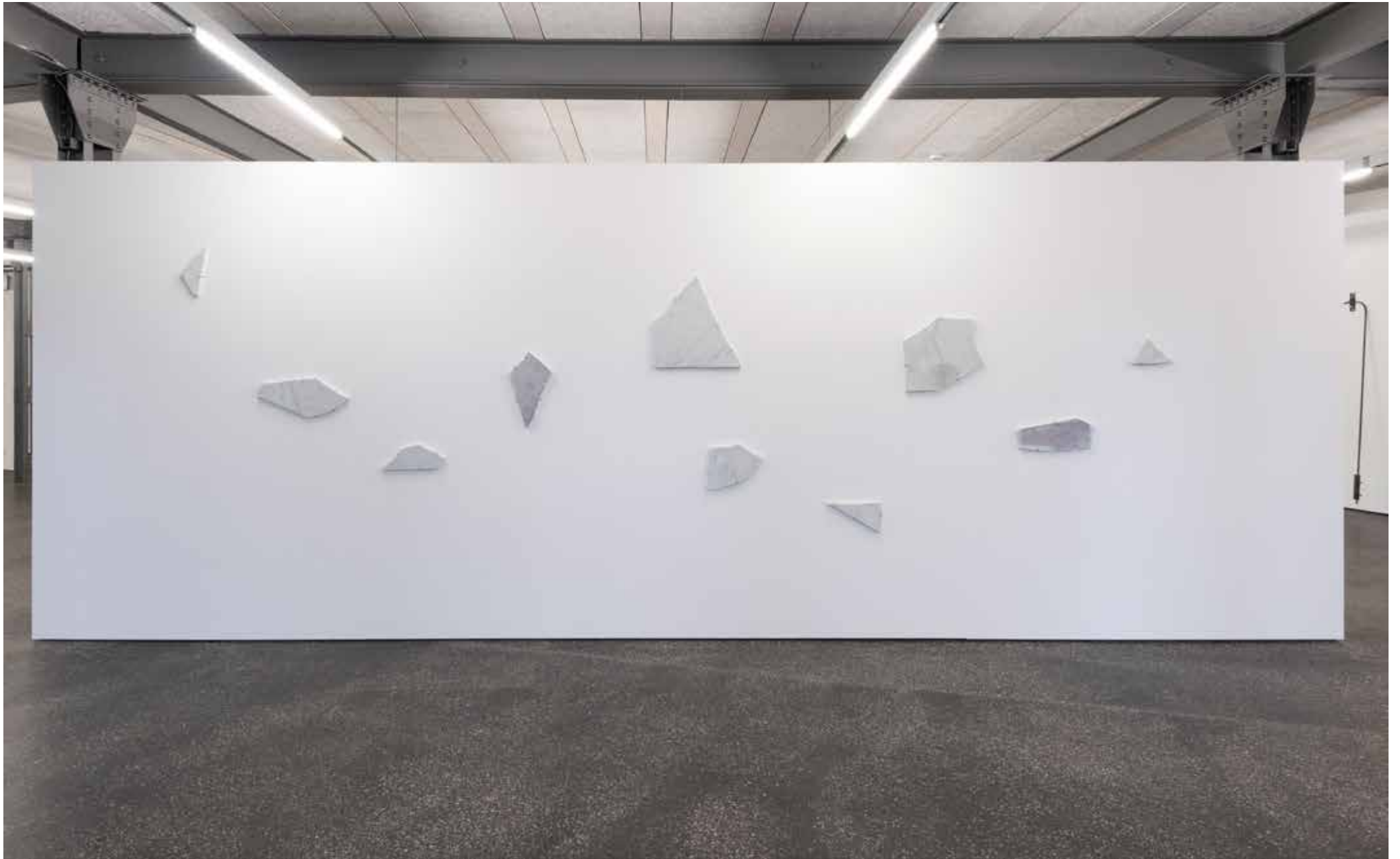
Kerberos, flowers & friends , 2023, Marmor graviert, Grosse Regionale, Alte Fabrik, Rapperswil