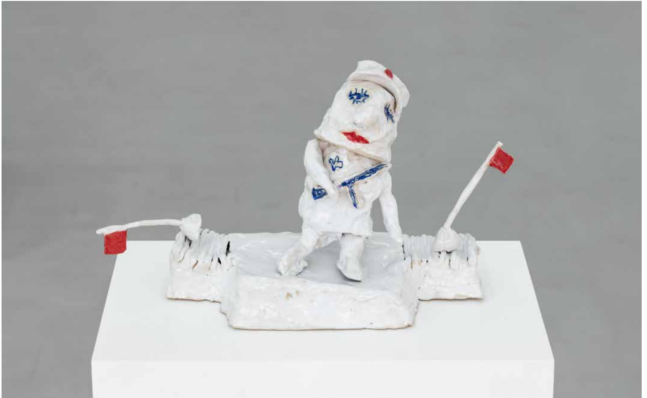
Monsieur Triste , 2022, Keramik, ca. 40 x 35 cm, AURA, Düsseldorf