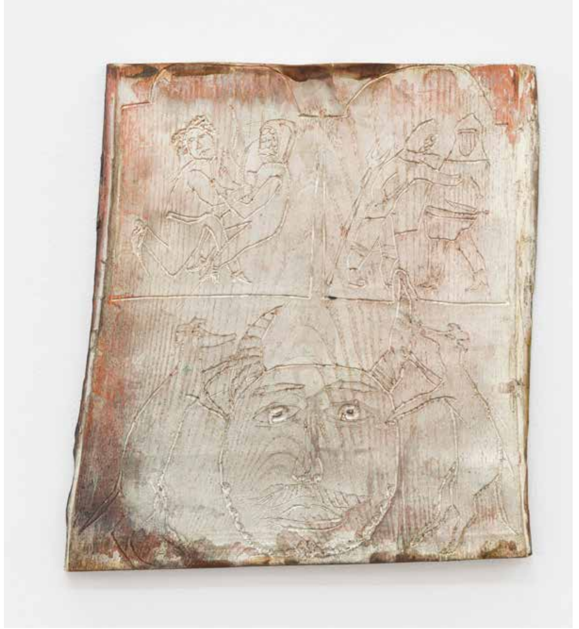
Guardia Pontifika & Gladiatoren im Schlund , 2023, Kupferguss, 190cm & 44cm x 50cm AURA, Düsseldorf