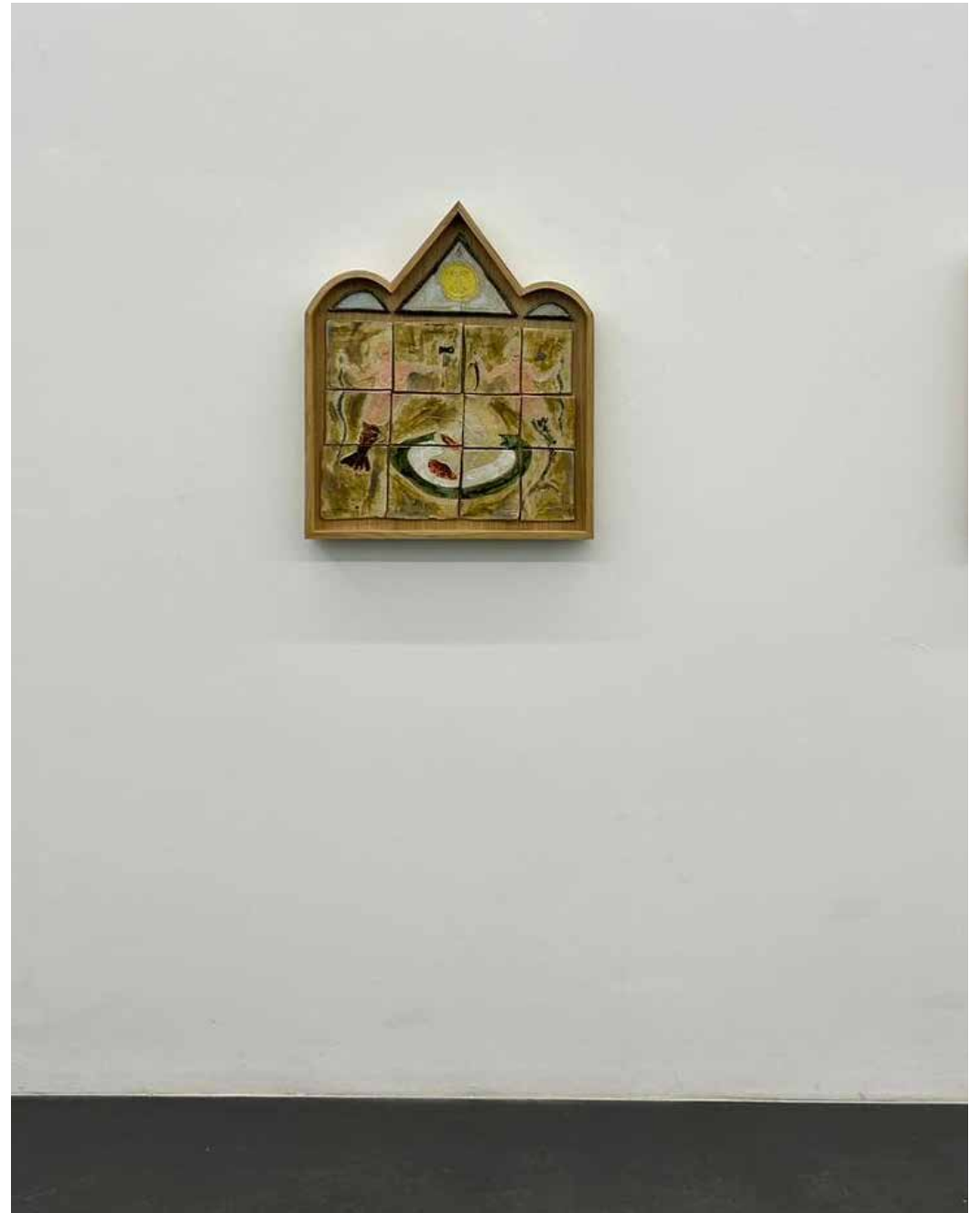
Johannes der Täufer, dann dachte ich an Meeresfrüchte, 2023, Keramik im Eichenrahmen, Atelier Ansicht, Enter Art Fair, Kopenhagen