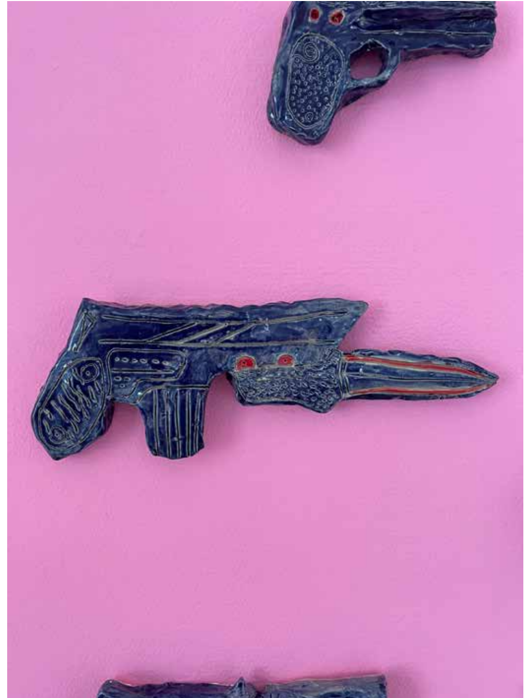
Les armes du peuple , 2022, 27 Pistolen aus Keramik und geritzt, div. grössen, Musée jurassien des Arts, Moutier