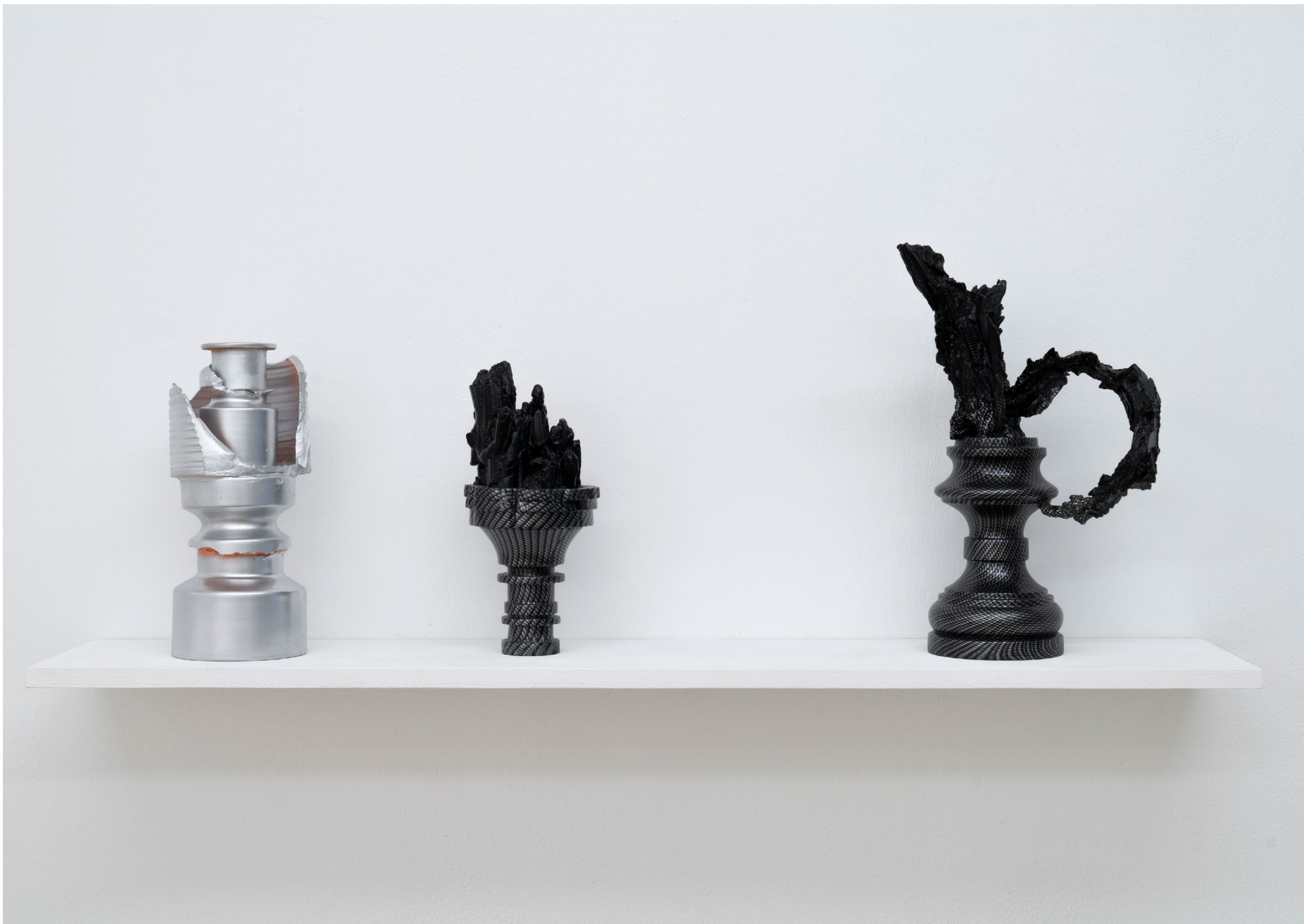
Carbon Steine / Chrom Vasen 2020