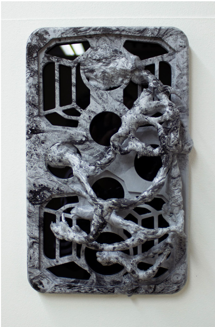
Werkeingabe Controller 2023 Sperrholz, Acrytal, Wassertransferdruck, Acrylglas 21 x 30 x 7cm