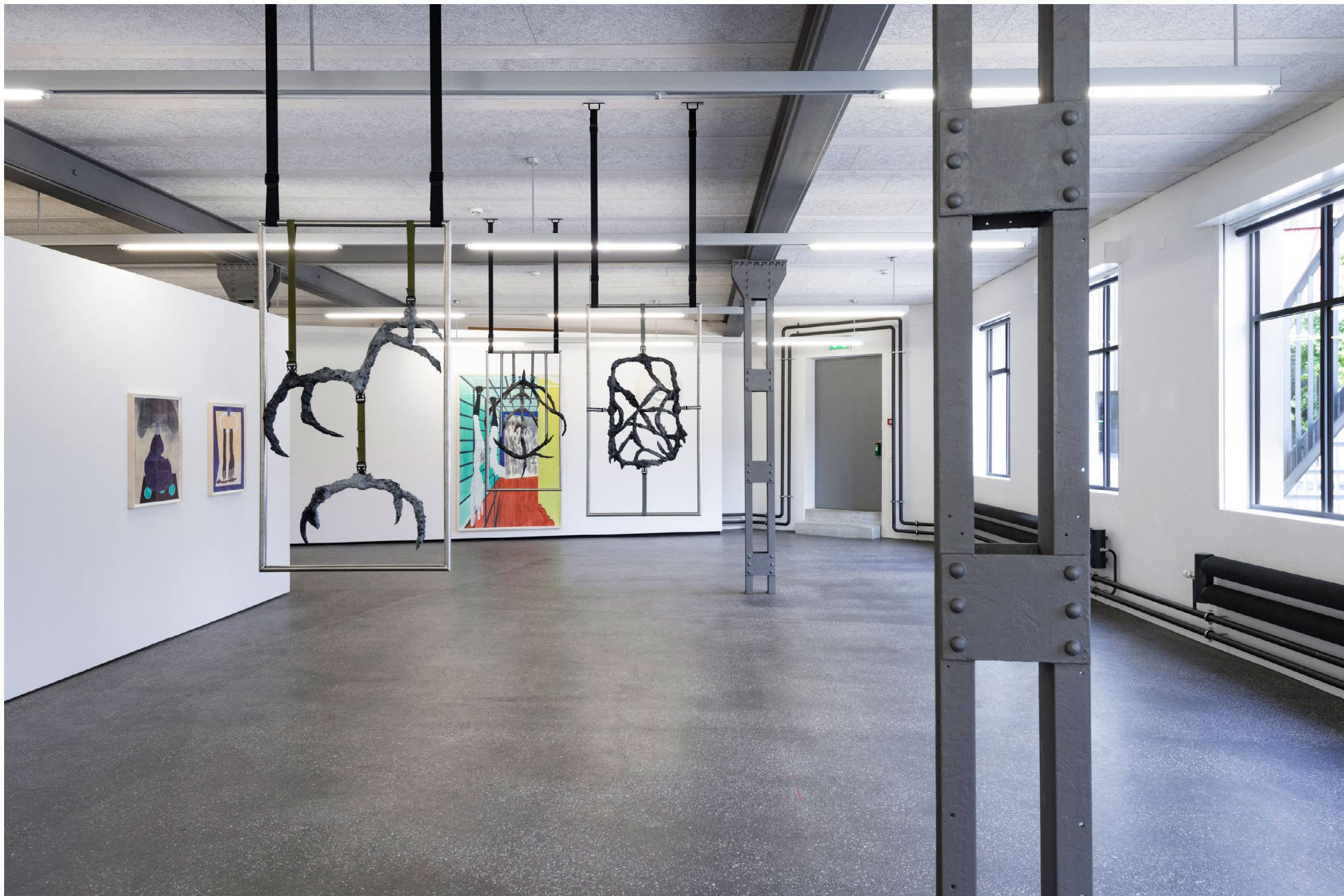
Werkeingabe Adventure Trail 2023 Chromstahl, Stahl, Gurtband, Plastikschnallen, Acrylstaal, Lack, Wassertransferdruck Verschiedene Grössen