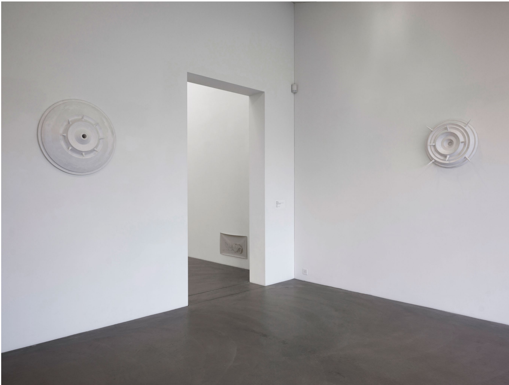
Werkeingabe Strahler 2023 Gips verschiedene Grössen