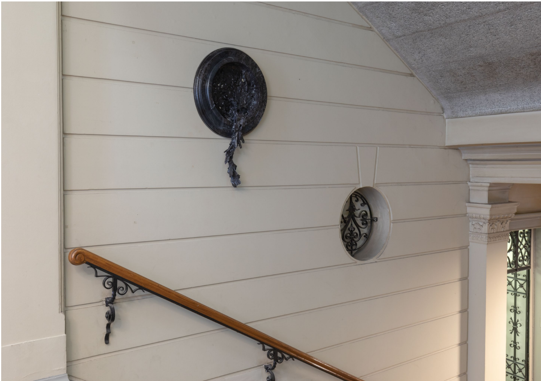
Marmorauge 2019 Gips, Lack, Wassertransferdruck 85 x 50 x 15 cm

Ausstellungsansicht: Auflage ..../5000, 2019, Kunsthaus Langenthal