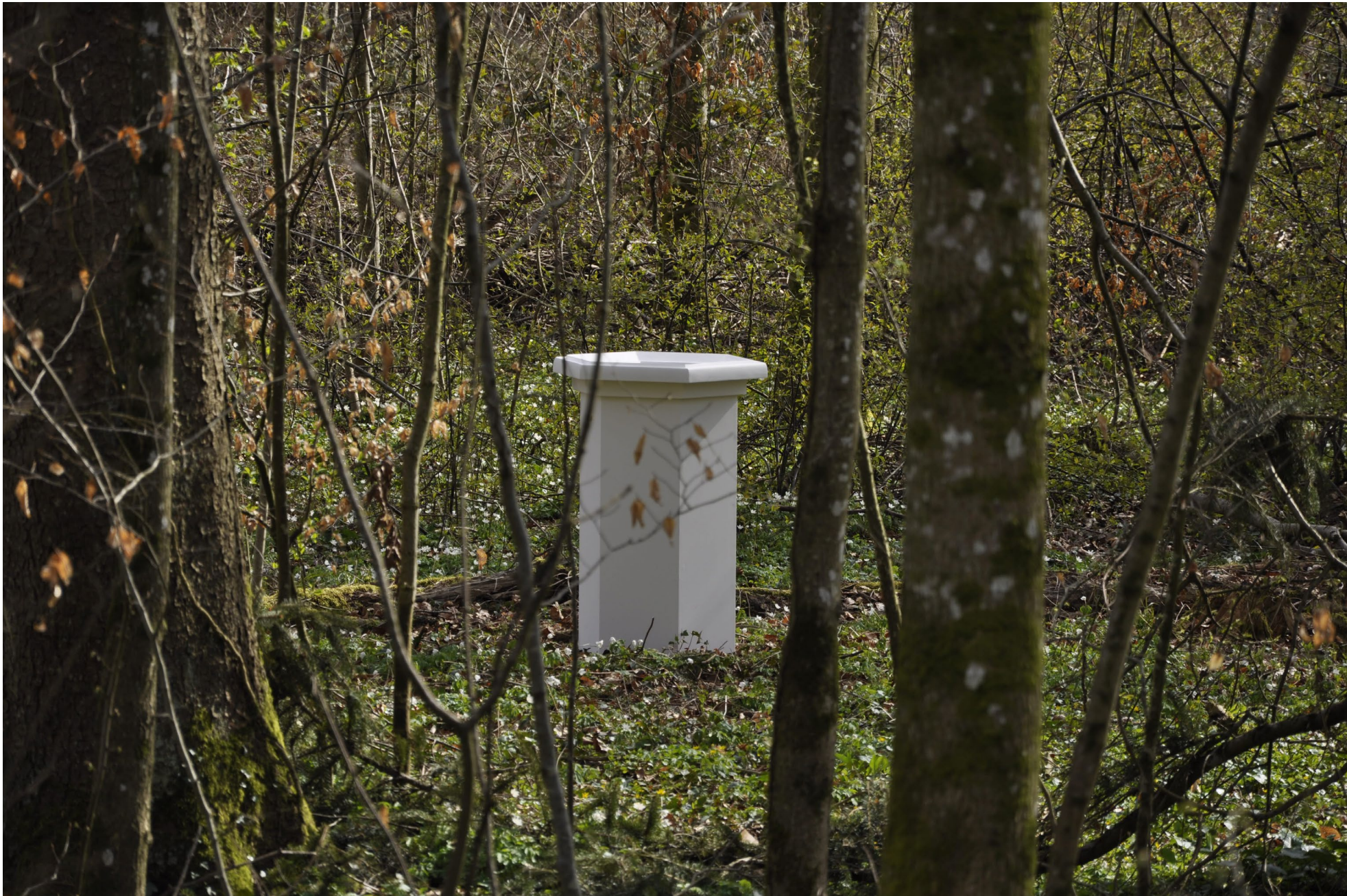
Portal 2020 Öl und Leimfarbe auf Spanplatten und Gips 69×96×69cm Bremgartenwald, Bern 2020