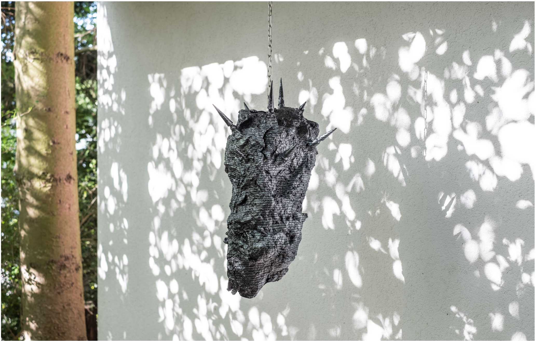
Pendel 2020 Wassertransferdruck auf Acryllast und Holz 68 x 32 x 39cm

Ausstellungsansicht: Sculpture Garden 2021, Mansion Steiger, Arlesheim