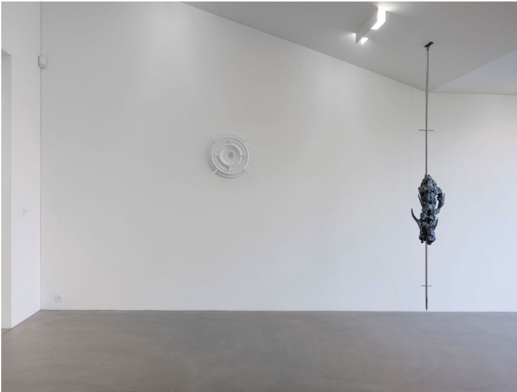
Werkeingabe Strahler 2023 / Mimetic Polycarbon 2022 (v.l.n.r.) Gips / Chromstahl, Stahl, Acrystal, Lack, Wassertransferdruck verschiedene Grössen