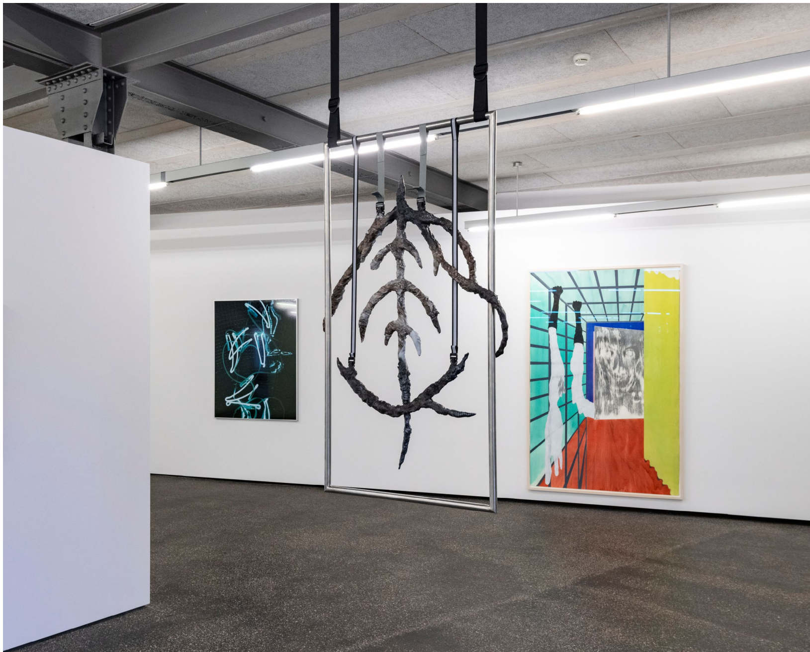
Werkeingabe Adventure Trail 2023 Chromstahl, Stahl, Gurtband, Plastikschnallen, Acrylstaal, Lack, Wassertransferdruck Verschiedene Grössen