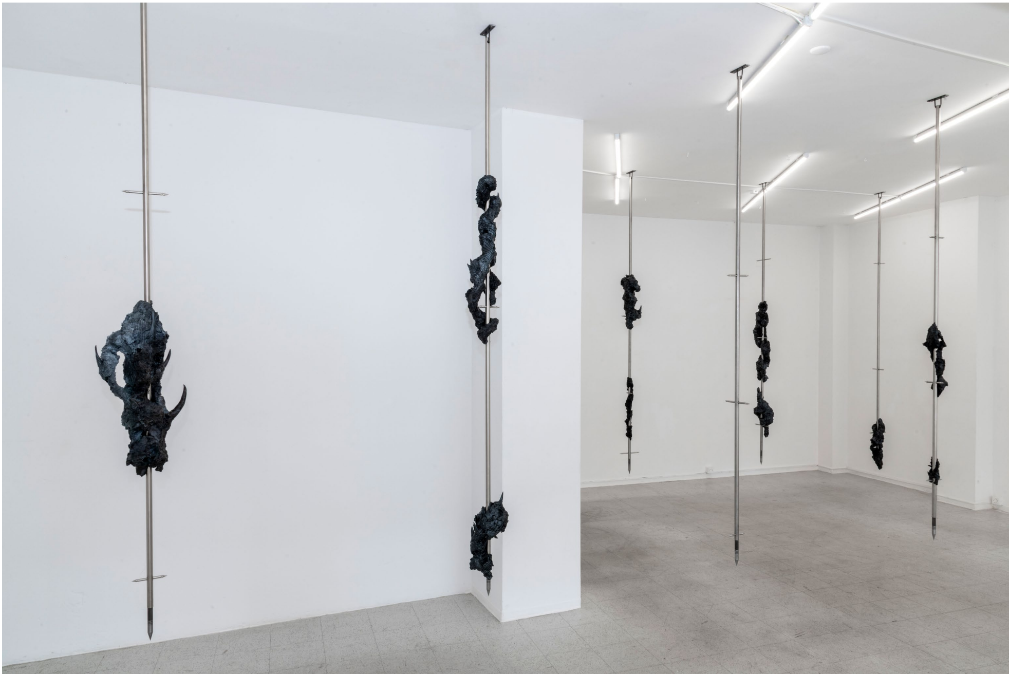
Mimetic Polycarbon 2022

Chromstahl, Stahl, Acrylstaal, Lack, Wassertransferdruck Verschiedene Grössen