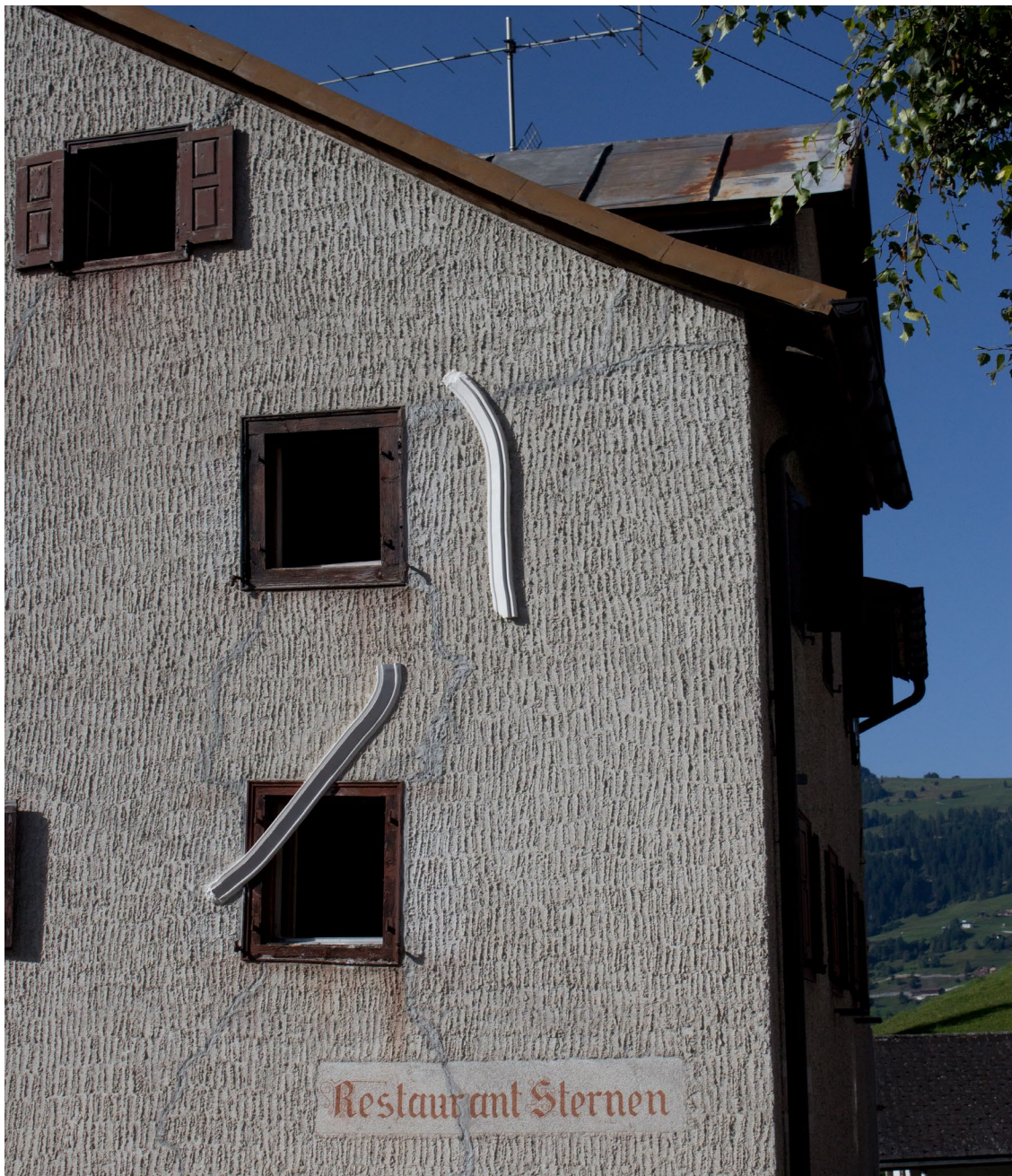
Pflaster 2019 Gips Verschiedene Grössen