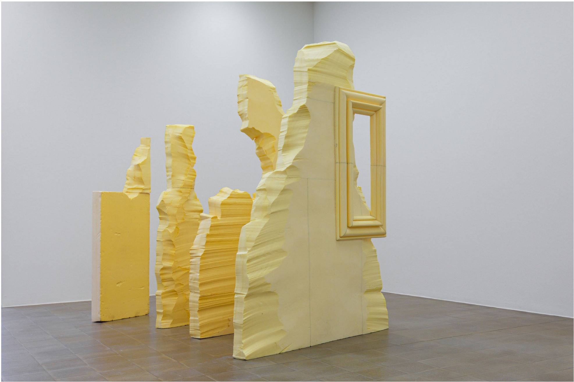
Berg 2020 Pu- Schaumplatten, Bauschaum 210 × 238 × 200cm

Ausstellungsansicht: Cantonale Berne Jura 2020/21 Centre d'art Pasquart, Biel/Bienne