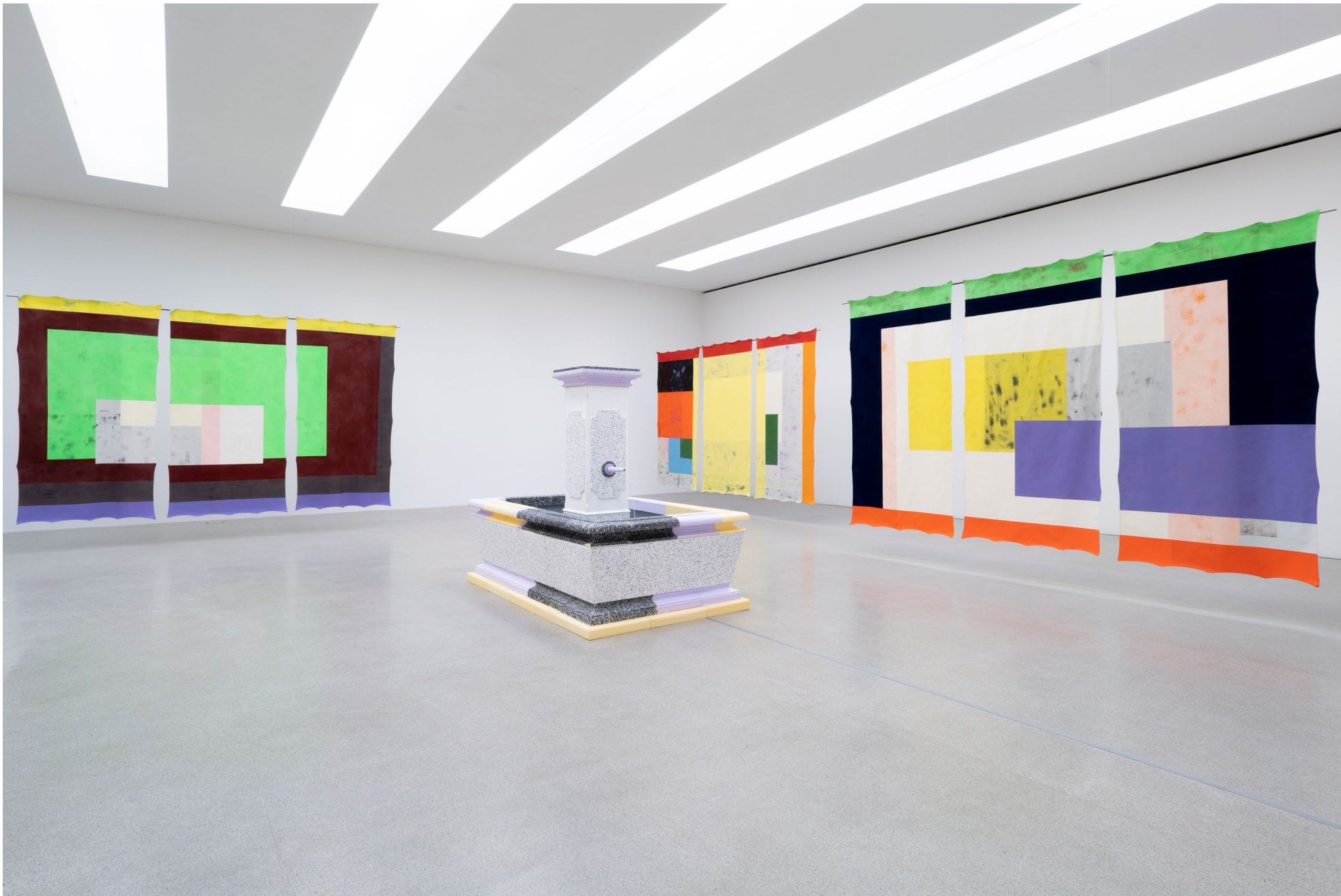
Ausstellungsansicht: Cantonale Berne Jura 2022/23 Centre d'art Pasquart, Biel/Bienne