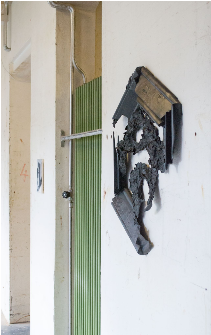
Ohne Titel (Ornament) 2020 Acryl, Glasfaser, Lack, Wassertransferdruck 95 × 90 × 15 cm

Ausstellungsansicht: Lost In Transition, 2020, Bacio, Bern