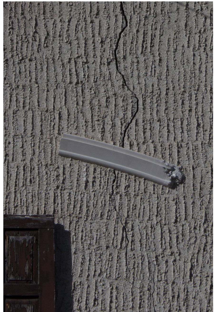
In Situ, Zorten, Restaurant Sternen, 2019