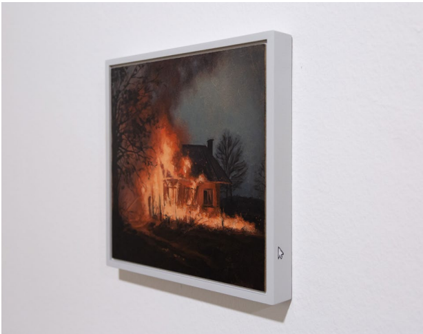
unten: /imagine/burning_6.jpg 2023 25.3cm x 25.3cm Öl auf Hartfaserplatte