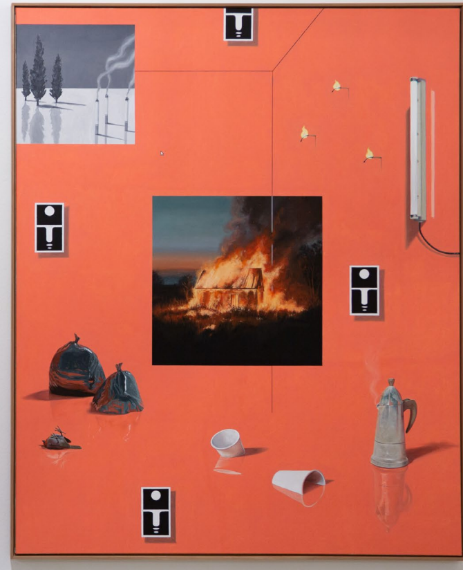
nature_morte_V 2023 133cm x 163cm Öl auf Leinwand