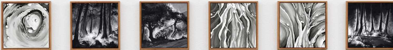
Ausstellungsansicht: Balkonien (in Zusammenarbeit mit Jaana Rau) 2023 je 23cm x 23cm Öl und Eitempera auf Hartfaserplatte