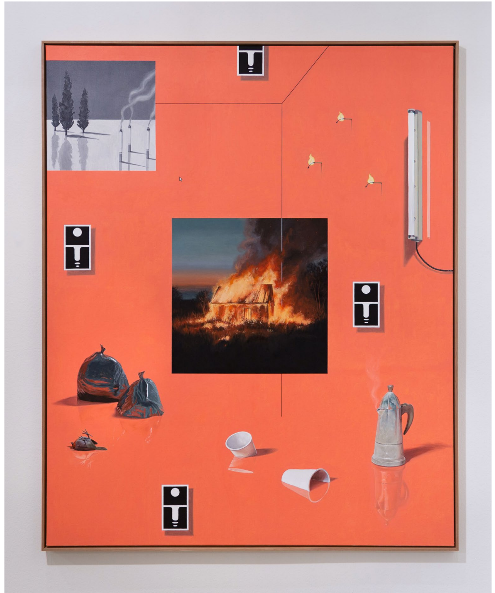
Werk 2: nature_morte_V 2023 133cm x 163cm Öl auf Leinwand