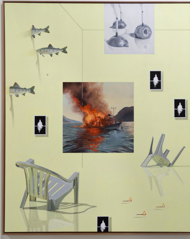
nature_morte_IV 2023 133cm x 163cm Öl auf Leinwand