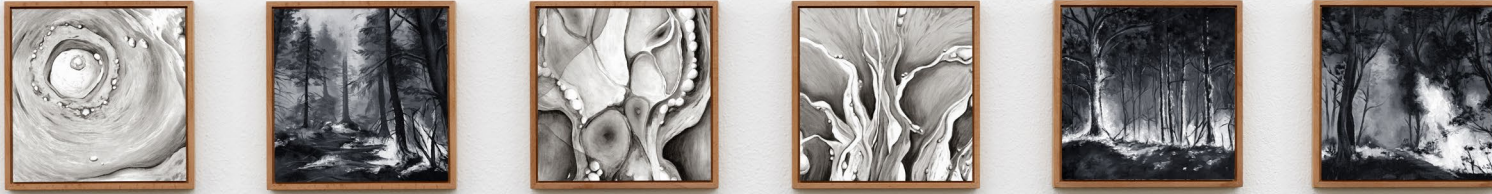
Ausstellungsansicht: Balkonien (in Zusammenarbeit mit Jaana Rau) 2023 je 23cm x 23cm Öl und Eitempera auf Hartfaserplatte