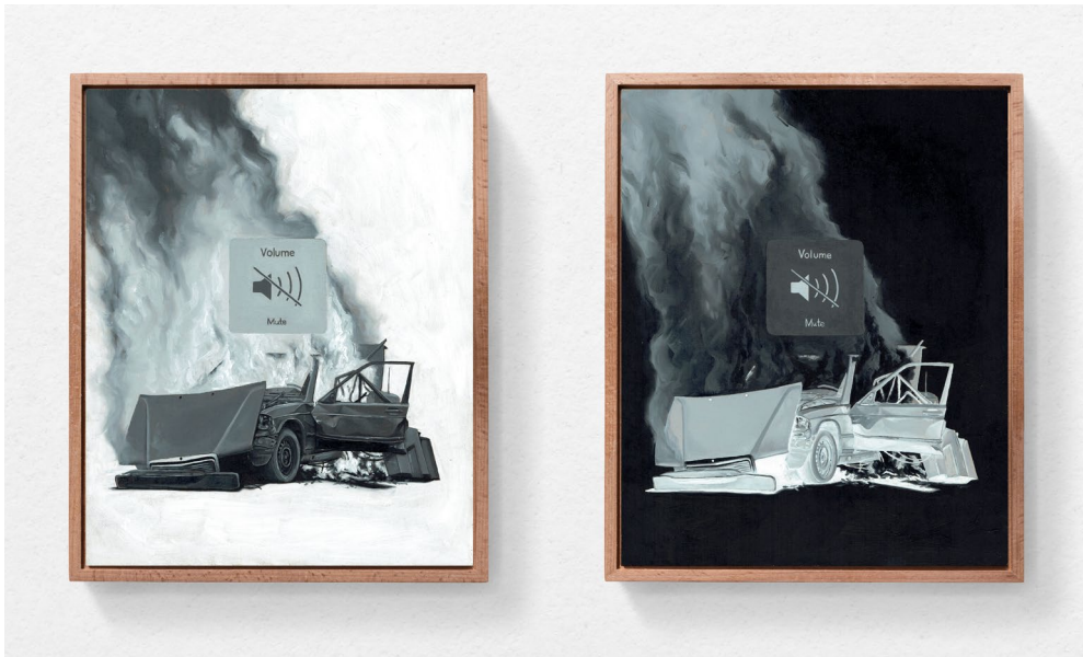
Mute (positiv) / Mute (negativ) 2021 je 24cm x 30cm, Öl auf Hartfaserplatte

Ausstellungsansicht, Regionale 22, ... von möglichen Welten, 2021. Kunsthalle Basel, 2021.