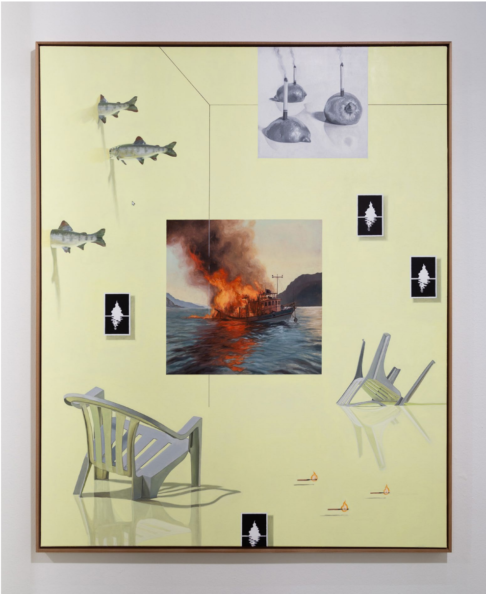
Werk 1: nature_morte_IV 2023 133cm x 163cm Öl auf Leinwand