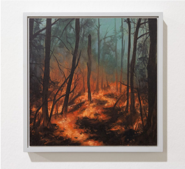
oben: /imagine/burning_3.jpg 2023 25.3cm x 25.3cm Öl auf Hartfaserplatte