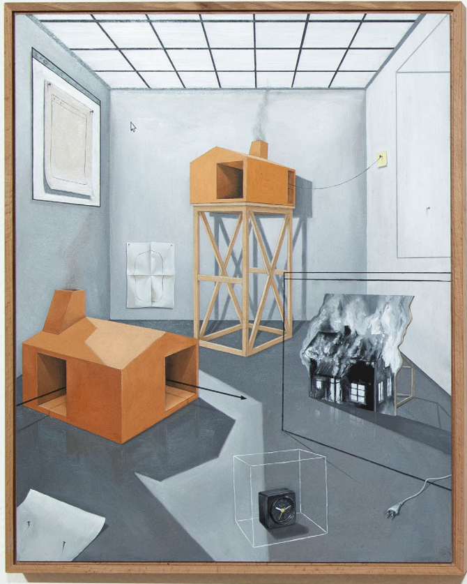
Aussichten_II 2022 40cm x 50cm, Öl auf Hartfaserplatte