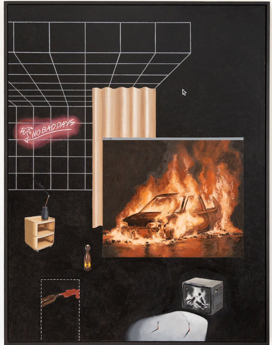
Room_raster_II 2022 60cm x 80cm Öl auf Hartfaserplatte