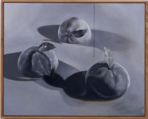
Objekt_II 2022 50cm x 40cm Öl auf Hartfaserplatte