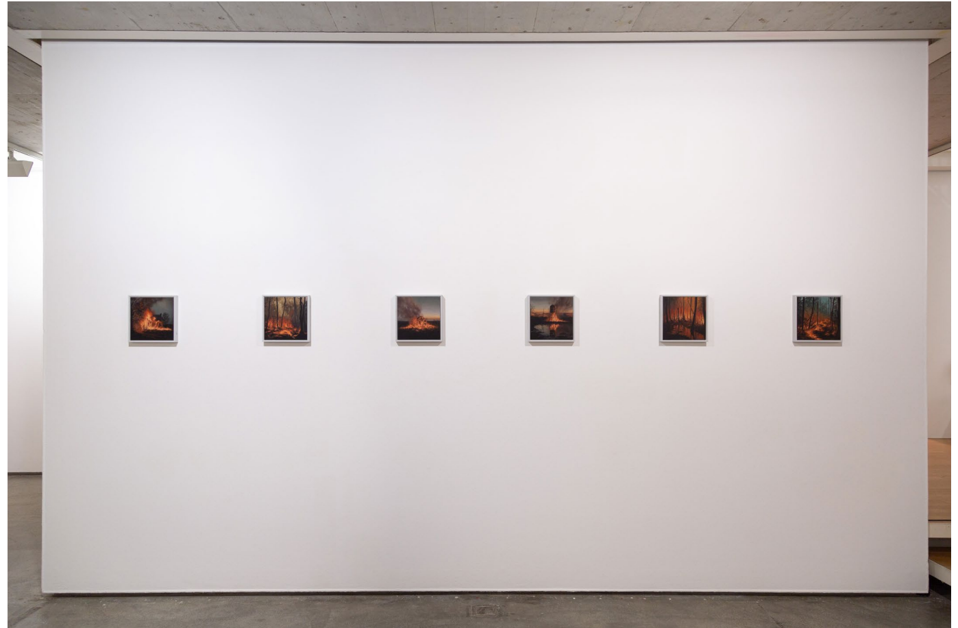
/imagine/burning_1-6.jpg 2023 je 25.3cm x 25.3cm Öl auf Hartfaserplatte