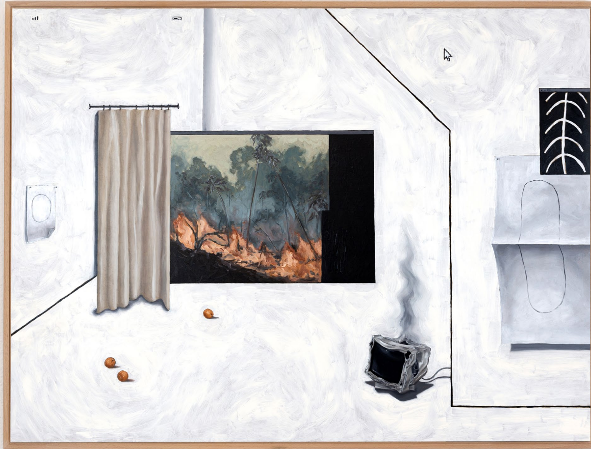
Room VII 2020 80cm x 60cm Öl auf Hartfaserplatte