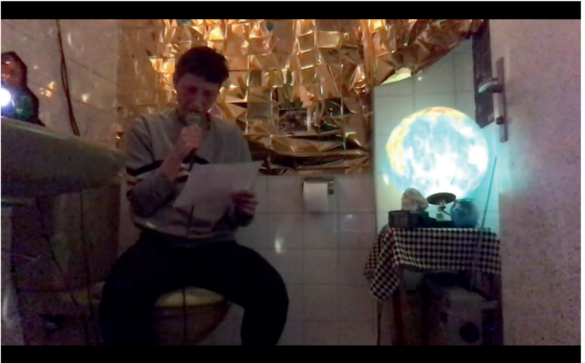
Disko Klo Reading , 2020, Livestream at Kapsel.Space, Link: https://vimeo.com/409768575