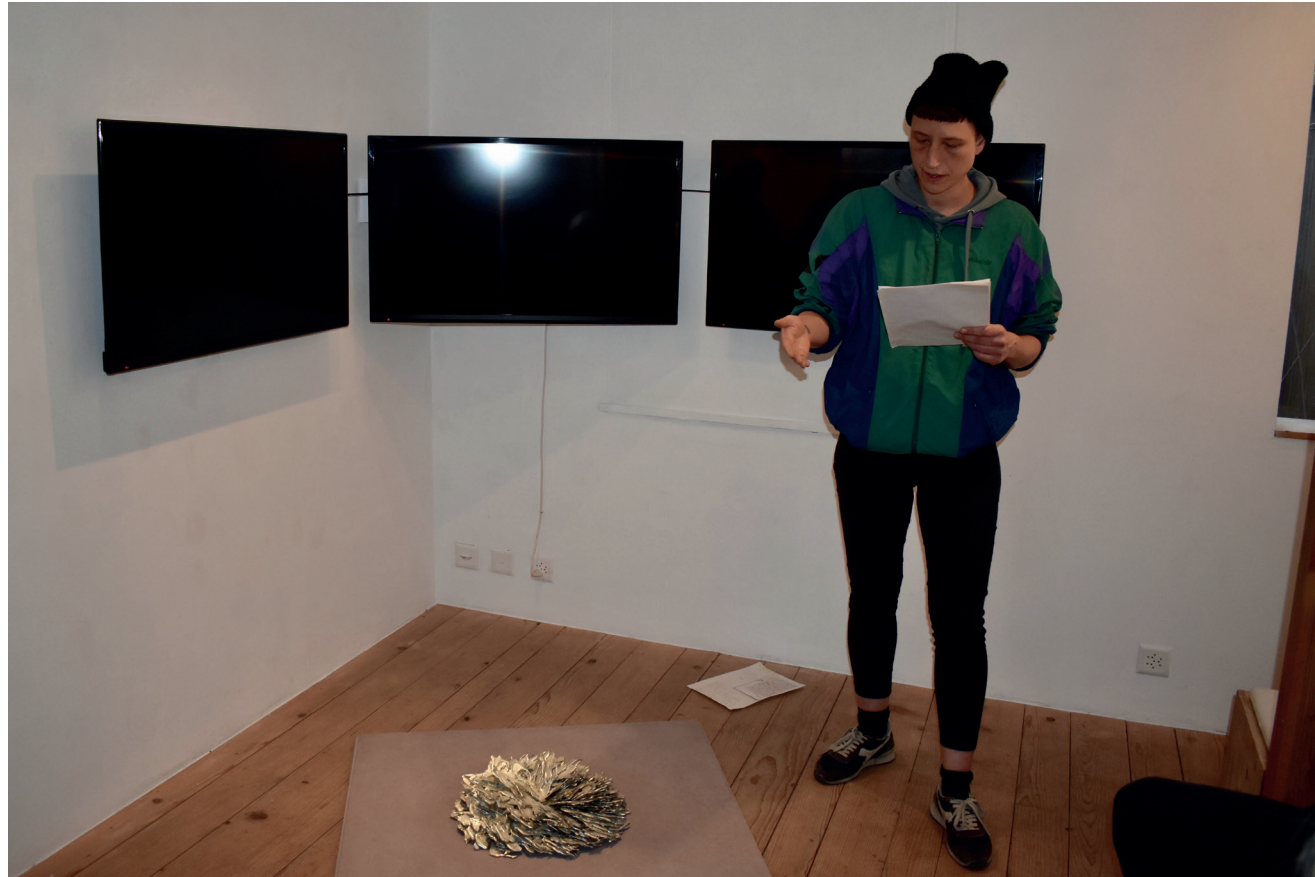
Lesung, 2020 Hesiod's Werke und Tage Ausstellungsansicht 9a am Stauffacherplatz