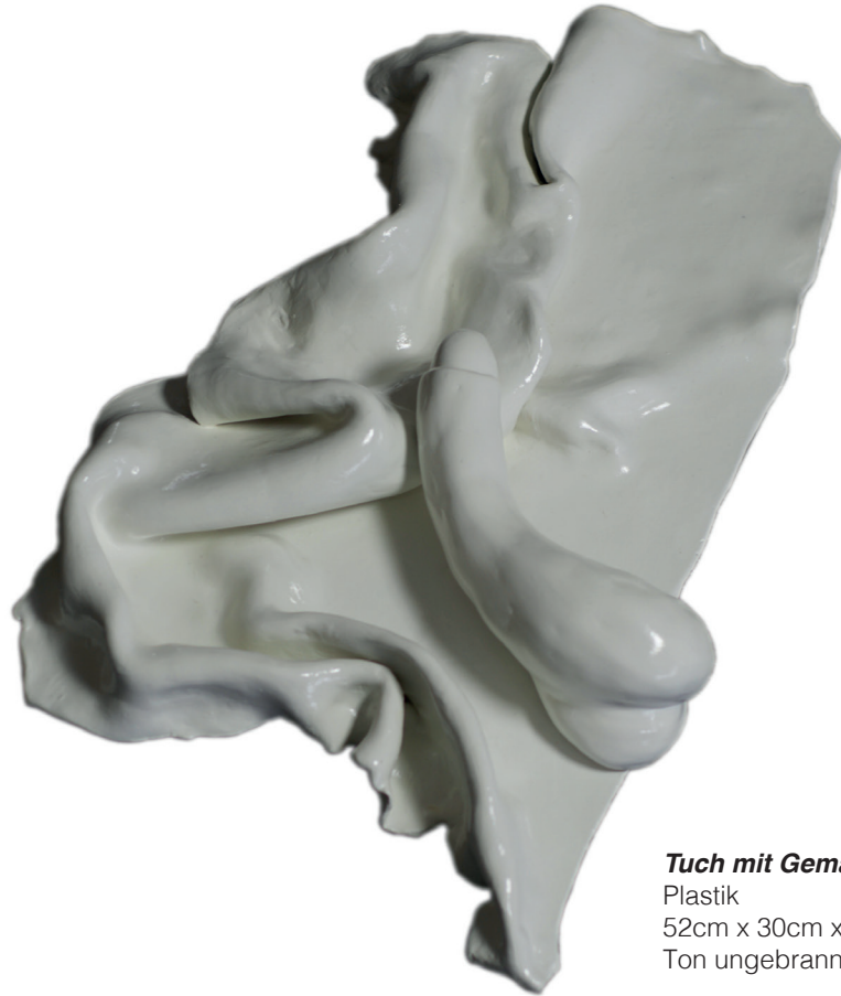
Tuch mit Gemächt , 2021 Plastik 52cm x 30cm x 8cm Ton ungebrannt, Acryl Lack