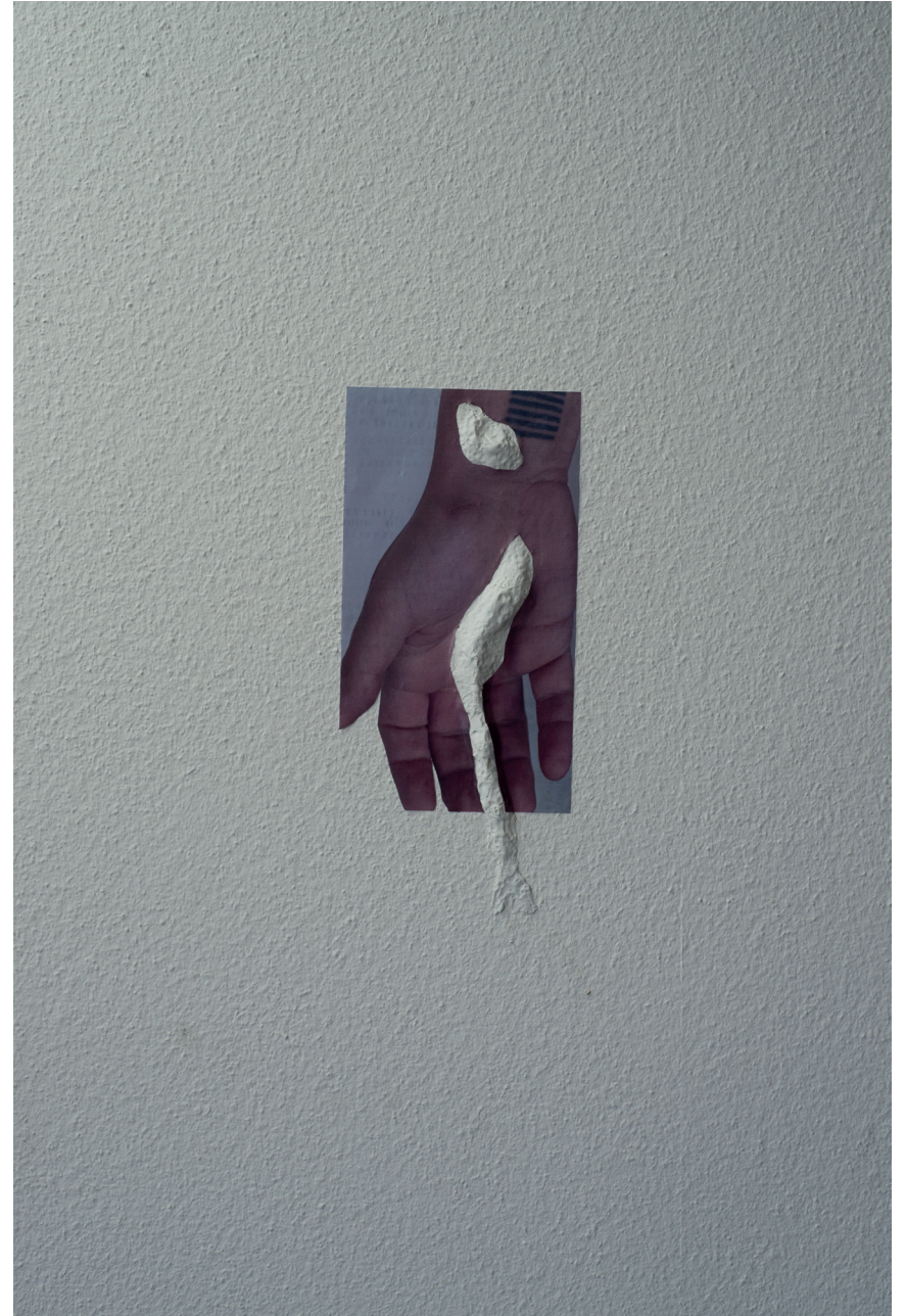
Echoing Void , 2020 Fotografie 92cm x 61cm Inkjet auf Papier