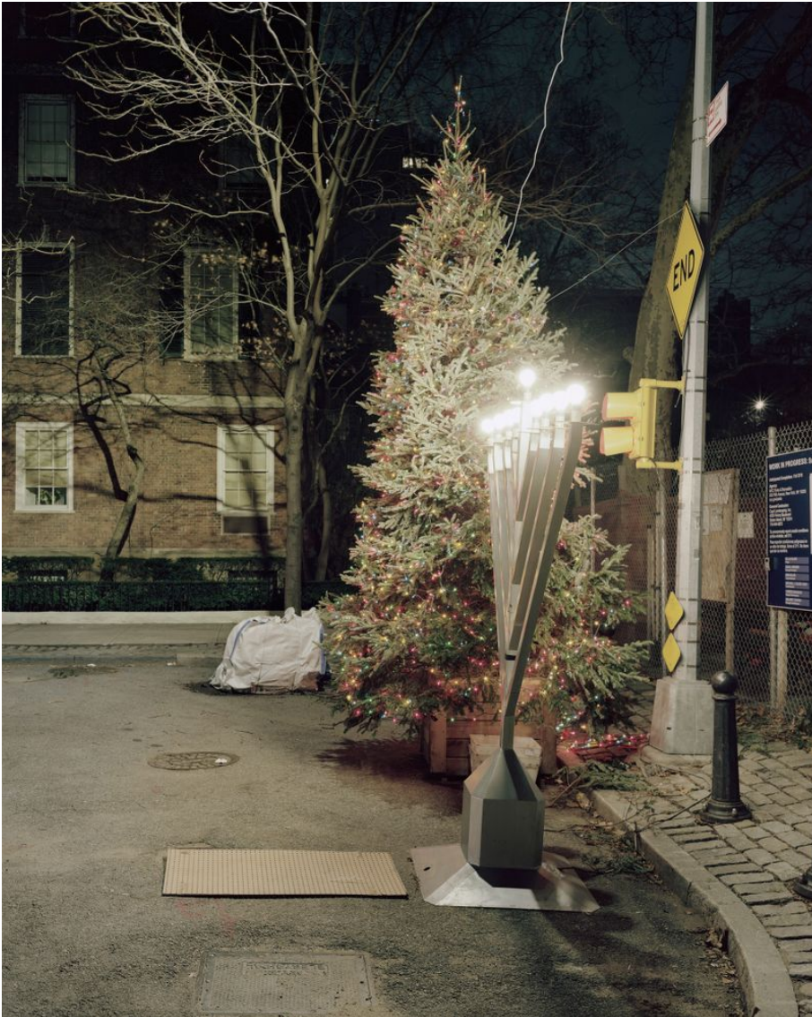
Dead End, 57th Street, Manhattan Untertitel: Manhattan Project Erstellungsdatum: 2019 Künstler*innen: Jonas Burkhalter Material & Technik: Pigmentprint Masse: 175 x 140 cm