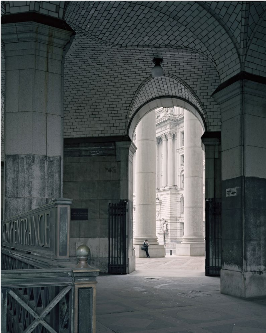
Municipal Building, Manhattan Untertitel: Manhattan Project Erstellungsdatum: 2019 Künstler*innen: Jonas Burkhalter Material & Technik: Pigmentprint Masse: 175 x 140 cm