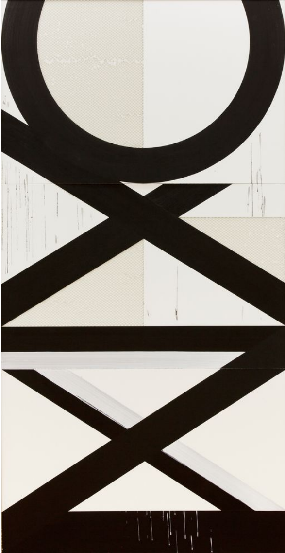
NYC Nr.5 Creation date: 2018 Artists: Jonas Burkhalter Material & Technique: Leimfarbe auf Hexamount Dimensions: 234 x 120 cm