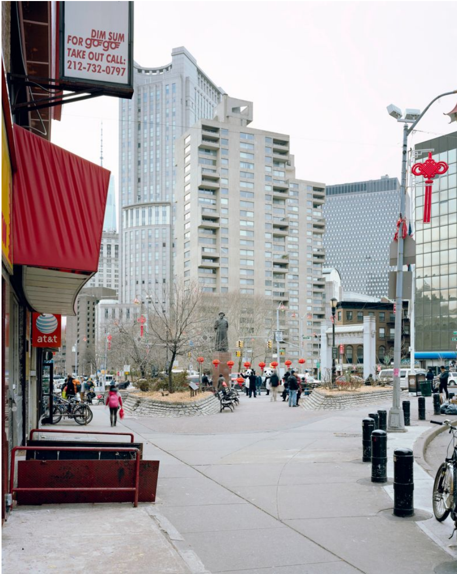
Kimalu Square, Manhattan Untertitel: Manhattan Project Erstellungsdatum: 2018 Künstler*innen: Jonas Burkhalter Material & Technik: Pigmentprint Masse: 175 x 140 cm