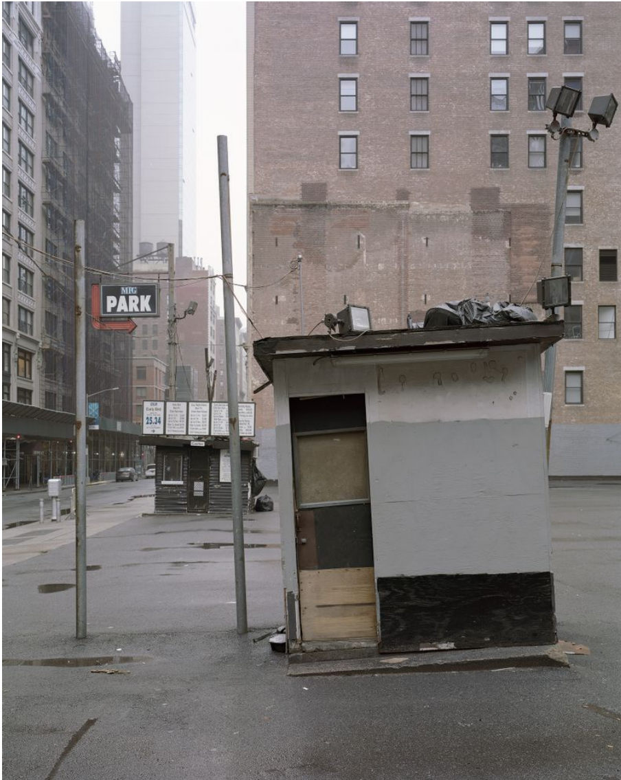
To Scully Untertitel: Manhattan Project Erstellungsdatum: 2020 Künstler*innen: Jonas Burkhalter Material & Technik: Pigmentprint Masse: 175 x 140 cm