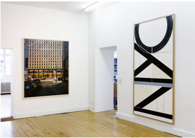
Exhibition view: OPPORTUNITY, 2018