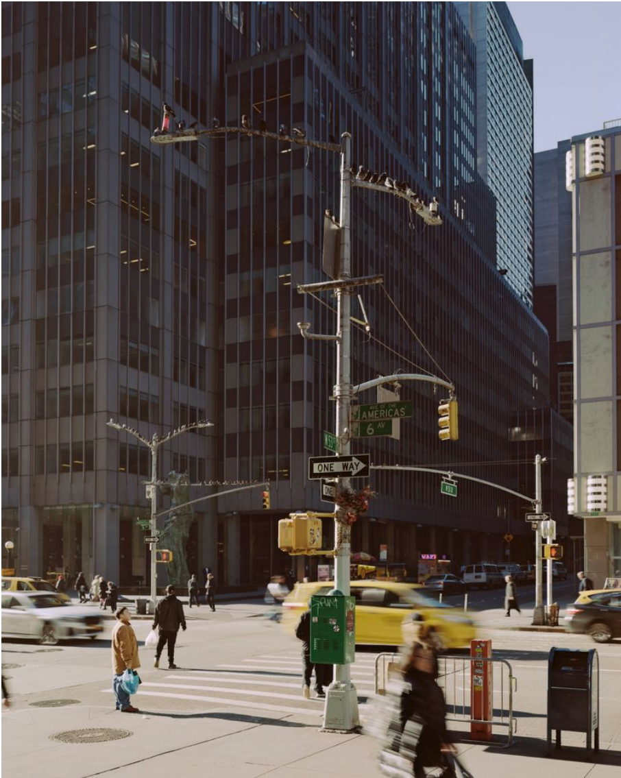
Avenue of the Americas and 53 Street, Manhattan Untertitel: Manhattan Project Erstellungsdatum: 2020 Künstler*innen: Jonas Burkhalter Material & Technik: Pigmentprint Masse: 175 x 140 cm