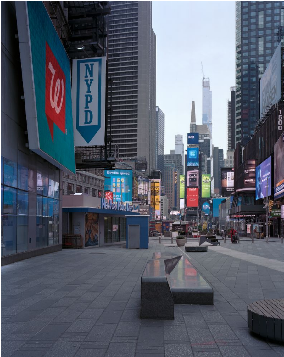
Time Square Untertitel: Manhattan Project Erstellungsdatum: 2020 Künstler*innen: Jonas Burkhalter Material & Technik: Pigmentprint Masse: 175 x 140 cm

Das Projekt hat den Titel ‚Manhattan Project‘ (begonnen 2018), das sich auf die Geografische Einschränkung des Projekts bezieht - die Insel Manhattan. Ich beschäftige mich darin mit meiner Sicht auf ein soziokulturelles Gefüge, das sich durch eine Verdichtung auszeichnet, die außergewöhnlich ist und in dem sich Gestaltungswillen und -vermögen des Menschen exemplarisch manifestiert. Alle Fotografien sind mit einer 8x10er Grossformat-Kamera im Hochformat aufgenommen.