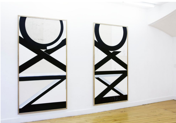
Exhibition view: OPPORTUNITY, 2018