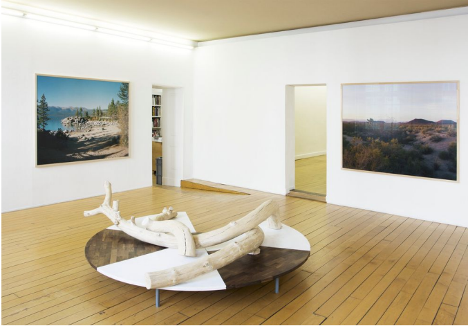
Exhibition view: OPPORTUNITY, 2018