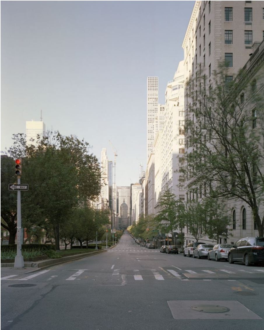
Park Avenue Untertitel: Manhattan Project Erstellungsdatum: 2020 Künstler*innen: Jonas Burkhalter Material & Technik: Pigmentprint Masse: 175 x 140 cm