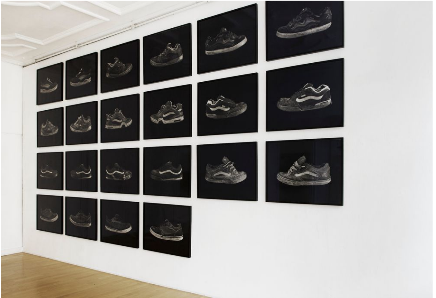
Exhibition view - OPPORTUNITY Datum: 2018 Ort: Basel-Stadt, Schweiz Institutionen: Stampa Gallery